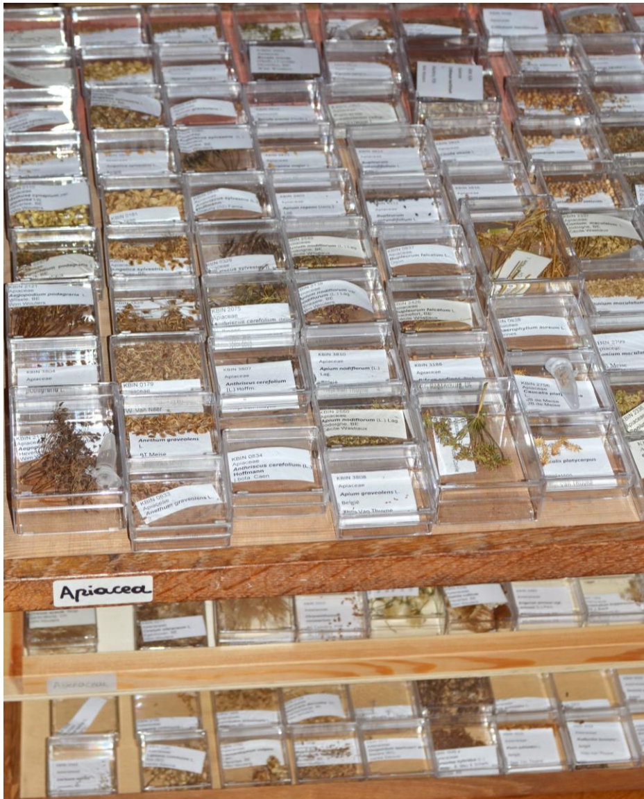
Referentiec collectie van macrobotanisch materiaal (zaden en vruchten) in het Koninklijk Belgisch Instituut voor Natuurwetenschappen.

Uit de antwoorden bleek duidelijk dat de opgebouwde archeologische referentiec collecties, waar het culturele artefacten betreft, sterk of geheel in functie staan van de specifieke expertise en de lokale werkzaamheden van de onderzoekseenheid of archeologische werkgroep. Ze zijn dus beperkt qua materiaalcategorie, culturele periode en regio.