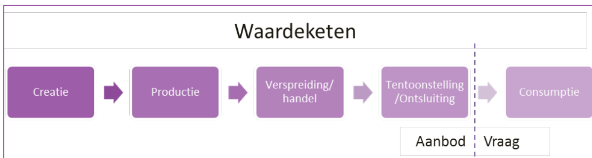
Figuur 2. Schakels in een waardeketen.

Om te bepalen welke activiteiten tot de bedrijfstak onroerend erfgoed behoren, maken we gebruik van het concept waardeketen , wat een voorstelling is van het vermarktningstraject van een product of dienst, van de creatie tot de consumptie ervan (zie Figuur 2 voor de schakels in een waardeketen). Een bedrijfstak omvat alle activiteiten die de voortbrenging van een bepaald goed of een bepaalde dienst tot doel hebben. Het goed hier is onroerend erfgoed. De bedrijfstak onroerend erfgoed kan aldus gedefinieerd worden als het geheel van activiteiten die tot doel hebben de instandhouding en ontsluiting van onroerend erfgoed, evenals aanverwante functies als beheer en educatie.