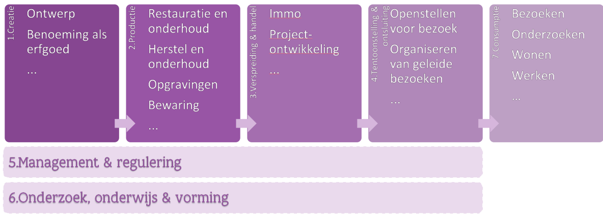
Figuur 3. De waardeketen van de bedrijfstak onroerend erfgoed.