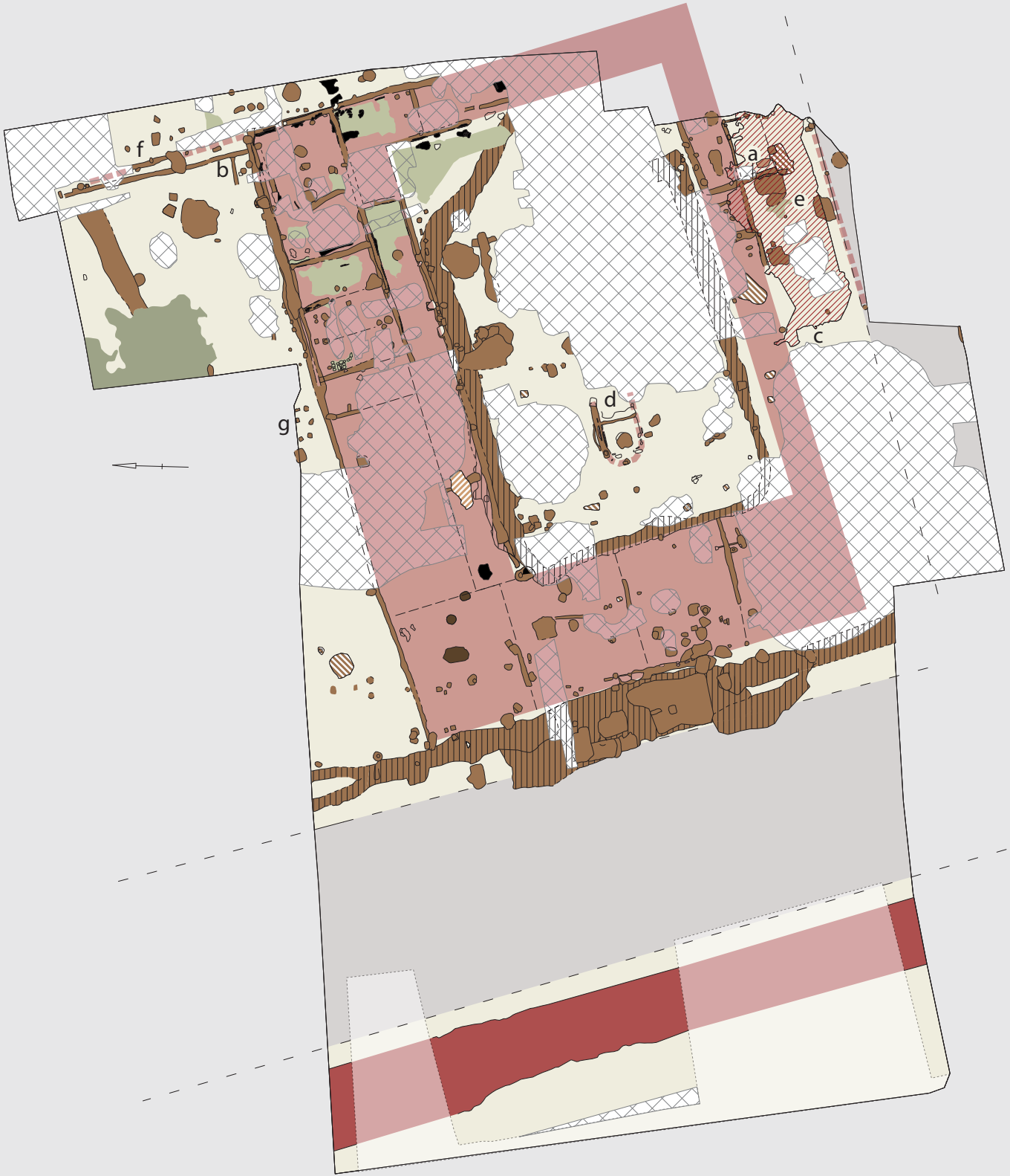
Plaat III: Situatieplan en vereenvoudigd opgravingsplan van de tweede fortperiode. Situation map and simplified excavation map of the second fort period.