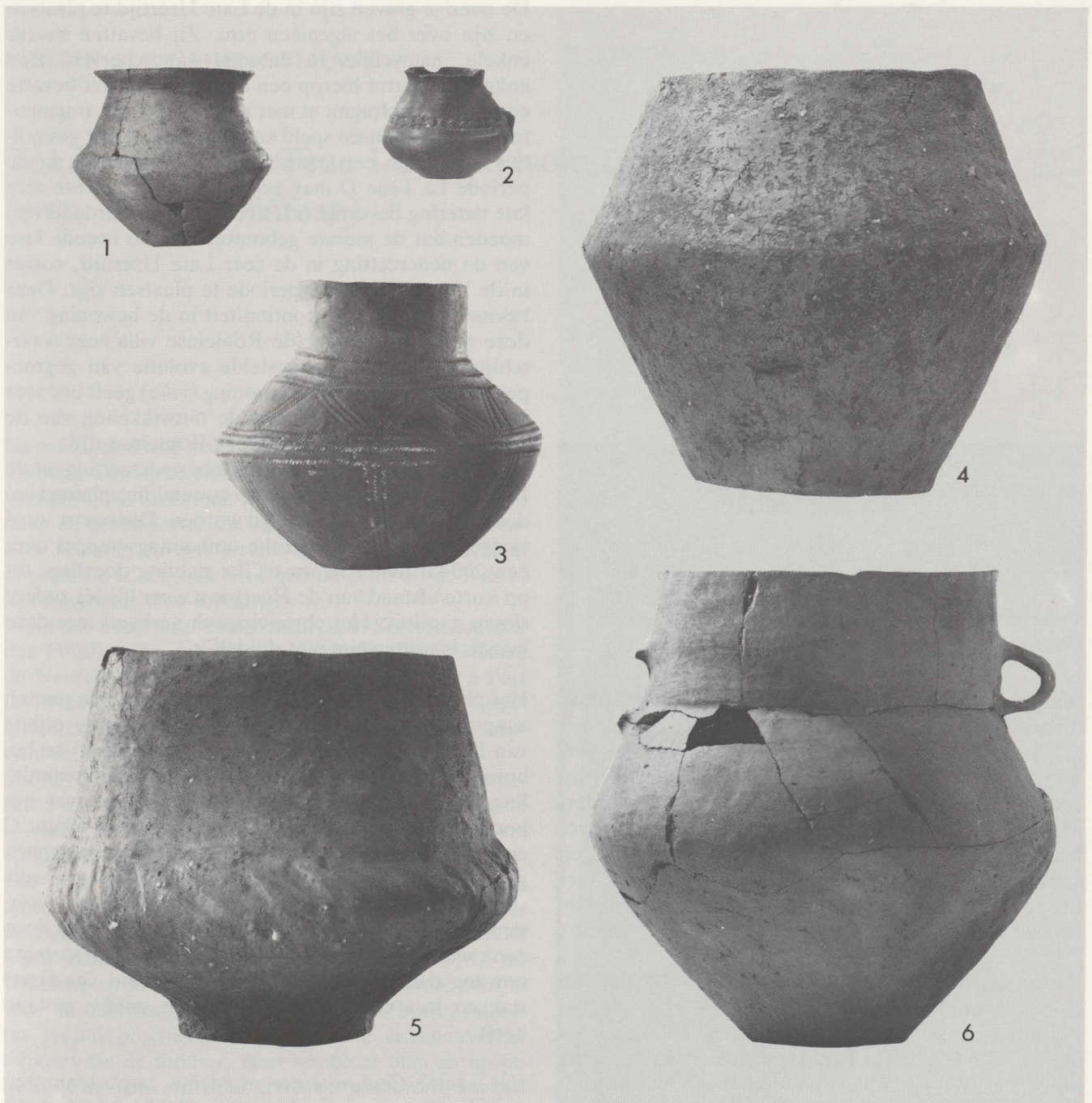
4 Een keuze van vaatwerk uit de Late Bronstijd. S. 113.

type (fig. 3:5-8), behalve een exemplaar met een brede, in doorsnede driehoekige band en fijne ingegrifte versiering (fig. 3:9). Verder zijn nog bijzonder te vermelden: een konische lansschoen (fig. 3:10), drie vergulde oorringen (fig. 3:11) en een spiraal (fig. 3:12). Deze bronzen geven interessante aanknopingspunten voor de vroege datering van deze zone van het urnenveld in de Late Bronstijd. Daarvoor komen eveneens enkele aardewerkvormen in aanmerking. Zo was de bronzen spiraal vergezeld van een biconische cylinderhalsurn met schuin uitstaande lip, een vorm die kenmerkend is voor de Hallstatt A — (eventueel A2) — periode of daarvan is afgeleid. Deze urn en enkele