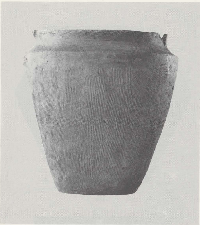
5 Situla-vormige urn uit de Midden IJzertijd. S. 1/3.

Midden-Duitsland en Polen verspreide Lausitzerkultuur mogelijk. Enkele scherven van een schaal met gegraveerde binnenversiering zijn daarentegen verwant met aardewerk uit West-Zwitserse nederzettingen. Vermelden wij tenslotte nog drie liploze cylinderhalsurnen, een klein exemplaar met een fijne ingekerfde versiering, gevuld met witte pasta (fig. 4:3), en twee grotere van meer afgeronde vorm, de eerste met twee bandvormige oren aan de hals (fig. 4:6), de tweede met twee kleine oortjes onderaan de buik.