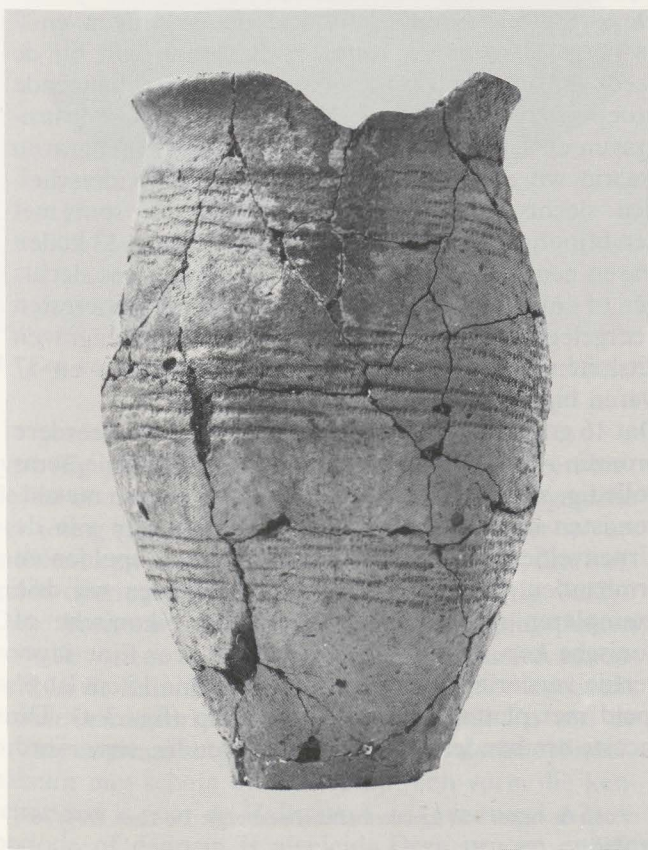
1 Wikkeldraadbeker uit de Vroege Bronstijd. S. 1/3.