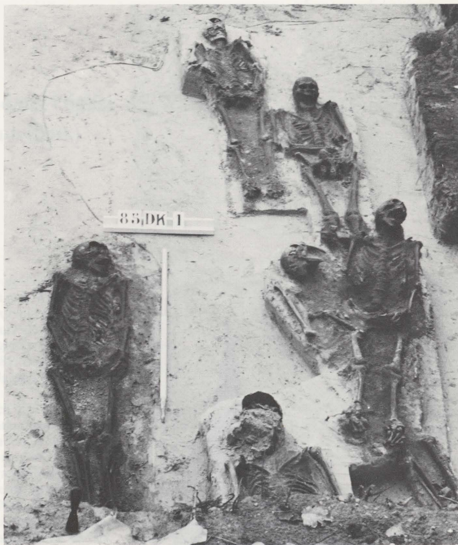
2 Deel van het monnikengrafveld.

grafveld van de monniken aangesneden (fig. 1:10). De rijen graven beginnen onmiddellijk tegen de oostmuur van het transept. Bepaalde graven werden ten andere bij de afbraak van de kerk verstoord.