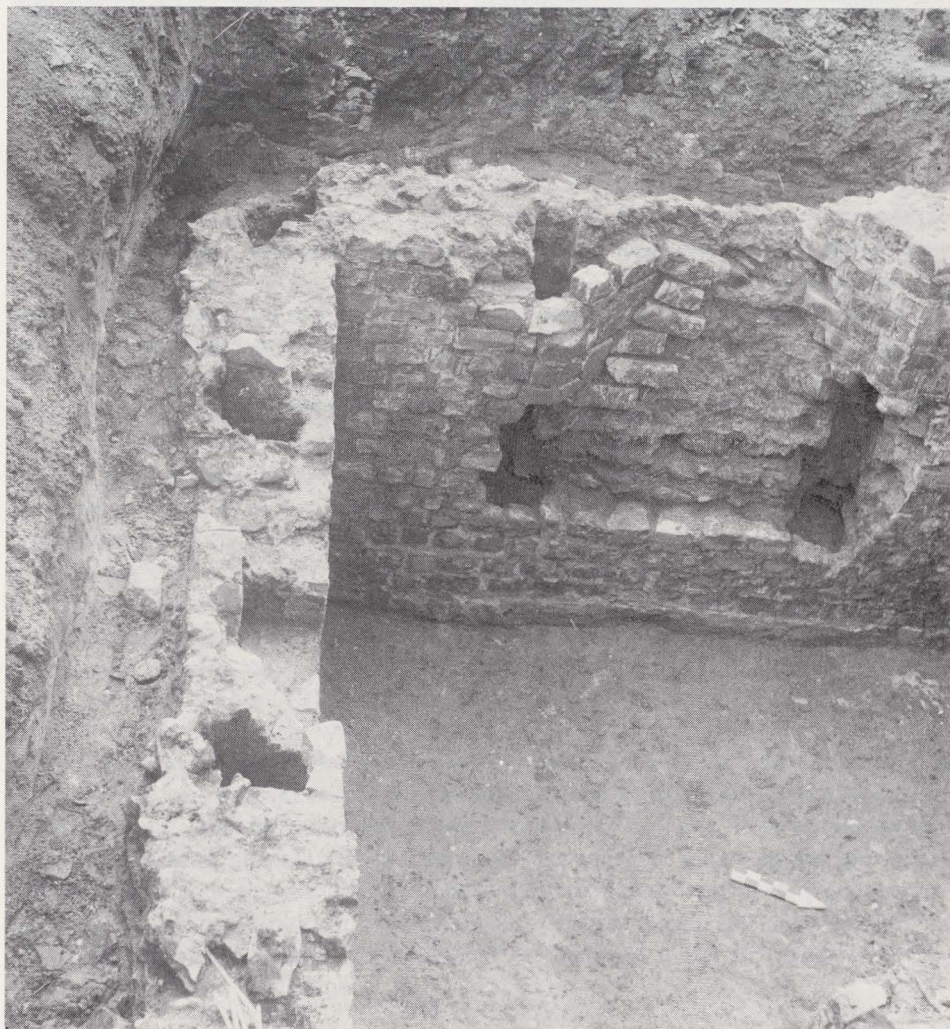
Fig. 22. — Keldergebouw met luchtgat.

Naar aanleiding van het optrekken van nieuwe gebouwen werd een noodgraving ondernomen op de terreinen van de Rijksnormaalschool bij de Sacramentsstraat te Tongeren. De bouwzone lag binnen een insula aan de noordoostelijke rand van de Romeinse stad (fig. 23) (1) . Om veiligheidsredenen mocht in principe niet dieper gegraven worden dan 90 cm.