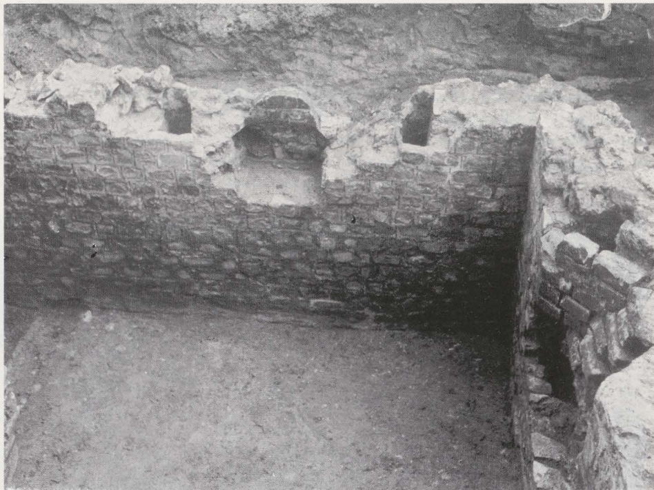
Fig. 24. — Keldergebouw met nis.