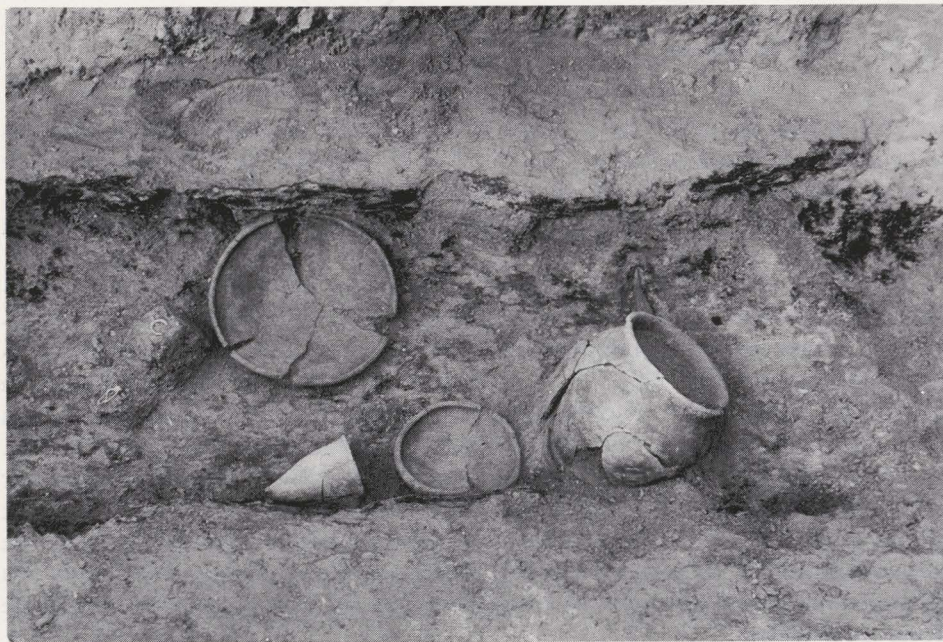
Fig. 22. — Vue du fond de la tombe.

Du 17 juillet au 1 er août 1975, nous avons ouvert une tombelle isolée située sur la commune d'Orgeo, au nord du hameau de Nevraumont, dans un lieu-dit A Jausset . Etablie près d'un sommet, à une altitude de 528 m, la tombelle présentait un diamètre de 20 m environ pour une hauteur de quelque 0,40 m.