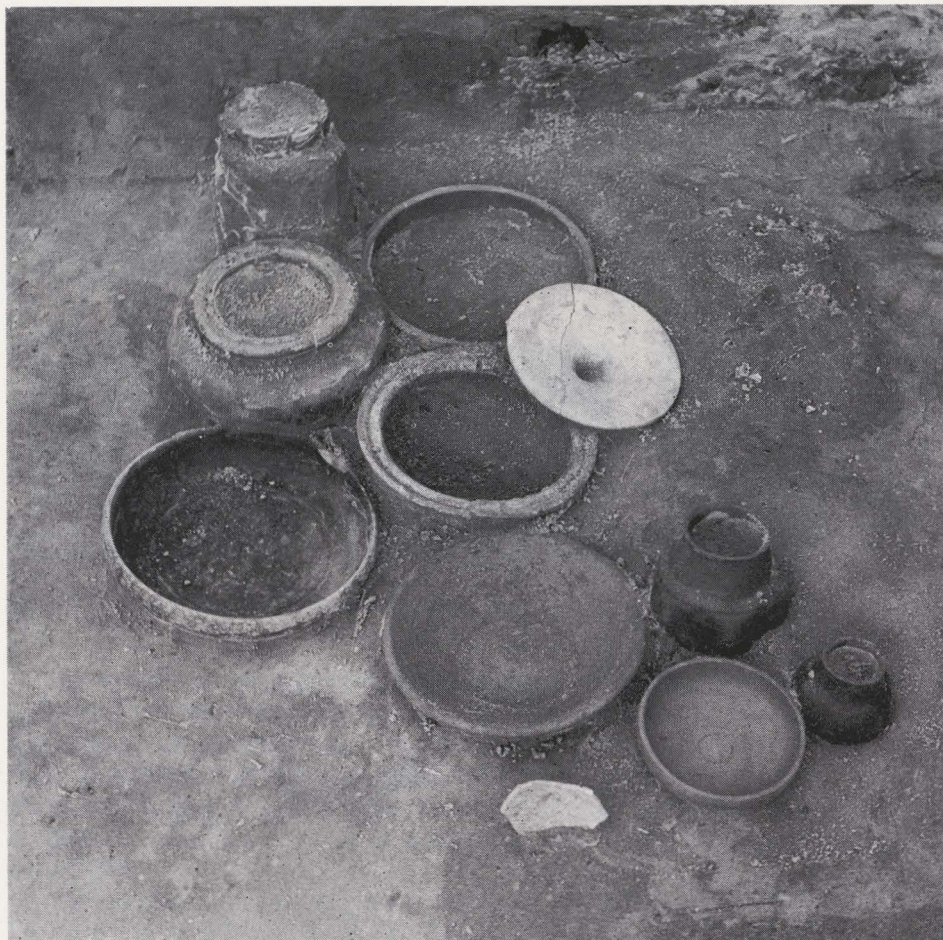
Fig. 40. — Graf 123.

voorwerp in de nog natte klei werd ingeritst. In vijf graven werden twee dergelijke schalen aangetroffen. In graf 91 waren ze vergezeld van een ijzeren draad- en een bronzen knikfibula. Ook vonden we soms een ijzeren riemhaak of ringetje, een gebakken slingerkogel en fragmentjes van gele en blauwe glazen armbandjes uit deze periode.