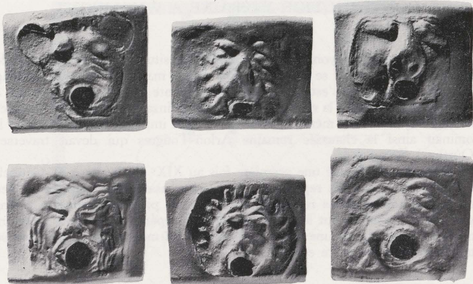
Fig. 42. — Leeuwekoppen op Drag. 45.

In zeven van de negen graven vonden we een mortarium in terra sigillata, type Drag. 45 met leeuwepopje in appliqué op de rand (fig. 42). Deze mortaria zijn alle in oostgallische waar. In twee andere graven (7,73) kwam een mortarium in gewone lichtkleurige keramiek voor en verder vonden we in de archeologische laag rond de graven opvallend veel randscherven van mortaria in gewoon aardewerk, die een zeer grote diversiteit aan vormen vertegenwoordigen.