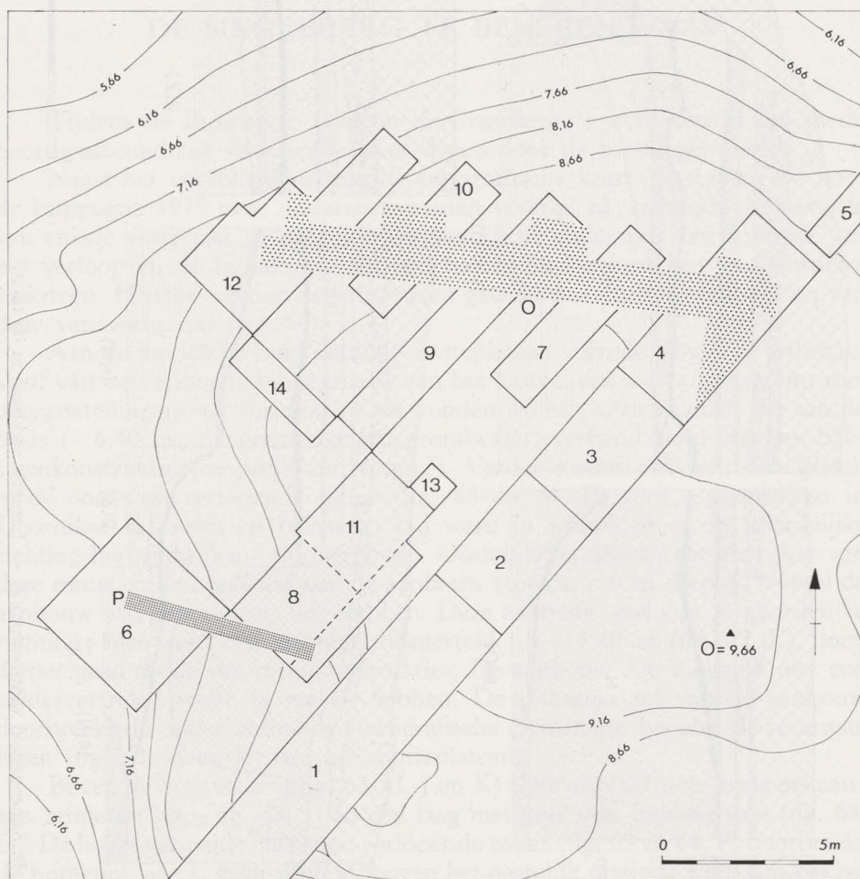
Fig. 64. — De opgravingen 1974-1975 op het motteplateau.

De heuvelkern (J) daalt in een plotse overgang met ca. 1 m. Deze knik in de heuvelkern, ook reeds vorig jaar vastgesteld, is gevuld met afvalmateriaal van loopvlak I en de brandlaag G. In de knik, in de afval van de brandlaag, werd onder meer een verbrand zilveren muntje gevonden. Het is een penning van SIMON, monetariër van de graven van Vlaanderen, Dirk en Filips van den Elzas, en te dateren tussen 1140 en 1180 (1) . De geschreven bronnen vermelden het platbranden van de sterkte in 1158.