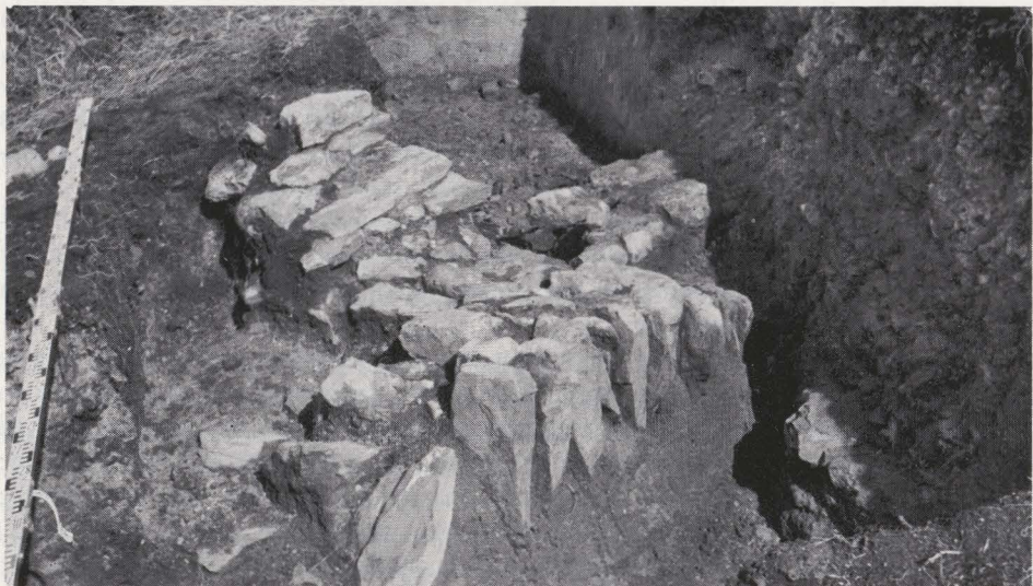
Fig. 66. — De noordwesthoek van de donjon.

ving van het centrum van het motteplateau in noordelijke richting met zich mee; vermoedelijk ook de reden waarom bovengenoemd gebouw thans op de rand van de zuidelijke helling van de motte ligt en waarom er geen sporen van de zuidelijke helft van het gebouw schijnen bewaard te zijn. De nivellering