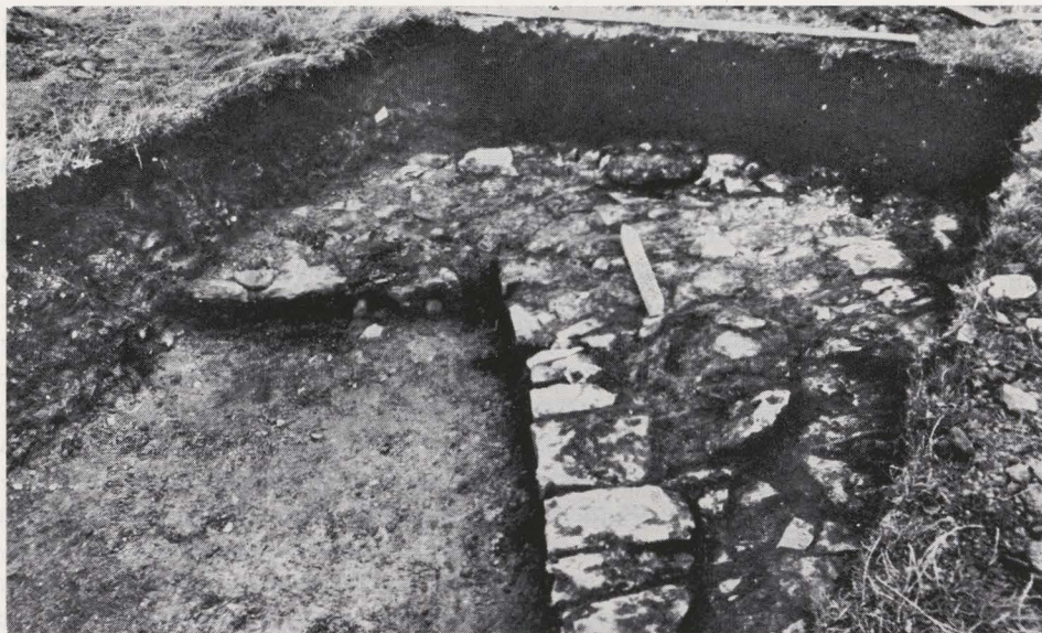
Fig. 65. — De noordoosthoek van de donjon.