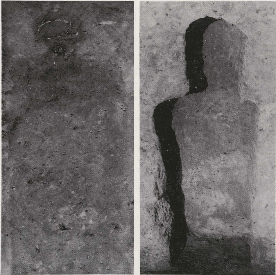
Fig. 41. — Zicht op twee antropomorfe graven.

dit graftype in onbruik geraakt te zijn en werd het meer en meer vervangen door het antropomorfe type. Bij dit laatste versmalden de kuilen onderaan zodanig dat het gebruik van houten kisten onmogelijk gemaakt werd, aangezien de kuilwanden het dode lichaam nauw omsloten. In het harde zand werd het silhouet zo uitgehouwen dat voor het hoofd een aparte rechthoekige of ronde nis uitgespaard bleef (fig. 40 : 4-7 en fig. 41). In de nis was het zand minder diep weggehaald, zodat voor het hoofd een steuntje uitgespaard bleef. Bij de graflegging verzekerde dit aan het lijk een iets estetiescher houding en het verhinderde het achteroverkantelen van de schedel. In één geval stelden we vast dat beide lange zijden van de schouders tot aan het voeteinde met kleine planken gestut waren (fig. 40 : 7).