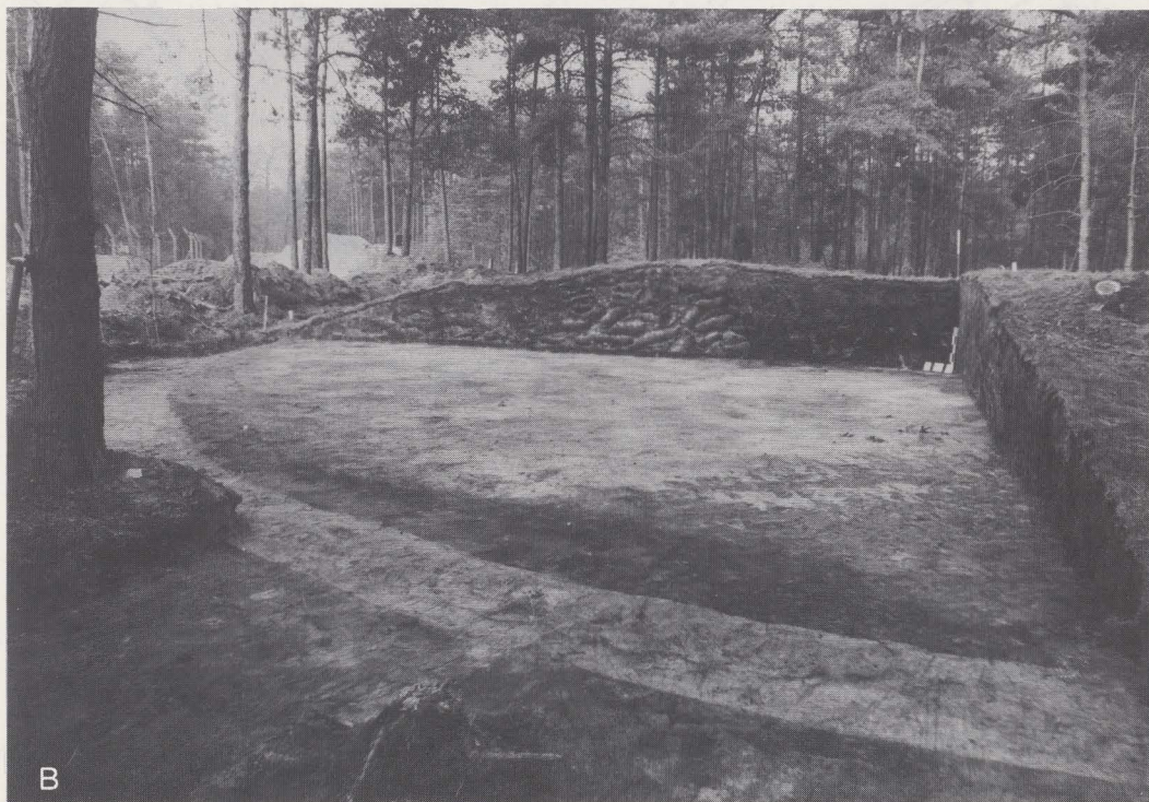
Fig. 11. Zicht op een der westprofielen (A) en op het zuidoostkwadrant (B).