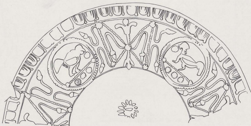
Fig. 29. Versiering op terra sigillata-kom; rozet onderaan op de bodem. S. 1/2.

Het zuidelijk deel van de onderzochte sektor vertoont een vrij gecompliceerde stratigrafie (fig. 30). De funderingen van het stenen gebouw K werden er aangelegd op een 1 m dik pakket van zand- en puinlagen (houtschool en verbrande leem), waarmede het terrein hier vermoedelijk opgehoogd werd. Onderaan onderscheidt men een aantal elkaar oversnijdende kuilen waarvan de bodem maximaal tot 2,15 m onder de huidige oppervlakte reikt. In deze context werd weinig of geen materiaal aangetroffen. Meer noordwaarts zijn een aantal paalgaten en voornamelijk afvalkuilen aanwezig. Enkele daarvan behoren tot de houtbouwfase en hun inhoud laat toe het begin van de