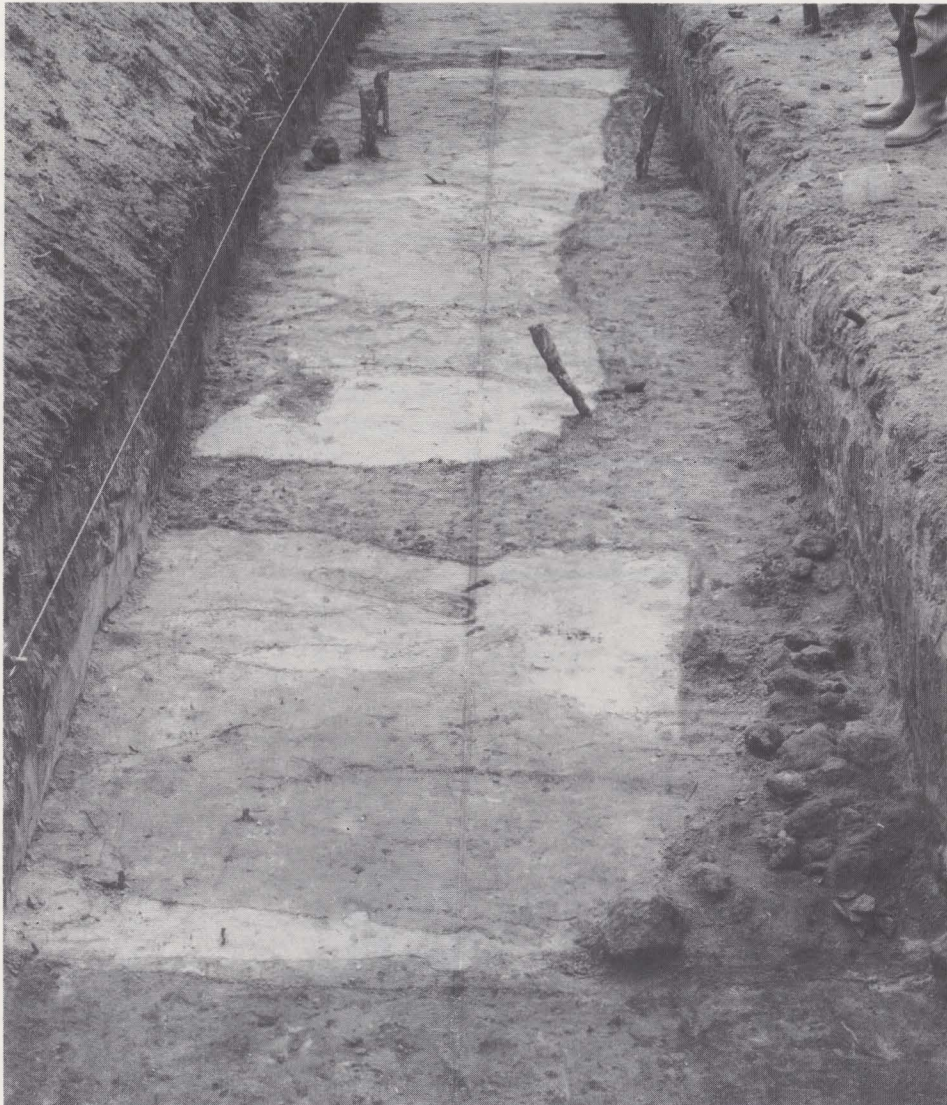
Fig. 31. Negatieve muren in sleuf 77/I.

De tweede bewoningsfase is vertegenwoordigd door enkele negatieve muren (fig. 31), die het aantal tijdens de laatste jaren onderzochte en gelocali-