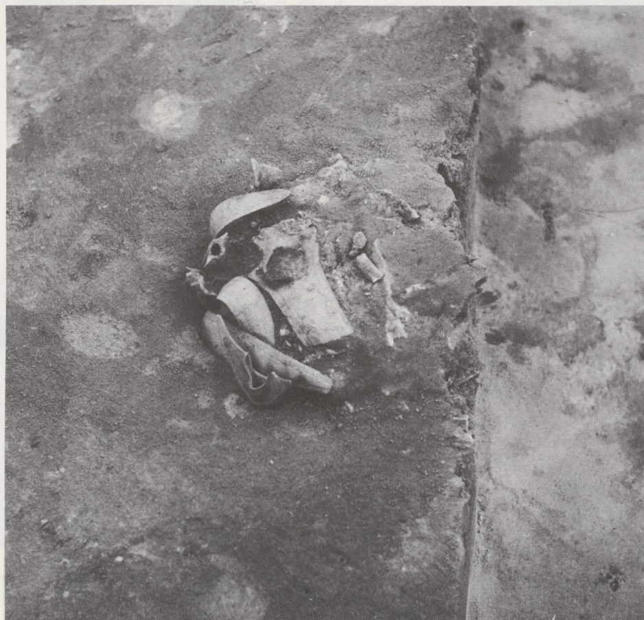
Fig. 38. Het graf tijdens de opgraving, vanuit het zuiden gezien.

Hadden de opgravingen te Rekem, waarover sprake in vorige bijdrage, al een interessante reeks graven opgeleverd, dan lag er in een der laatste ontdekte graven toch nog een verrassing verscholen. Op ongeveer 45-50 cm diepte tekende graf 72 zich af als een klein kuiltje, gevuld met beenderresten, een gewoon brandgraf zonder urn op het eerste zicht. Hier en daar vonden we tussen de verbrande beenderen kleine stukjes brons, niets uitzonderlijks aangezien dit in zulke beendergraven een gewoon verschijnsel is, dat zijn oorsprong vindt in het feit dat de dode gekleed en met zijn of haar juwelen getooid werd verast. Aangezien het toeval gewild had dat de helft van de kleine grafkuil nog achter de wand van de sleuf verscholen lag, moest nog eerst een blok aarde weggegraven worden om het graf volledig vrij te krijgen.