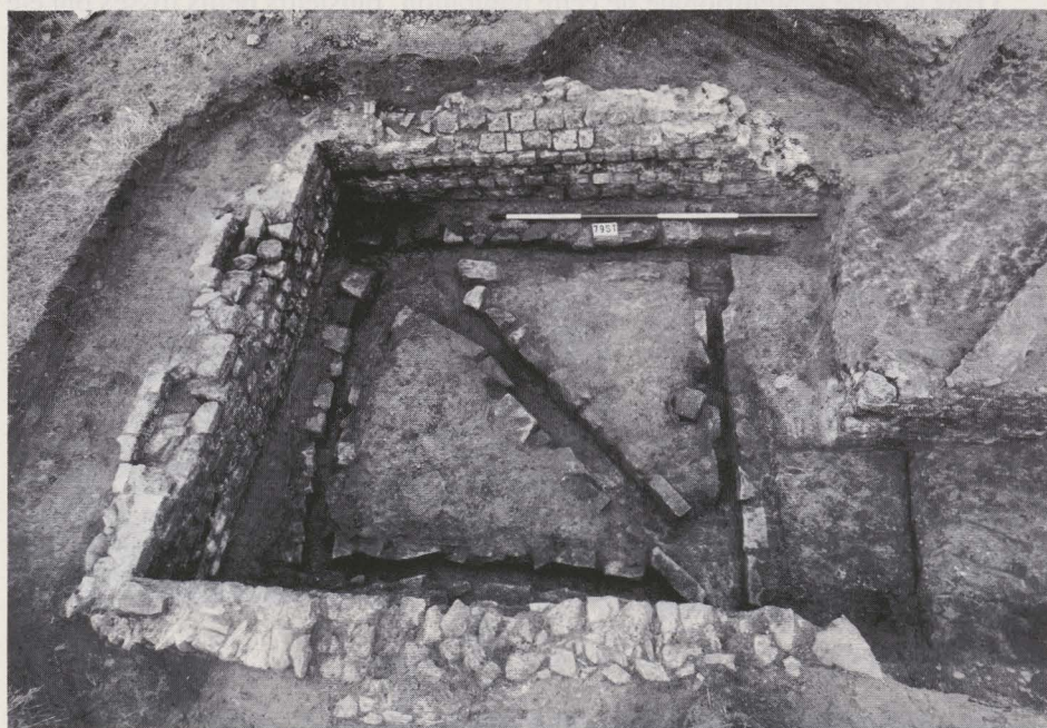
Fig. 26. La cave.

Au nord du village, des fragments de tuiles indiquaient l'emplacement d'une construction romaine établie à l'est et contre la chaussée, au lieu-dit Germeuse terre , sur le haut du rebord septentrional d'un petit plateau (14) .