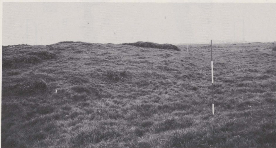
Fig. 61. De mote vanuit het noordoosten gezien.

Het site wordt gevormd door een mote en een tweeledig voorhof, beiden omgeven door nog zichtbare grachten. De mote werd omzeggens volledig onderzocht. Op het voorhof bleef de opgraving beperkt.