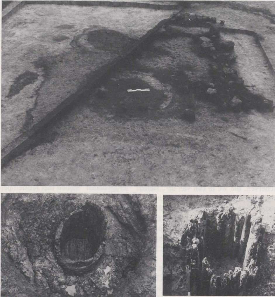
Fig. 21. Een der „stallen”, met de trechters van beide waterputten en de resten van de ijzerzandsteenfundering; onderaan de boomstam- en de berkestamput.

tegenstelling tot beide vorige, die volledig „leeg” waren, vonden we in deze laatste de resten van twee sandaaltjes, een bronzen klokje en wat keramiek. De bodem van deze put was „geplaveid” met 4 stenen handmolens en 2 grote molenstenen.