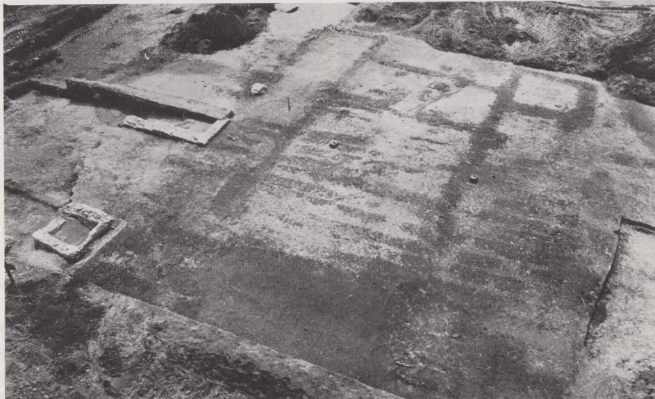
Fig. 39. Het hoofdgebouw van de Romeinse villa. Links, een badkuip van het balneum .

zaal met halfronde absis (11), een badgebouw dat twee of driemaal werd vergroot (12). In zijn laatste toestand omvatte het drie badkuipen, een kanaal- en twee pijlerhypocausten, en een gemeenschappelijk praefurnium . Voor de gevel lag een houten waterbekken (13), dat met leem waterdicht was gestreken terwijl de twee rijen van kuilen die waaivormig voor de galerij liggen, misschien iets te maken hebben met de beplanting van een tuin rond dit bekken. Belangrijk is dat het in 1980 onderzochte bijgebouw samengaat met de derde bouwphase van het woonhuis en de oprichting van het eerste balneum .