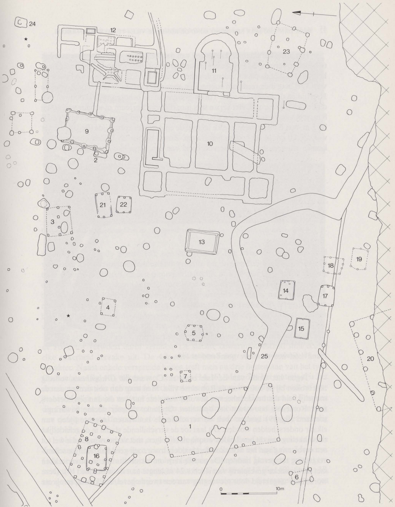
Fig. 37. Uittreksel uit het algemeen opgravingsplan.