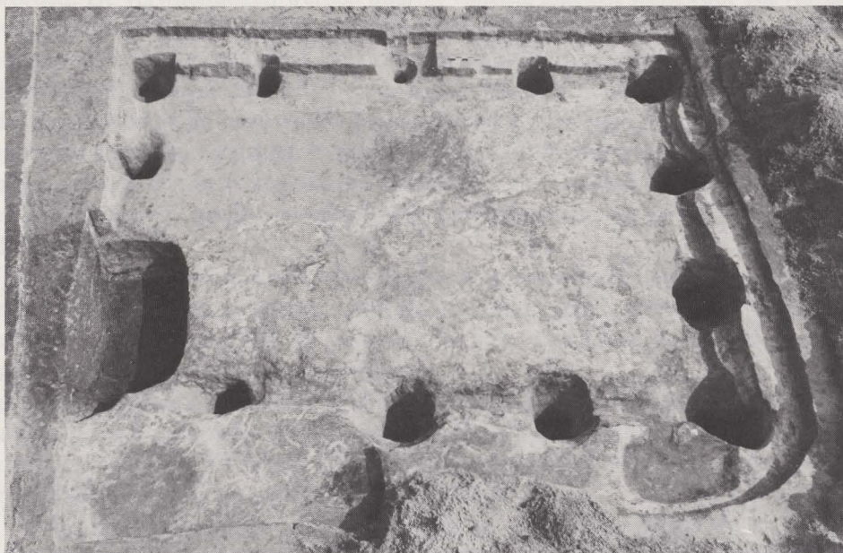
Fig. 38. Grubenhaus uit de vroeg-Romeinse tijd.

Het juiste karakter en de omvang van deze nederzetting is totnogtoe moeilijk te bepalen, vermits zij zich buiten de opgegraven sektor uitstrekt. Evenmin staat het reeds vast of de plaats tijdens de gehele IJzertijd zonder onderbreking bewoond was. Wel mag men reeds een continuïteit aannemen tussen de late vóór-Romeinse IJzertijd en de Romeinse villa. Tot de overgangsfase behoren twee gebouwen met duidelijke plattegrond. Het eerste was mogelijk een horreum of schuur van 10 bij 8 m, met vier zware nokpalen (fig. 37, 8), het tweede een groot Grubenhaus van 8 bij 5 m, met 5 diepe palen in elke langszijde en 4 in elke korte zijde (fig. 38, 9); het was ca. 80 cm in de bodem ingegraven. Zowel binnen als buiten onze grenzen kennen wij geen vergelijkbaar voorbeeld van een dergelijke constructie.