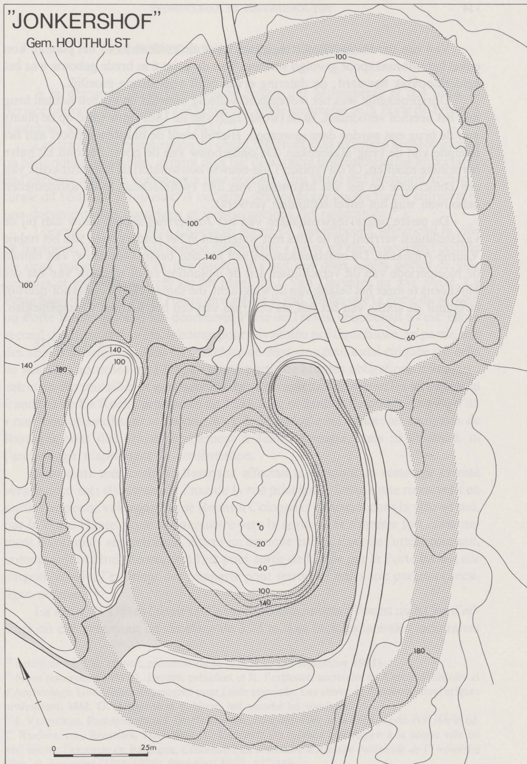
Fig. 77. Microtopografische opname met interpretatie van de walgrachten.