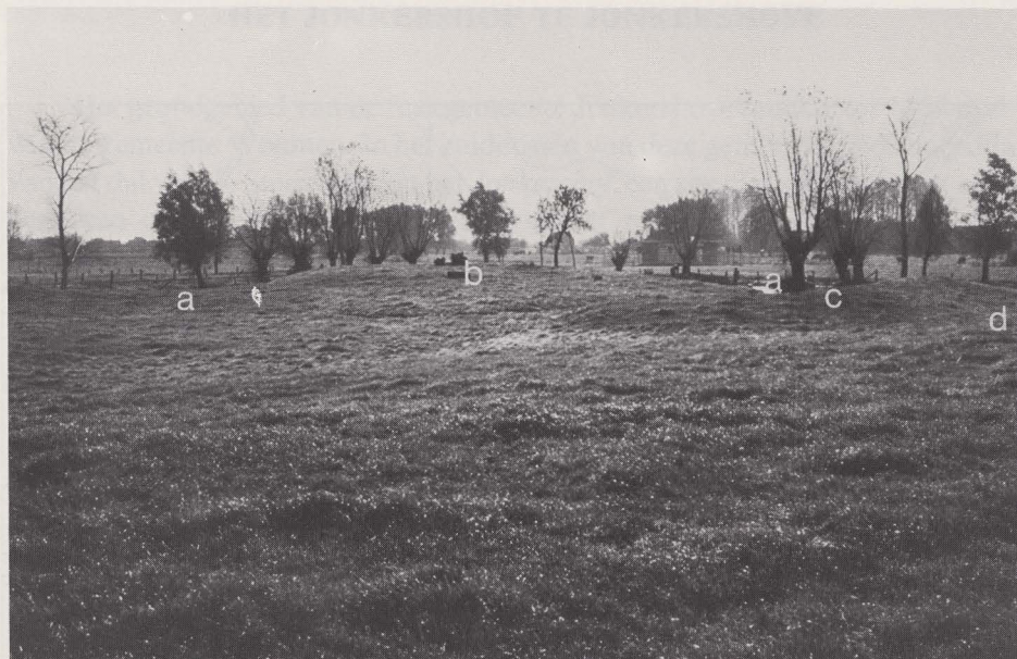
Fig. 76. Het opperhof vanuit het noordwesten. a : binnenwalgracht. b : het wooneiland. c : berm. d : buitenwalgracht.

belangrijke hoeveelheid schervenmateriaal bevatte, dat uiterlijk uit de tweede helft van de 13de eeuw dateerde. Deze vondsten, die meteen de terminus post quem van het complex leveren, moeten in verband gebracht worden met de opgave van een niet onbelangrijke bewoning in de onmiddellijke omgeving. Vermeldenswaard hierbij is de aanwezigheid van enkele 11de-eeuwse scherven.