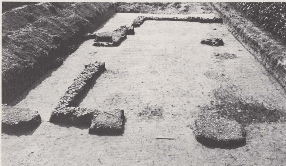
Fig. 27bis. De pijlers van gebouw 5 en het zuidelijk deel van gebouw 6.

een verhoging van het aantal inwoners die niet noodzakelijk door het aantrekken van vreemde werkkrachten maar tevens door een demografische aangroei van de oorspronkelijke familiale kern kan verklaard worden.