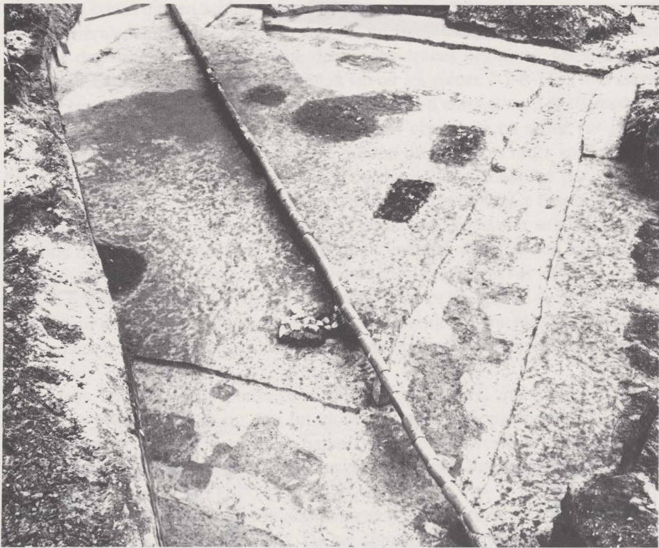
Fig. 26. Het houten bijgebouw 4.

De voortzetting van het systematisch onderzoek te Neerharen-Rekem (cf. supra ) verschaft interessante nieuwe gegevens betreffende het uitzicht en de ontwikkeling van de Romeinse villa ( Arch. Belg. , 238, 37-41, en 247, 70-74). In 1982 konden wij nog twee annexen opgraven, zij het nog onvolledig. Al deze gebouwen liggen regelmatig verspreid over een oppervlakte van ca. 180 bij 115 m, aan de oever van de oude Maas (fig. 27). Het lijkt niet uitgesloten dat de sporen van een vierde, houten bijgebouw, ten zuidwesten van het woonhuis, aan onze aandacht ontsnapt zijn, wanneer wij in 1980 de ontgrondingswerken in die sektor slechts oppervlakkig hebben kunnen volgen. Alleen aan de oostzijde werd een stukje van een hofmuur gevonden, die op enkele meters afstand de lichte bocht van de maasoever volgt (fig. 27, 7).