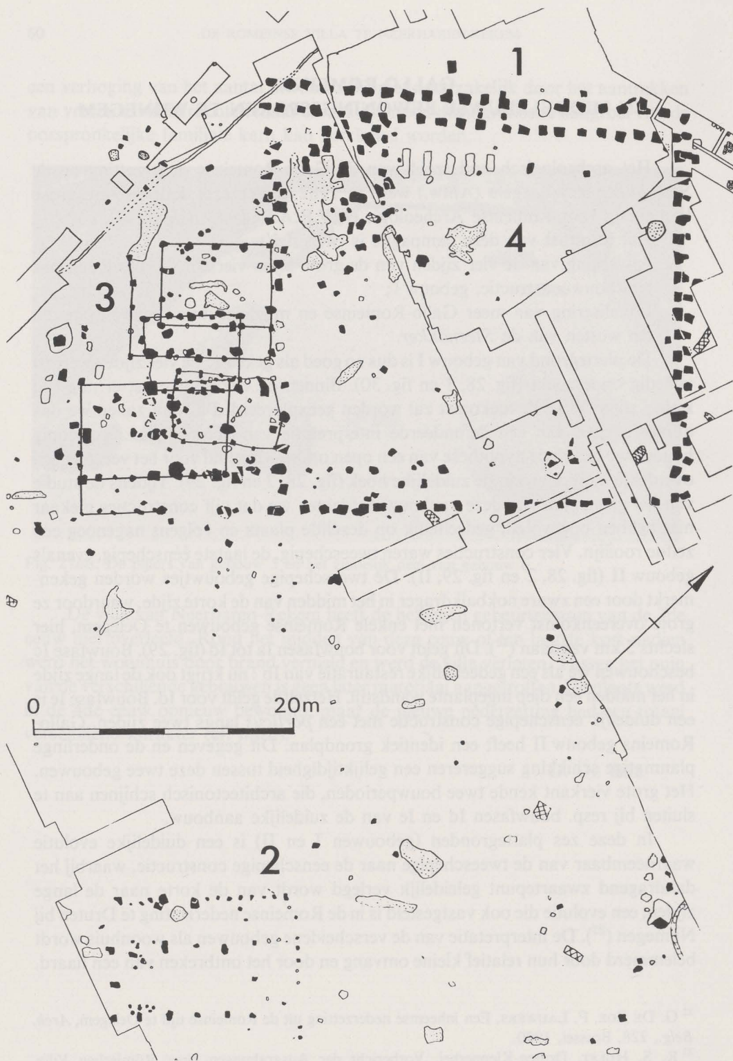
Fig. 28. Gallo-Romeinse gebouwen.