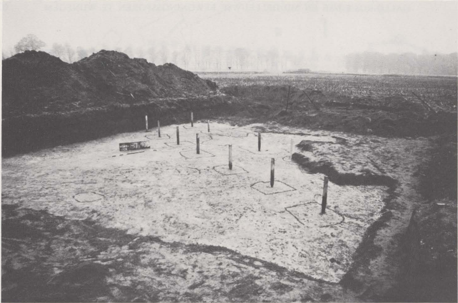
Fig. 30. Paalsporen van het Gallo-Romeins „vierkant” (N.W.-zijde).

Vrij onverwacht was de aanwezigheid van talrijke paalsporen, zowel Gallo-Romeinse als middeleeuwse op ca. 200 m ten westen van de Steenakker . Aangezien de opgravingen hier nog eerder het karakter hebben van prospectie in een voorheen niet archeologisch verkend gebied, is het nog niet mogelijk hier volledige plattegronden te onderscheiden. Verdere, aansluitende opgravingsvlakken moeten dit in de toekomst wel mogelijk maken en duidelijkheid verschaffen over de palenrijen die zich nu reeds schijnen af te tekenen. Deze zone kende alleszins in de middeleeuwen een nieuwe bewoning: wij hebben de paalsporen van drie, misschien vier middeleeuwse gebouwen (12de eeuw?). Van één is de plattegrond praktisch volledig gekend (cf. Arch. Belg. , 247): het betreft een gebouw dat naar de uiteinden toe versmalt, waardoor het de vorm aanneemt van een zgn. afgeknotte bootvorm, een type dat algemeen verspreid was in Noordwest-Europa van de 9de tot de 12de eeuw en dat teruggaat tot de „boothuizen” van Warendorf (Westfalen) (24) uit de 6de tot de 8ste eeuw. Ook in Nederland is dit type sterk vertegenwoordigd: één voorbeeld, Wijk bij Duurstede (Dorestad) moge hier volstaan (25) . Het bestaan van een dergelijk gebouw (gebouwen?) te Wijnegem verleent aan de opgravingen een nieuwe, onvermoede dimensie.