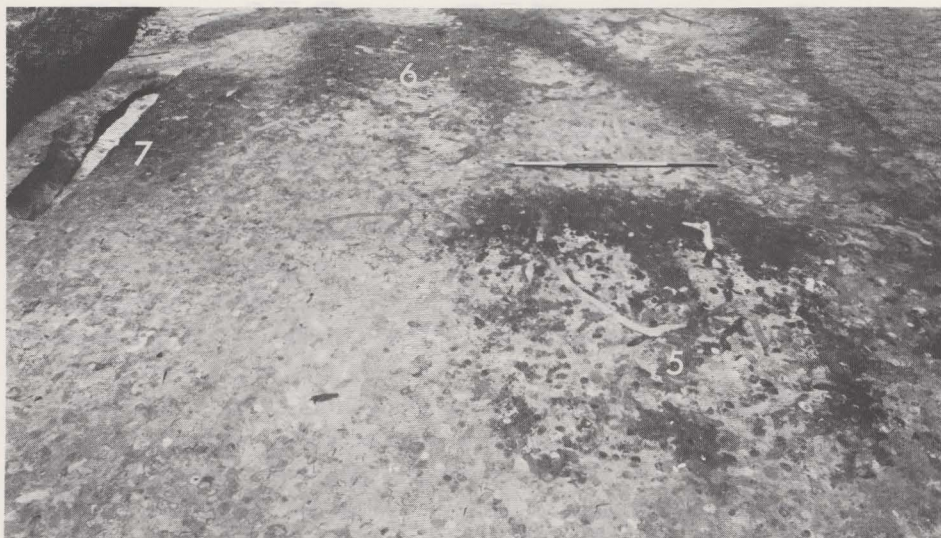
Fig. 36. De Grubenhäuser 5-6 en de kuil 7.