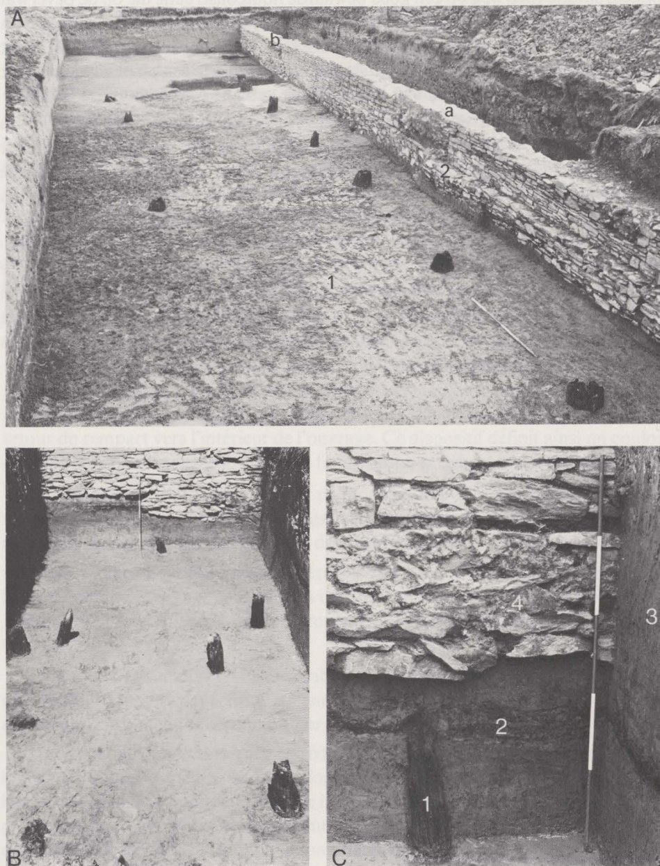
Fig. 43. Zone ten zuiden van het castrum . A : langwerpige houtconstructie (1) en muur van de abdijhoeve (2) met twee toegangen (a en b); B en C : kleinere houtbouw in stratigrafische context.

twee toegangen, die 2,80 m groot waren en in een latere fase toegemetst werden (fig. 42, 3, 4 en 43, A, a, b). Wanneer tneerhof opgericht werd, is voorlopig niet uit te maken. Wel moet op het ogenblik van de bouw, de gracht van het castrum nog