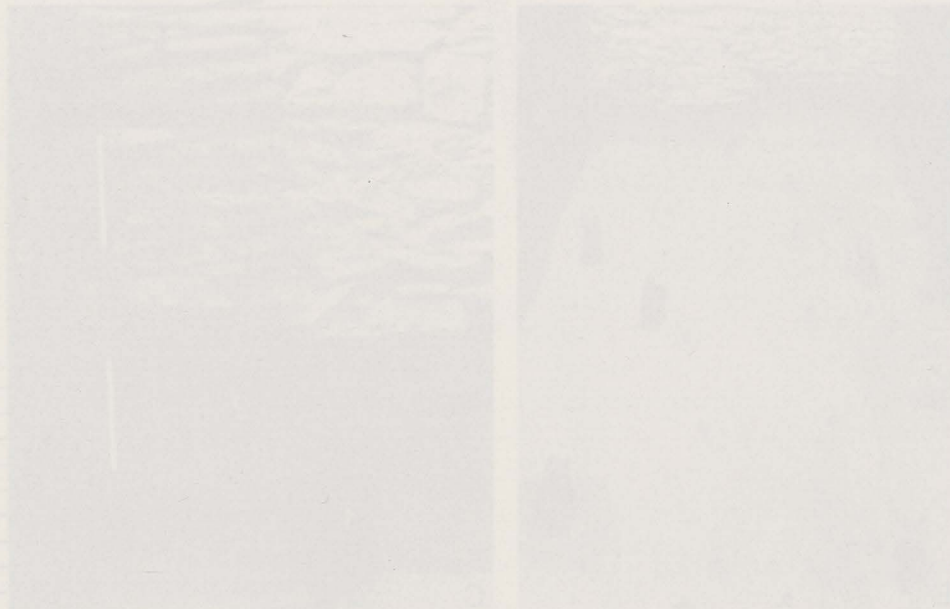
Fig. 42. Uitsnede uit het opgravingplan.