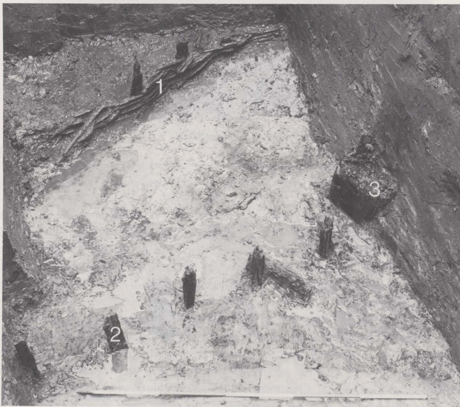
Fig. 49. Zicht op de oudste houtconstructies.

In een volgende fase werd het terrein opnieuw opgehoogd (fig. 48, 6). Hierover strekken zich een drietal looppniveaus uit (fig. 48, 7, 8, 10), die rijk aan archaeologica waren. In hoofdzaak gaat het om grijs aardewerk w.o. verscheidene stukken met radstempelpersiering. Verder zijn er o.a. fragmenten roodbeschilderde waar en Andennescherven waarvan de oudste tot periode I (1075-1175) teruggaan. We vonden ook enkele lederen schoenzolen, stukken van tegulae en imbrices , alsmede brokken roodgebrande huttenleem. Aan de twee jongste occupatielagen beantwoordden enkele paalsporen. Een grondplan herstellen is spijtig genoeg niet mogelijk. Wel bleef één van de palen gedeeltelijk bewaard (fig. 48, 9 en 49, 3). Hij neemt een interessante stratigrafische positie in, zodat hij uit dateringsoogpunt belangrijk kan zijn. Na een laatste nivellering van het terrein (fig. 48, 11) wordt het lagenpakket oversneden door een laat-middeleeuwse bouwfase van het hospitaal. Het betreft de hoek van een baksteenconstructie (fig. 47, 1) waartegen een muur aangebouwd is (fig. 47, 2).