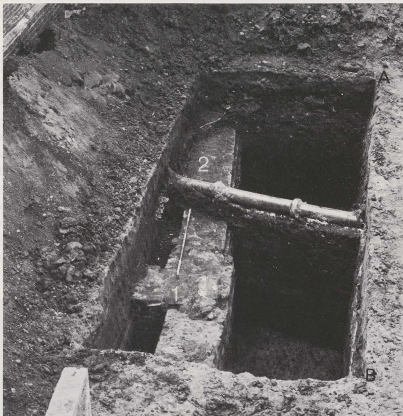
Fig. 47. De opgraving in de binnenkoer van het Gasthuis.