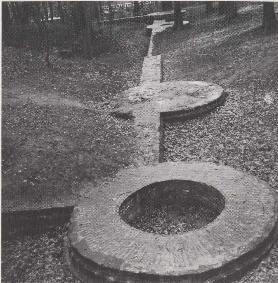
Fig. 57. De geconsolideerde oostelijke funderingen van het kasteel (gezien vanuit het Z.).

demoliri ac nova fundamenta poni jussit et fecit” (43) . Deze bouw werd echter snel gestopt en nooit hernomen. De funderingsresten werden nu volledig vrijgelegd en geconsolideerd door de B.T.K.-ploeg van „De vrienden van het Stedelijk Museum en Archief - Diest” (fig. 57).