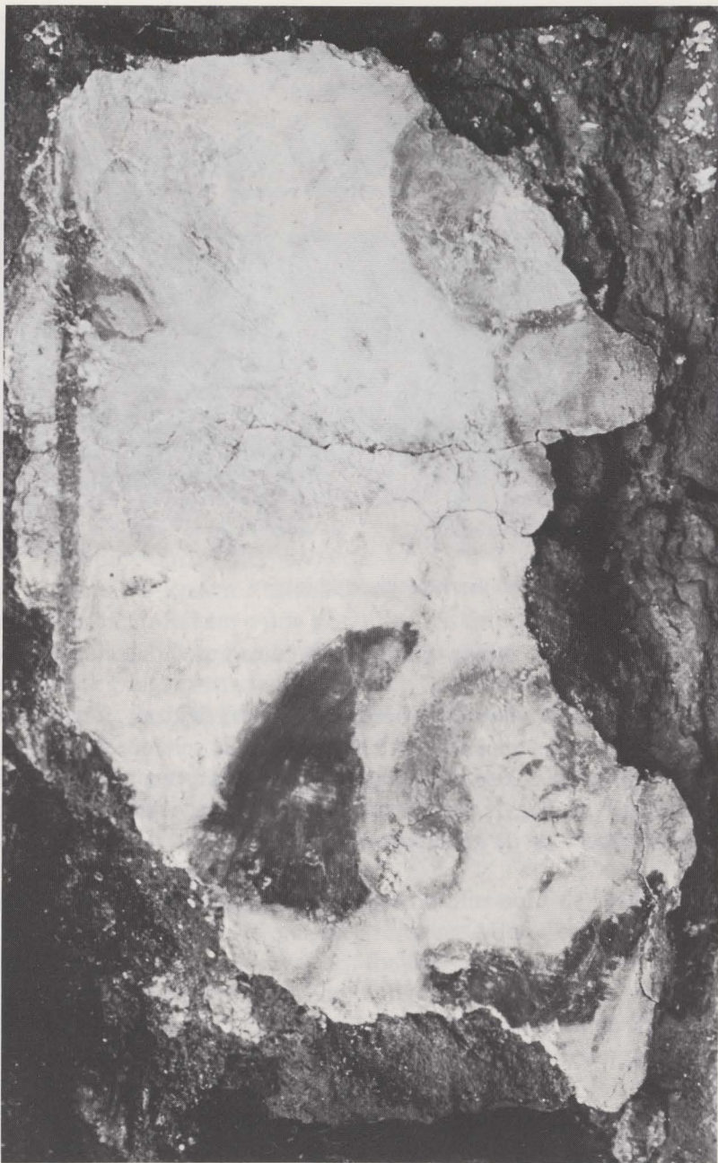
Fig. 69. Herbruikte ijzerzandsteenblok met resten van de figuratieve beschildering op het pleisterwerk.

cistische stijl gebouwd. Latere verbouwingen betreffen vooral het westelijk gedeelte waarbij rechts van de toren de doopkapel werd gebouwd en links een open