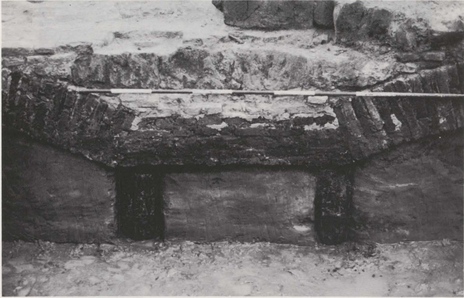
Fig. 70. De boogkonstruktie van het herbouwde schip.

bidkapel. Ook de centrale ingang door de toren dateert uit de laatste verbouwingsfasen.