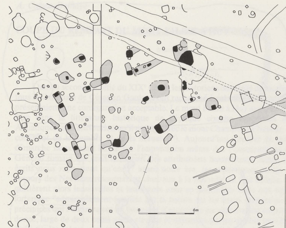
Fig. 42. Grondplan van een tweeschepige woning, met portaalsgewijs uitgebouwde ingangen.

afstand van amper 20m vonden wij er 2 inhumatie- en 2 krematiegraven. In de inhumatiebijzettingen waren behalve kuil en kist, ook nog wat vage aflijningen van de ledematen en de schedelkrans van de dode te zien. Naast het hoofd van de overledene lagen een kleine schotel en een vernist bekertje, terwijl geoxydeerde resten van de bespijkerde zolen naast de linkerknie de plaats van het schoeisel aanwezen (fig. 43). In het tweede inhumatiegraf kon van het skelet slechts één stuk bot worden opgemerkt; bijgaven ontbraken er. De twee krematiebijzettingen zijn eenvoudige urngraven. In het ene waren de veraste beenderresten in een eenvoudige kookpot met omgeslagen lip geborgen, in het andere in een kom met kraagrand (fig. 43). Het aardewerk uit de graven is zeer eenvoudig en kan vanaf de 2 e helft van de 2 e tot in de 3 e eeuw gedateerd worden. Hieruit volgt dat het kerkhof, waarop deze 4 graven liggen, in ieder geval niet kan geassocieerd worden met de eerder beschreven groep gebouwen, maar in een latere bewoningsfase moet ingepast worden. Vooraleer daarover definitief uitspraak te doen hadden wij graag de resultaten van het onderzoek in 1984 afgewacht.