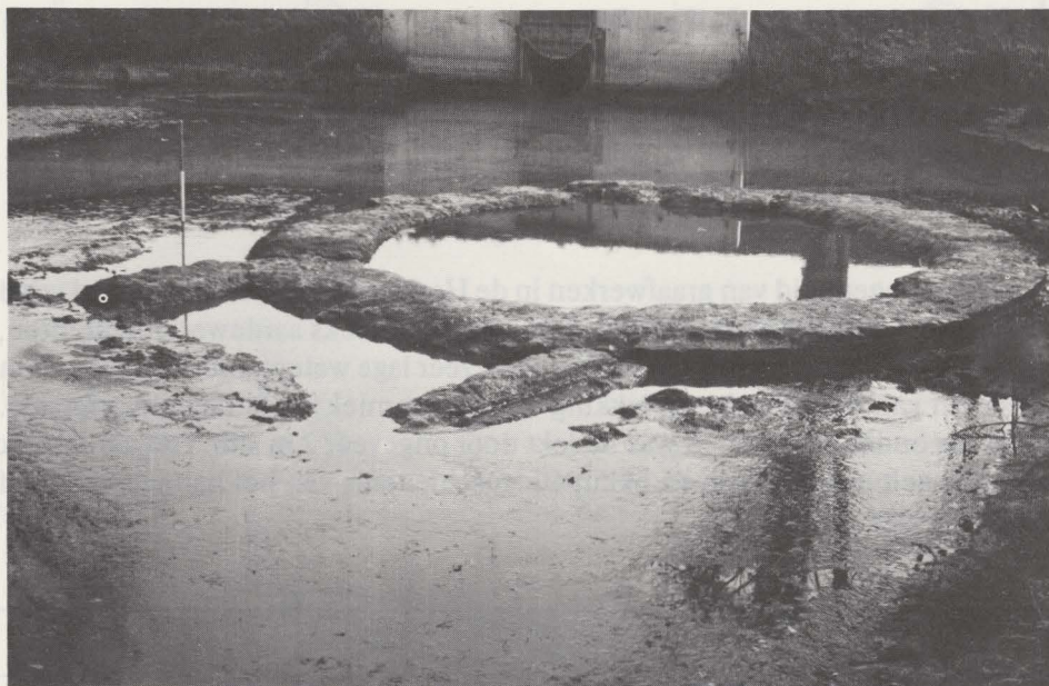
Fig. 93. De torenresten gezien vanuit het noordwesten.

Op het einde van de XVIII e eeuw had de Balie, alhoewel reeds sterk geschonden, toch nog verschillende meters hoogte. Pas in het begin van de daaropvolgende eeuw zouden alle oppervlaktesporen verdwijnen. In 1912 tenslotte zou de aansluiting van de Kleine Nete op de omleggingsvaart verplaatst worden ten noorden van de toren, zodat de middeleeuwse topografie volledig werd verstoord.