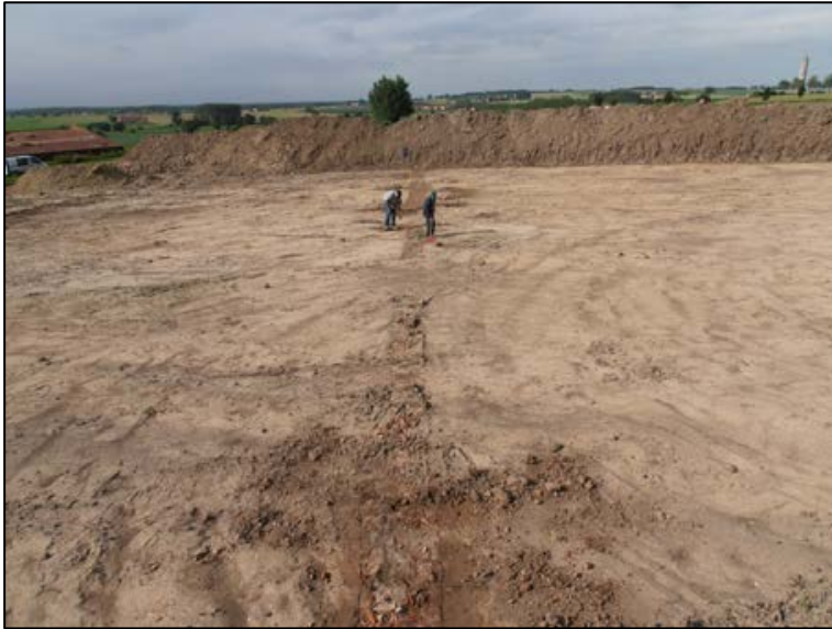
Fig. 2 Het OE opgravingsteam in actie.

De registratie ging door op 29 juni 2012 (machtiging 2012/278 van 27 juni 2012) 1 . Eigenlijk waren de sporen iets te ondiep afgegraven om volledig duidelijk te zijn (Fig. 2).