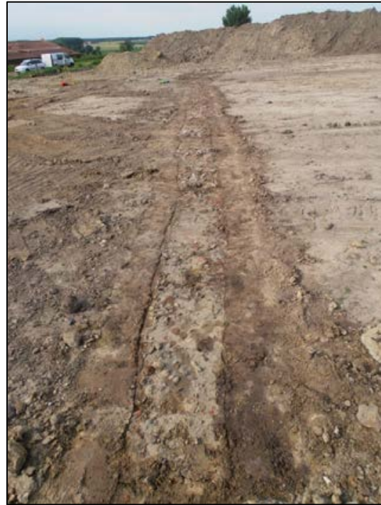
Fig. 5 Overzicht van de zuidelijke muur.

In de vulling stak hier en daar nog heel wat rood baksteenpuin (26 x 11,5 x 5, ? x 12 x 6, ? x 9 x 5 cm) (fig. 6 en 7).