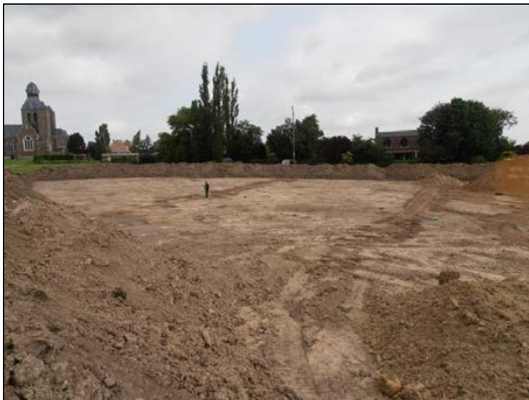
Fig. 9 Zicht op beide uitbraaksporen in de richting van de verkaveling aan de Rijselstraat.

Het enige houvast dat geboden wordt, is het feit dat de muren haaks op de Rijselstraat gericht staan en met perceelsindeling / verkaveling te maken hebben (fig. 9). De huidige verkaveling dateert uit de jaren 60 van de vorige eeuw. De aangetroffen sporen moeten dus iets ouder zijn 2 .