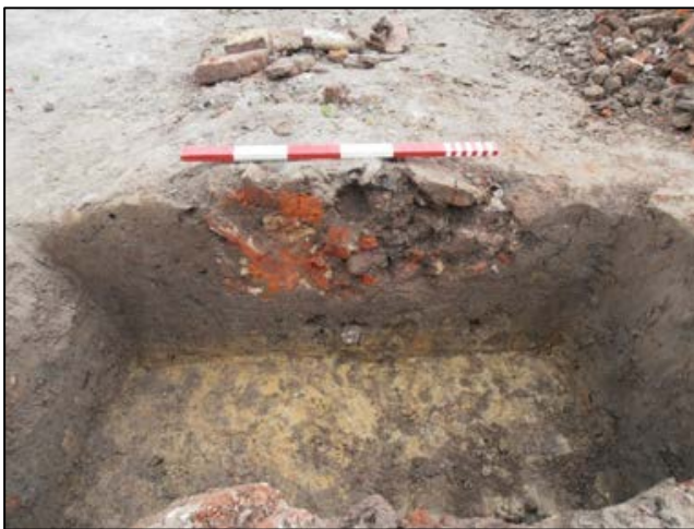
Fig. 6 Coupe op het zuidelijk spoor.

In de vulling stak hier en daar nog heel wat rood baksteenpuin (26 x 11,5 x 5, ? x 12 x 6, ? x 9 x 5 cm) (fig. 6 en 7).