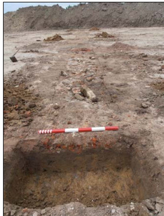
Fig. 7 Coupe op het noordelijk spoor.

De datering is onzeker. De baksteen lijkt eerder recent.