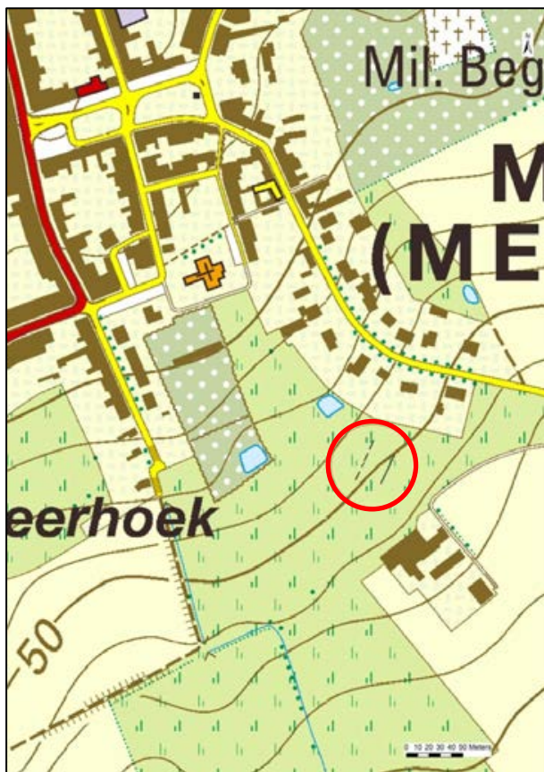
Fig. 1 Localisatie van de vindplaats.

De vindplaats staat kadastraal bekend als Mesen, afd. 1, Sie A, 188s en ligt ruim genomen in de hoek gevormd door de Rijselstraat en landweg, die de Rijselstraat verbindt met de Armentierseweg (fig. 1). Bodemkundig ligt de plek in een groot complex vochtige leem.