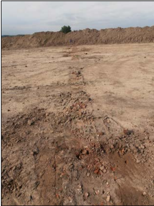
Fig. 4 De noordelijke muur vertoonde enkele onderbrekingen.

De breedte schommelt rond 0,6 m (0,48 tot 0,7 m), de diepte rond 0,2 m (0,15 tot 0,29 m) (fig. 4 en 5)