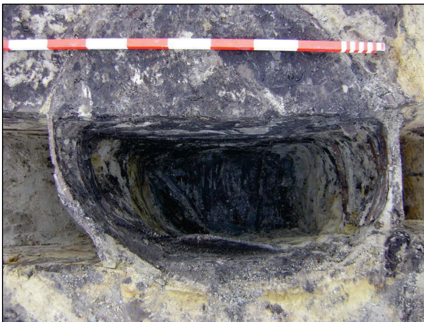
Fig. 13 Doorsnede van tonput 006. De ton was met de bodem in de put gezet.

Daarrond liggen 3 tonputten, die opnieuw naar de 13 de eeuw teruggaan. Tonput 016 bevat o.a. een hoogversierde kruik. De buik ervan is versierd met groene sliblijnen, die in driehoekige vlakken geordend zijn (fig. 12).