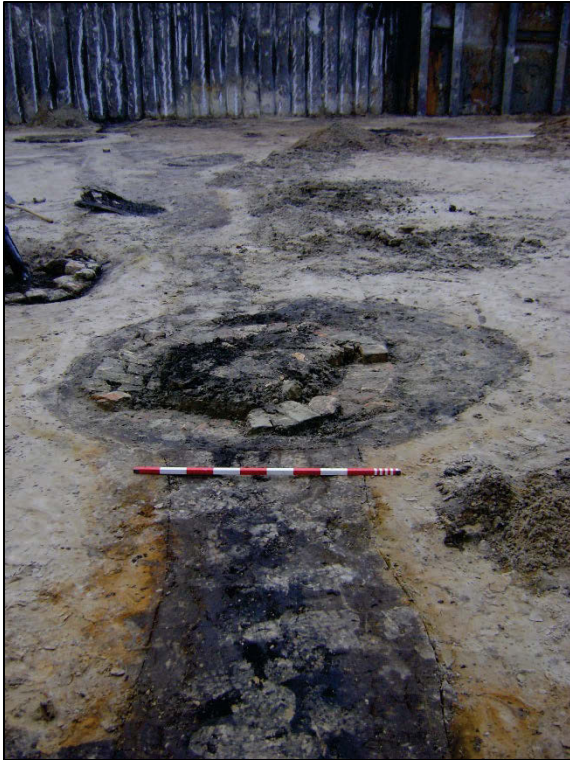
Fig. 7 Greppel, waarover waterputten zijn terechtgekomen. Op de voorgrond put: 002.