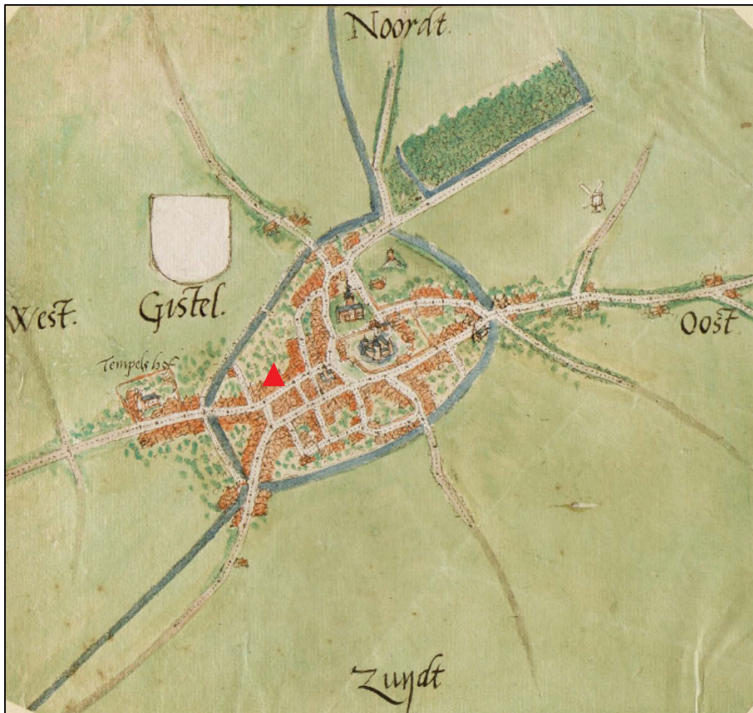
Fig. 3 De vindplaats binnen de stadsomwalling.