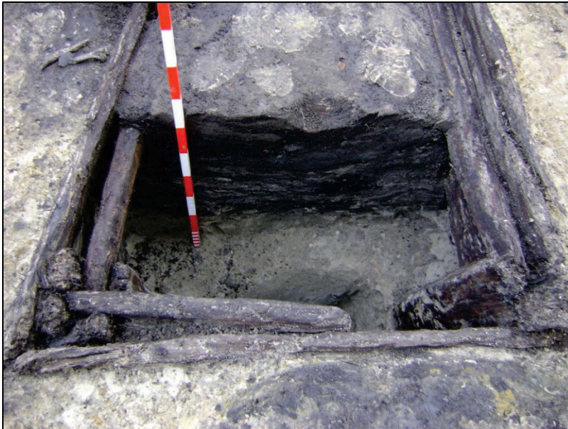
Fig. 18 Vierkante houten waterput. De bekisting is aangebracht tegen het intern kader.

Zowel de vondsten in de vulling van de put zelf (009) als in de aanlegtrechter (010) verwijzen naar de (2 de helft van de) 12 de eeuw (fig. 11,11 en 12). Zo komt opnieuw grijs aardewerk voor o.a. fragmenten van een kogel- of tuitpot (met weinig geprofileerde manchetrans) en een kom of teil (rand aan de binnenzijde scherp afgesneden). Het steeltje van een rammelaar in Andenneceramiek springt eruit (fig.13). Naast veel veldsteen zijn ook een schoenzool, een baksteenfragment van groot formaat (? x 14 x 7 cm) 9 , huttenleem en slakachtig materiaal (ovenwand?) ingezameld.