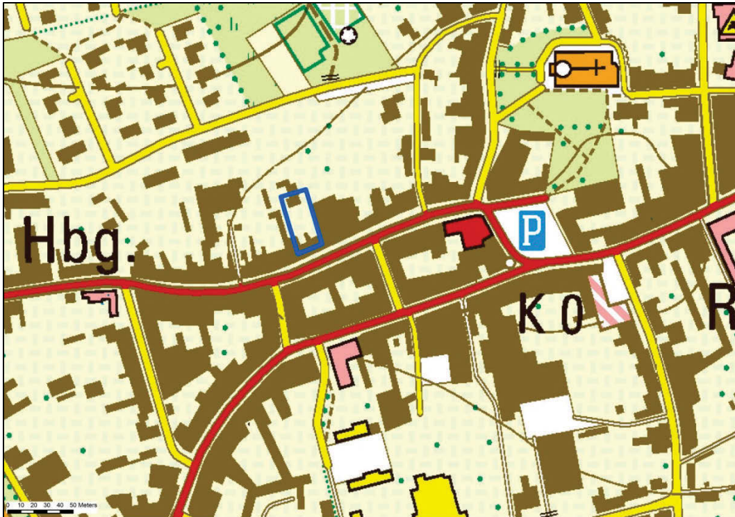
Fig. 2 Localisatie van de vindplaats.