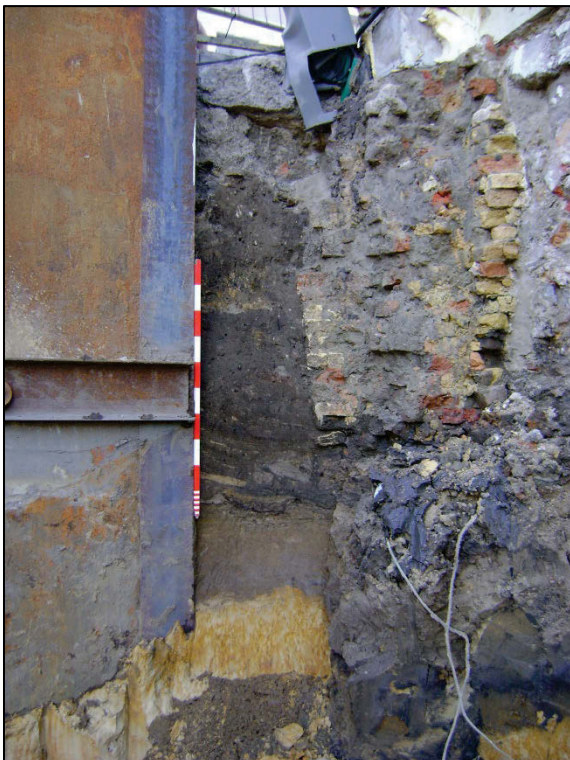
Fig. 5 Aanwijzingen voor de gevels aan de Hoogstraat.

In de funderingen van de voorgevels van de (verdwenen) huizen aan de straatkant vielen allerlei baksteenformaten op (? (25,5) x 13 x 6; ? (25 of 23,5) x 12,5 x 6; ? (25) x 12 x 6 cm) 3 , die kunnen wijzen op 14-15 de eeuwse bouwactiviteit. Men had gele baksteen met soms een rode of oranje schijn gebruikt (fig. 5). Ook veldsteen werd opgemerkt.