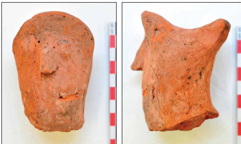
Fig. 14 Spitfragment met antropomorfe inslag.

Iets zuidelijker is nog een ander, min of meer cirkelvormig bodemspoor 027 te zien, dat als een uitgetrokken tonput kan geïnterpreteerd worden. De diameter bedraagt maximaal 1,1 m. Enkele grijze scherven spreken dit niet tegen.