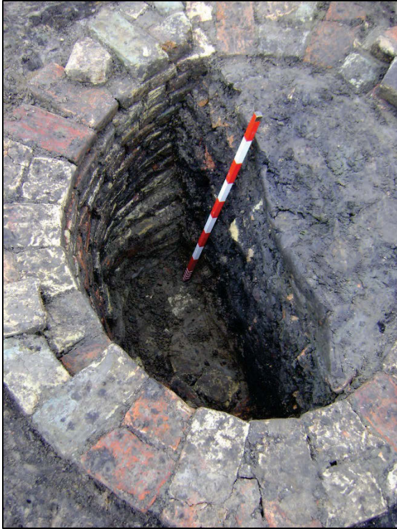
Fig. 9 Doorsnede van waterput 002. Ook de bodem is met baksteen uitgewerkt. 3689.

Een andere waterput 020 is vergelijkbaar en heeft een binnendiameter van 1,25 m. De baksteenformaten (? x 12 x 5,5 cm) en de aard van de vulling -wat rode en grijze wandscherven- komen overeen. Vermeldenswaard is een roodbeschilderd scherfje, dat aan de oudere greppel te linken is.