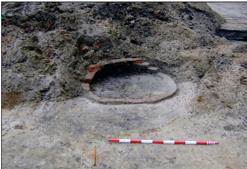
Fig. 15 Bakstenen put 022.

Omdat spoor 023 cirkelvormig (diameter: 1,6 m) is en heel wat puin bevat, menen we hier met een ontmantelde waterput te maken te hebben. Het past ook mooi in het rijtje. De geconstateerde baksteenformaten zijn 22 x 11 x 5,5 cm (geel) en 23 x 11 x 5 à 6 cm (geel tot geel-oranje).