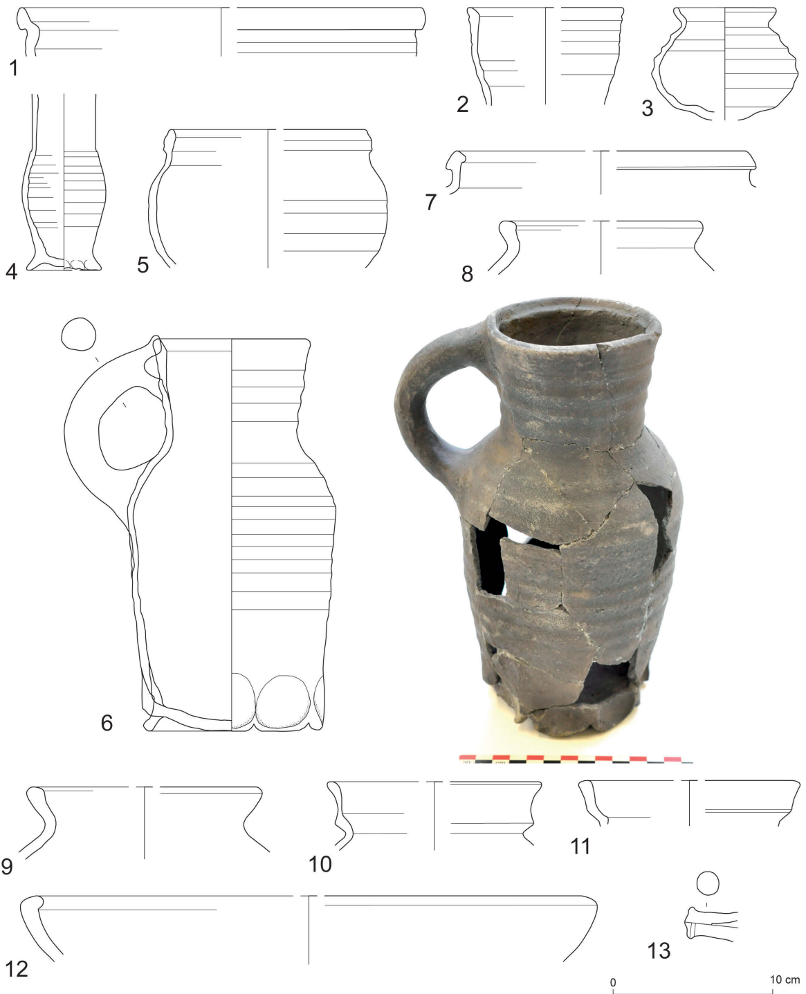
Fig. 11 Materiaal uit verschillende contexten.

Ook tonput 012 vertoont een gelijkaardig patroon met materiaal dat de periode van de 14 de tot de 16 de eeuw overspant. Bij het rood aardewerk steekt ditmaal een randfragment van een grape, bij het steengoed een miniatuurkruikje (fig. 11,4). Ook een randfragment van een fijnwandige, grijze kom met bandvormige rand (fig. 11,5) hoort hierbij. In de vulling van tonput 006 is enkel grijs aardewerk aangetroffen, zoals 2 kannen, die in 13Ac kunnen geplaatst worden, een kruik en een klein kogelpotje (fig. 12). Dit materiaal sluit opnieuw eerder aan bij de greppelvulling (fig. 11,2 en 3).