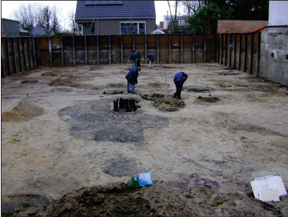
Fig. 1 Het team van het agentschap Onroerend Erfgoed in actie!

Aanleiding voor de graafwerken was de bouw van een onderkelderde handelszaak en meergezinswoning, residentie t' Ankertje door de Gouden Triangel bvba 1 (fig. 1).