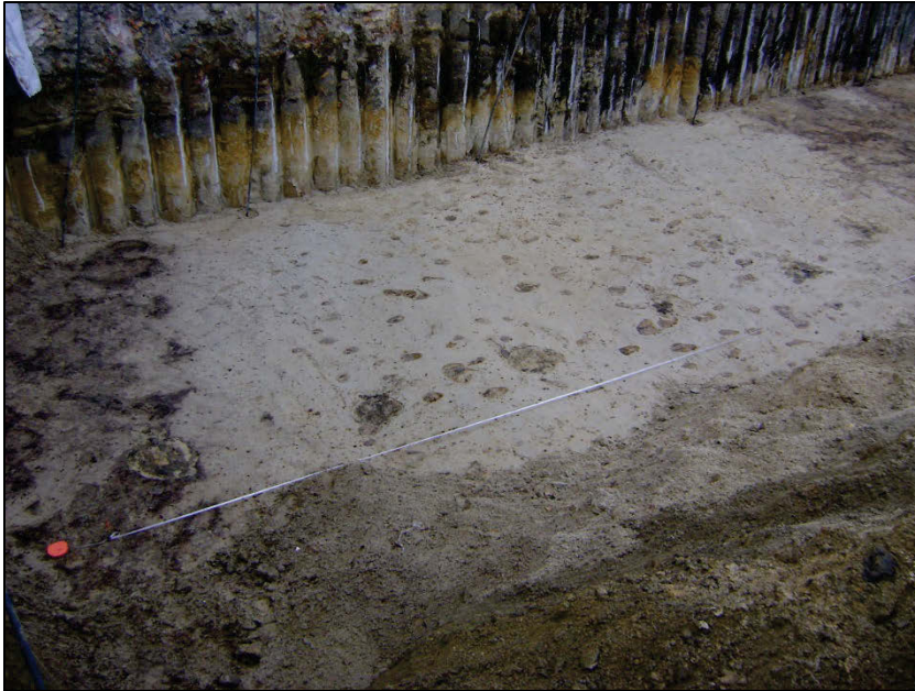
Fig. 4 Aanwijzingen voor de oudere vegetatiehorizont.

In de funderingen van de voorgevels van de (verdwenen) huizen aan de straatkant vielen allerlei baksteenformaten op (? (25,5) x 13 x 6; ? (25 of 23,5) x 12,5 x 6; ? (25) x 12 x 6 cm) 3 , die kunnen wijzen op 14-15 de eeuwse bouwactiviteit. Men had gele baksteen met soms een rode of oranje schijn gebruikt (fig. 5). Ook veldsteen werd opgemerkt.