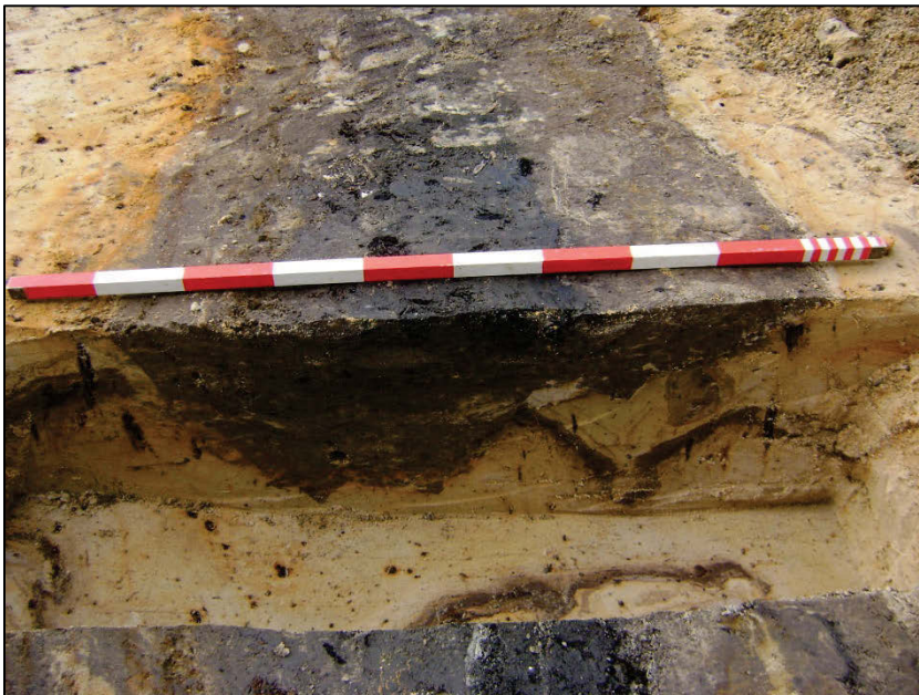
Fig. 8 Doorsnede van de (heraangelegde) greppel.

De ronde, gemetste waterput 002 heeft een binnendiameter van 1,1 m. De putwand is 1 steen dik en bestaat uit gele baksteen, die 25 x 12 x 5, 25 x 12 x 6 en 25,5 x 12 x 5 cm meet (fig. 9). In de vulling is een ceramiekensemble gevonden, dat als 15 de eeuws kan bestempeld worden, zoals kruiken in steengoed, een grote waterkan in rood aardewerk en fragmenten van een glazen beker (fig. 10). Een weinig grijs