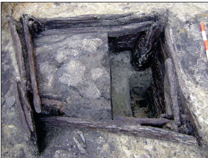
Fig. 19 Vierkante houten waterput. Linksboven: Het ene haakse juk zit onder het andere.