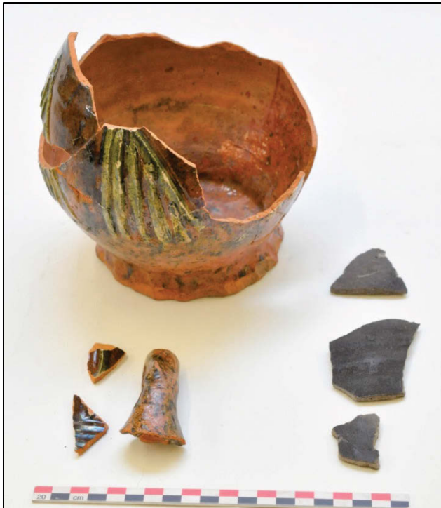
Fig. 12 Groepsfoto van het materiaal uit put 016.

Net ten zuiden van de greppel valt een ander cluster putten op.