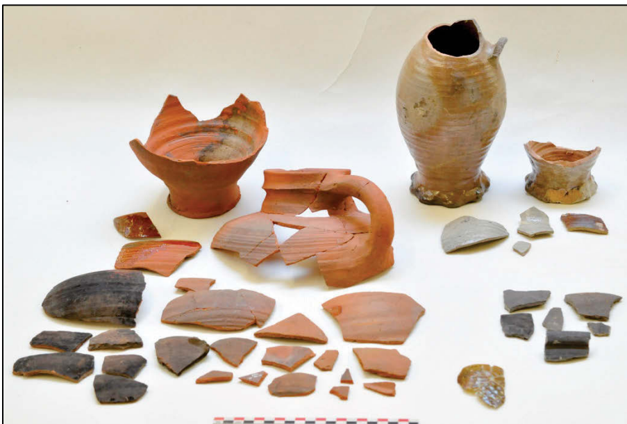
Fig. 10 Ceramiekensemble uit de vulling van waterput 002. Rechts het residueel materiaal.