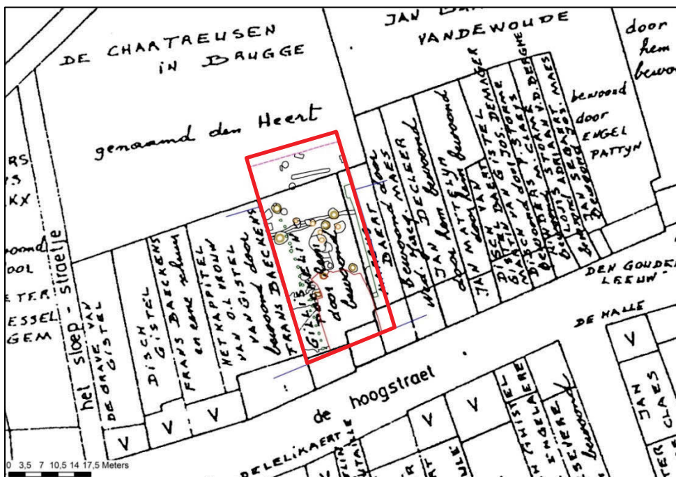
Fig. 16 De opgravingsituatie geprojecteerd op de “ommeloper”-kaart uit 1678.

Deze 3 putten op een rij suggereren de mogelijkheid dat er sprake was van 3 verschillende en aanpalende huiskavels. Kaartmateriaal uit het einde van de 17 de eeuw situeert hier één groot perceel, bewoond door Gillis Pockelin 7 (fig. 16). Het primitief kadaster, dat rond 1835 tot stand kwam, kan er wel mee geassocieerd worden (fig.17).