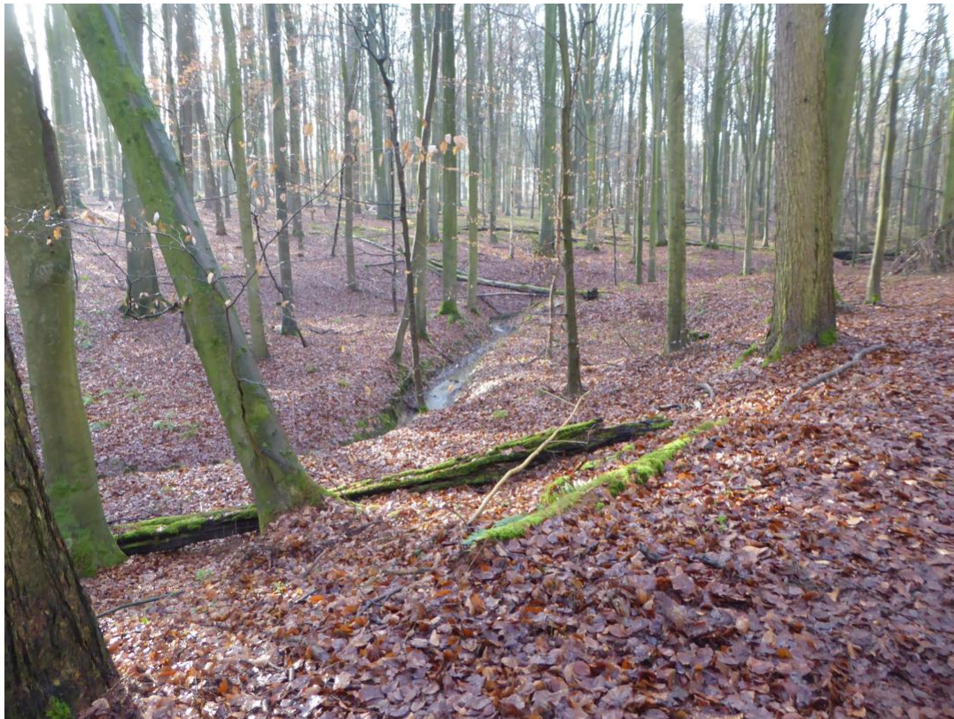
Het Zoniënwoud in Hoeilaart

Het Zoniënwoud was een van de weinige Brabantse bossen waar de bosbeweiding tot in de 19 de eeuw standhield. Vermoedelijk hield dit verband met de schaarste aan weiden en hooilanden in de gemeenten aan de rand van het Zoniënwoud en met het feit dat de eeuwenoude gebruiksrechten moeilijk af te schaffen waren. In de eerste helft van de 19 de eeuw werd bosbeweiding hoe dan ook als een relict uit lang vervlogen tijden beschouwd. Bosbouwkundigen waren van mening dat het vee niet thuishoorde in de bossen, omwille van de schade die het aanrichtte. Landbouwkundigen stonden ook sceptisch tegenover bosbeweiding, omdat de mest van de dieren niet gebruikt kon worden voor de akkers en omdat de grassen en kruiden van de bossen doorgaans minder voedzaam waren dan die van de weiden en hooilanden. 174