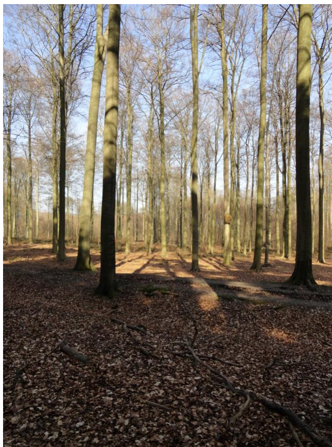
Opgaand beukenbos in Zoniën

De inwoners van de dorpen aan de rand van het Zoniënwood hadden ook het recht om strooisel te verzamelen in het Zoniënwood. Het verzamelen van strooisel gaf zelden aanleiding tot misbruiken en is daarom nauwelijks gedocumenteerd in de archiefbronnen.