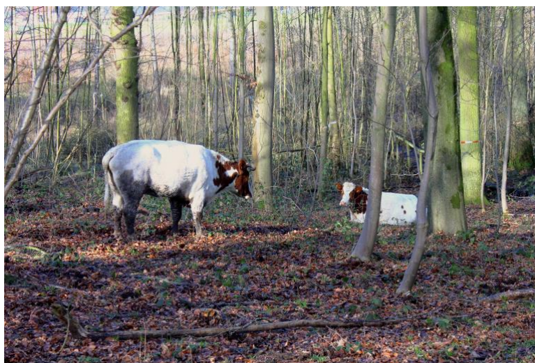
Begrazing met Oost-Vlaams Roodbont in het Bos t'Ename

Bosbeweiding kan ook toegepast worden voor het beheer van bossen die beschermd zijn als cultuurhistorisch landschap. Het bekendste voorbeeld is het Bos t'Ename, waar bosbeweiding sinds 2002 wordt toegepast. 4 De geschiedenis van de beweiding in het Bos t'Ename is goed gedocumenteerd, in tegenstelling met veel andere bossen in Vlaanderen. Als men bosbeweiding wil toepassen om cultuurhistorische waarden te herstellen, moet men weten hoe het bos in het verleden beweid werd. Dat is vaak een probleem, omdat er in Vlaanderen nog maar weinig onderzoek naar traditionele beweiding in bossen is verricht. Onze historische kennis hieromtrent vertoont grote lacunes.