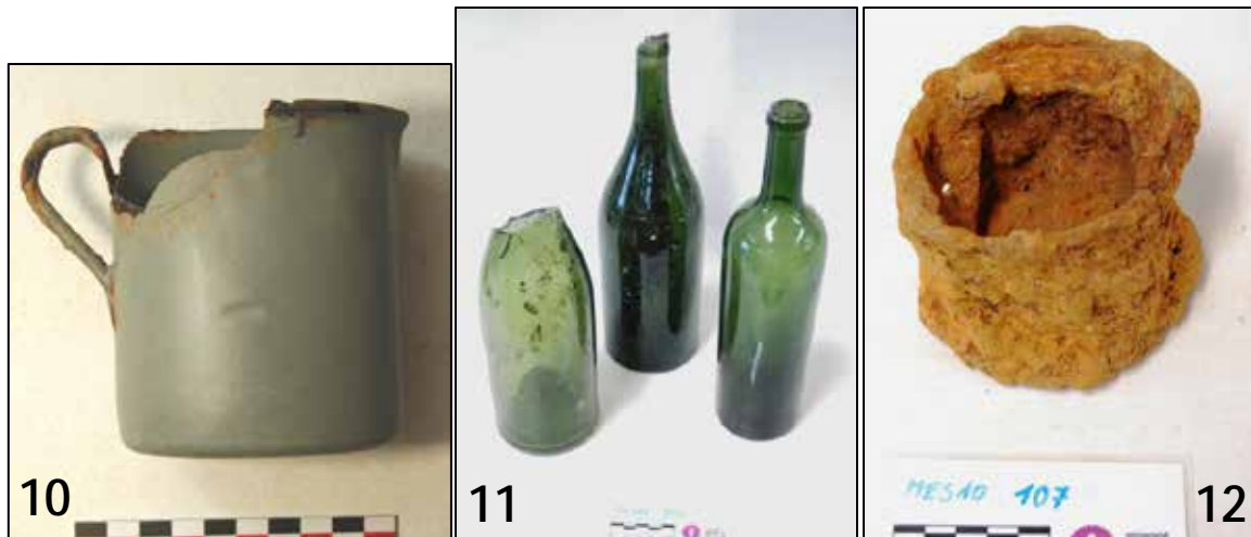
Fig. 11 Selectie uit de vondsten.