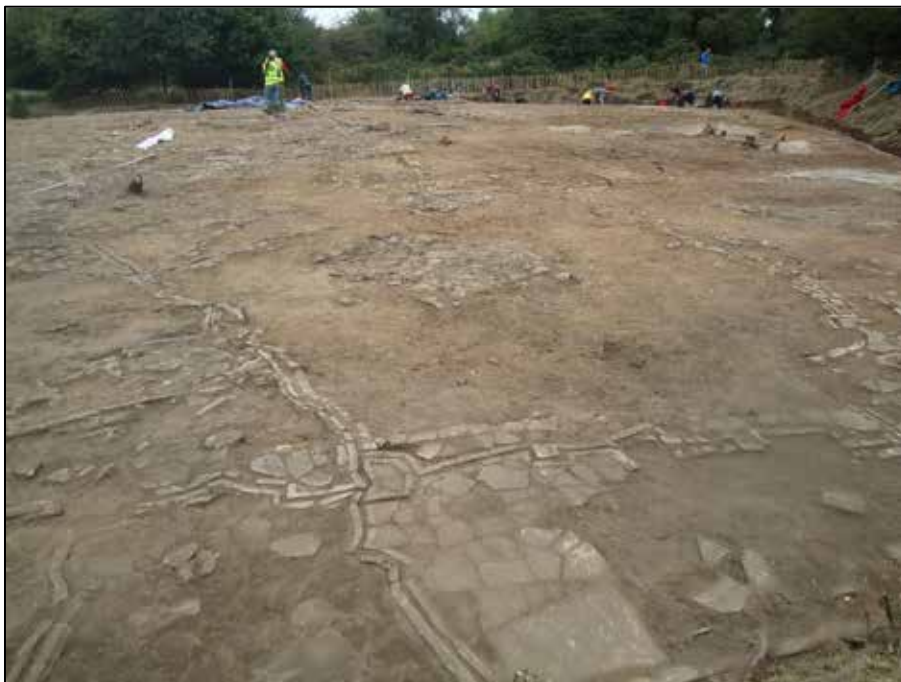
Fig. 5 Sfeerbeeld bij het vrijleggen van het schaalmodel van de stellingen ten O van Mesen (oktober 2013)

In Groot-Brittannië, vlakbij Brocton in de County Staffordshire, op de rand van Cannock Chase, een merkwaardig natuurgebied lag eertijds een WO I trainingskamp. Aldaar is een schaalmodel van 40m 2 van de linies in Mesen en omgeving bewaard (fig.5).