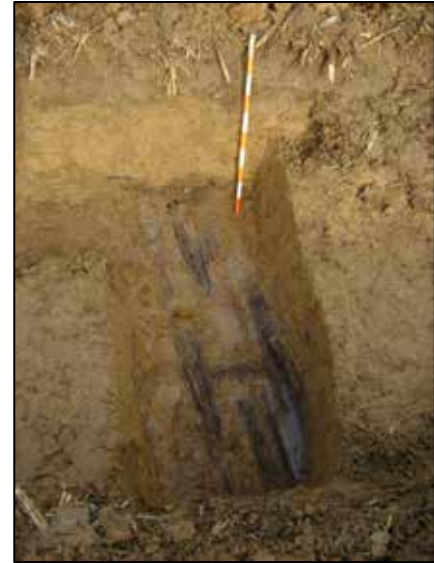
Fig. 7 Sleuf 1: de onderkant van de verbindingloopgraaf