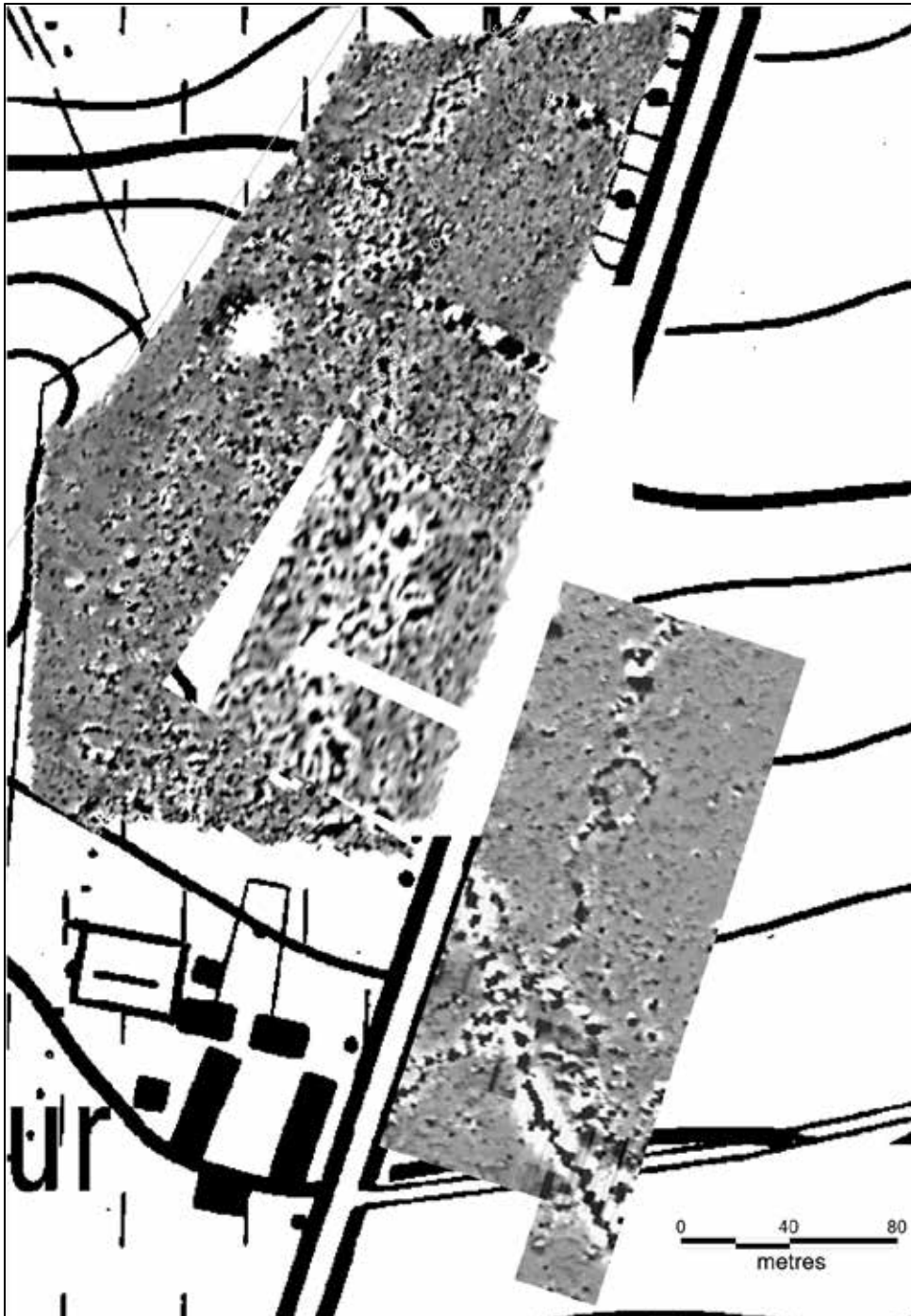
Fig. 12 Geofysische scan