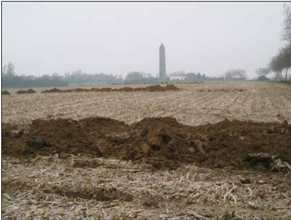
Fig. 6 Algemeen zicht op de proefsleuven, genomen in de richting van de Ierse toren.

De sleuven werden zo gelegd dat de 1 ste Duitse linie en enkele achterliggende verbindingssloopgraven zouden aangesneden worden. 9