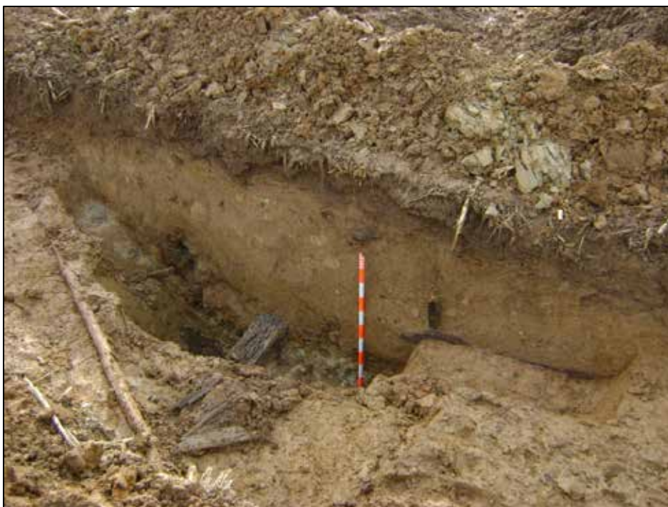
Fig. 9 Sleuf 2: coupe door een oorlogsstructuur

In sleuf 3 is de situatie zeer onduidelijk. Het is enkel mogelijk 2 zones aan te duiden, die voor een mogelijk spoor of structuur in aanmerking komen.