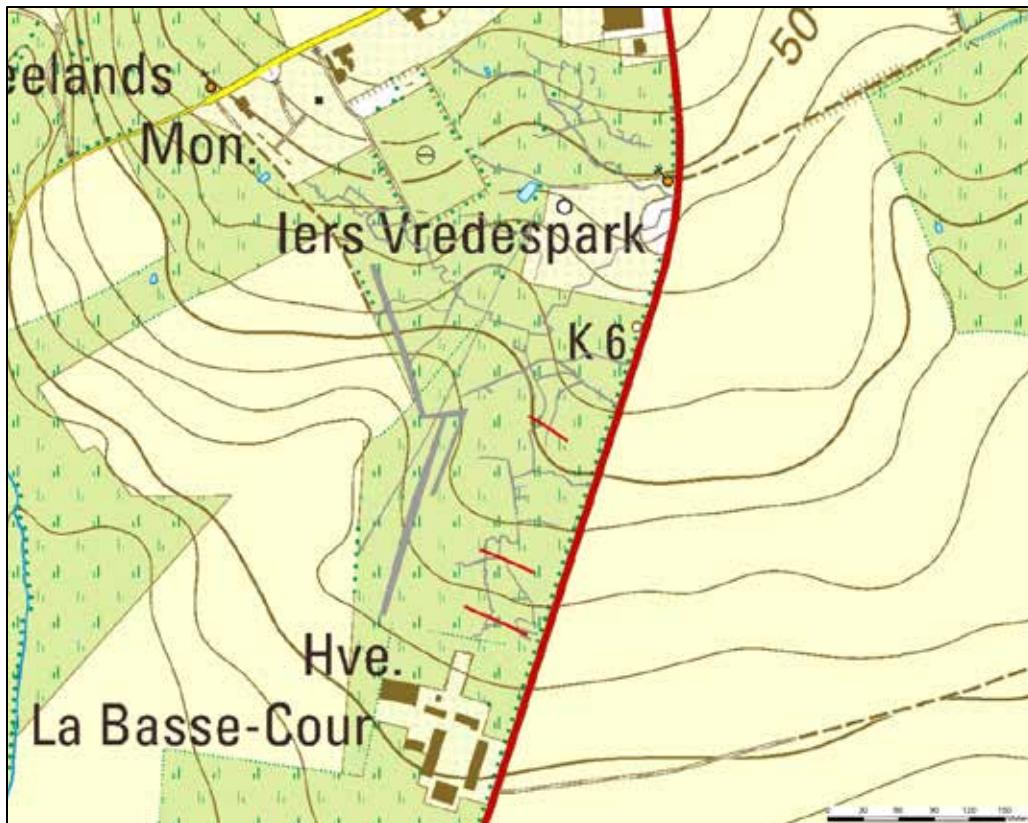
Fig. 3 De inplanting van de proefsleuven op de luchtfotografische informatie (1/6438)