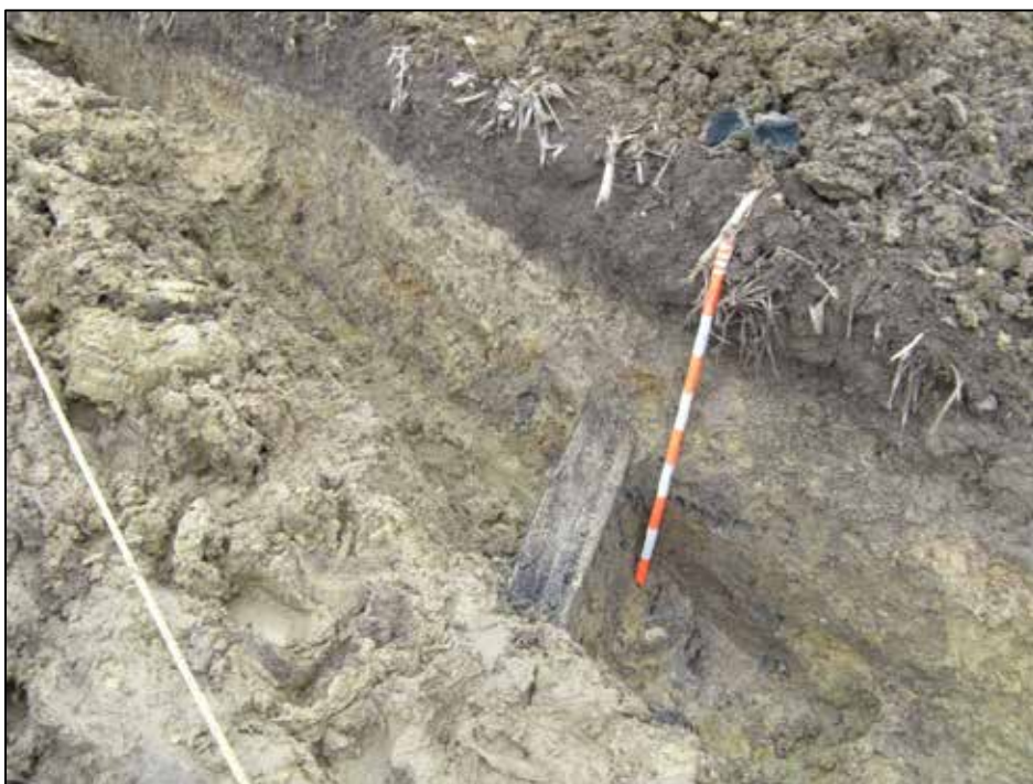
Fig. 10 Sleuf 3: coupe

Een 2 de zone, die zou moet overeen komen met de frontlinie, is 3,5 m breed en 0,7 m diep. In de vulling zitten verspreide houtresten.