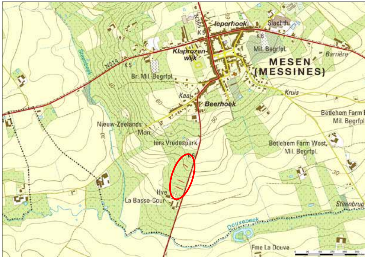
Fig. 2 Situering van de ingreep op de topografische kaart (1/16981)

Het onderzoeksterrein ligt ten westen van de Armentierssteenweg, ten zuiden van Mesen. (fig. 2) We bevinden ons in de brede vallei van de Douvebeek, even over halfweg de noordelijke, steilere helling (van 60 naar 22,5 m T.A.W.) iets verder, haaks erop ligt de oostelijke helling van de Steenbeek. Bodemkundig wordt het terrein getypeerd als Ada (sterk gleyig op leem) en EDx (sterk gleyig op kleiig materiaal). Aan den lijve werd dit, weliswaar in het natte voorjaar, als zeer plakkerige, moeilijk te bewerken grond, ervaren.