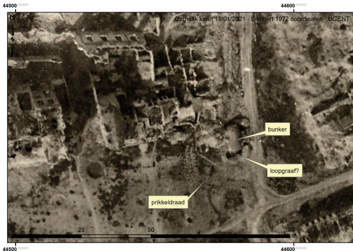
Figuur 4: Militaire luchtfoto genomen in januari 1917 van Diksmuide met zicht op een militaire structuur in de noordoosthoek van de Grote Markt.

Op militaire luchtfoto's is ter hoogte van het onderzoeksgebied nog geen structuur zichtbaar in augustus 1916. De eerste sporen zijn duidelijk vanaf januari 1917 (fig. 4). Er is ook een bunker te zien. Op de zijkanten van deze bunker sluit een vermoedelijke loopgraaf aan. Ook een deels omgevende prikkeldraadversperring valt op. 8