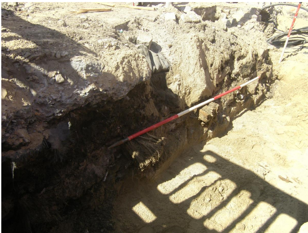
Figuur 6: Noordwestelijk zicht op de betonplaat met uitstekende houten liggers in het sleufprofiel.

De onderkant van de betonplaat die in de sleuf doorsneden was (fig. 6 en 7), situeerde zich op 1 m onder het marktoppervlak. De betonplaat was 0,4 m dik. In de betonstructuur, die summiere sporen van wapening vertoonde, waren drie houten liggers (19 x 9 cm) ingebed. De onderlinge afstand van deze liggers bedroeg 0,6 m. Hieraan waren misschien andere voorzieningen vastgemaakt.