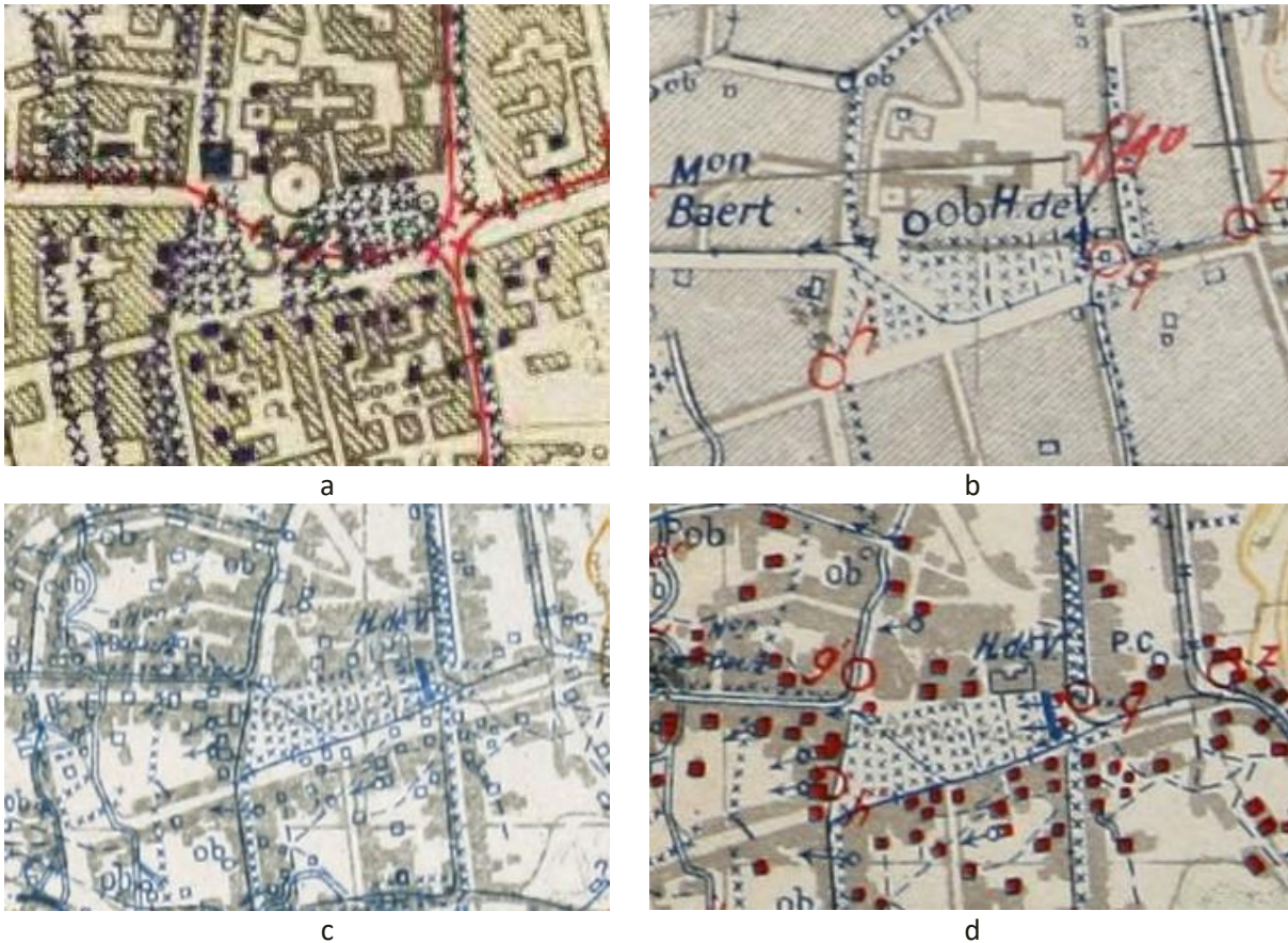
Figuur 5 a-d: Details van Diksmuide Grote Markt uit de Duitse (a) en Belgische (b-d) loopgravenkaarten van 1917 en 1918: resp. van 17/07/1917, 12/07/1917, 1/11/1917 en 1/8/1918.

In latere kaarten van 1917 en 1918 worden systematisch toevoegingen getekend die wijzen op een verdere uitbouw van de stelling. De verbinding met een volle lijn tussen beide structuren (de rechthoek en het vierkant) suggereren verdere betonning en de uitbouw tot een volwaardige batterij (bijvoorbeeld zichtbaar op de Belgische kaarten van 1/11/1917 en 1/8/1918, fig. 5 c en d).