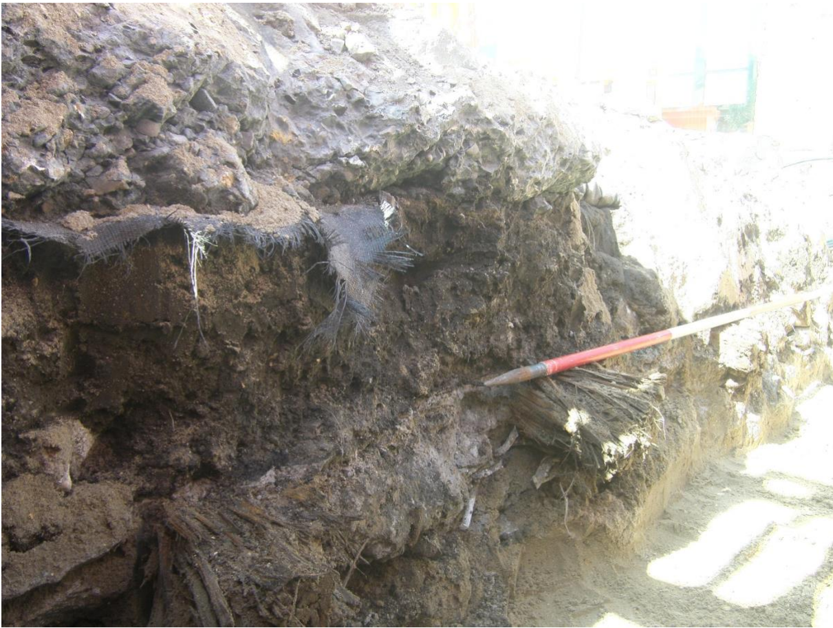
Figuur 7: Detail van de betonnen bodemplaat met twee uitstekende liggers in het sleufprofiel.

Er zijn aanwijzingen dat de westelijke rand van deze betonstructuur zich 3,7 m van de onderzochte sleuf bevond. Bij de grootschalige rioleringswerken in functie van de heraanleg van de markt werd namelijk ter hoogte van de noordoosthoek van de Grote Markt ook een deel van een vloerplaat vrij gelegd over de volledige breedte van de sleuf. Er ontbrak betonpuin bovenop deze plaat. Deze vondst werd gedaan tijdens de archeologische werfbegeleiding door Ruben Willaert bvba o.l.v. Janiek De Gryse (tussen 11 september 2017 en 15 januari 2018) (fig. 8). 11