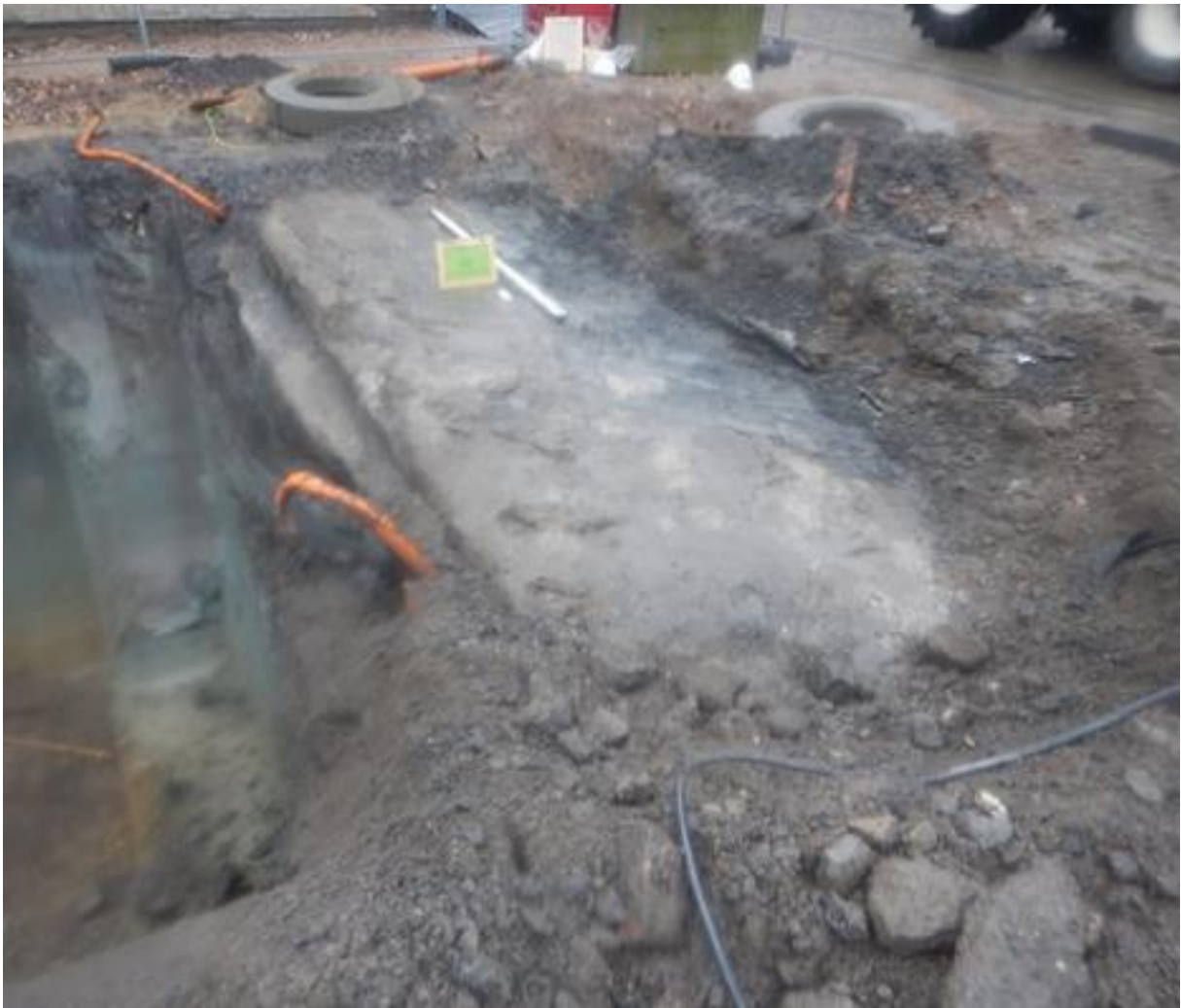
Figuur 8: Gedeelte van de betonnen plaat aangetroffen bij rioleringswerken najaar 2017 – januari 2018.

De combinatie van de opmeting van het betonplatform in de rioleringsseuf door Ruben Willaert bvba en de opmeting in de sleuf voor de elektriciteitsvoorziening leert dat de structuur 9,5 op minstens 4,5 m groot was (fig. 9). Dit komt ongeveer overeen met de afmetingen van de structuur op de historische luchtfoto, namelijk 10,4 op 4,5 m (fig. 4).