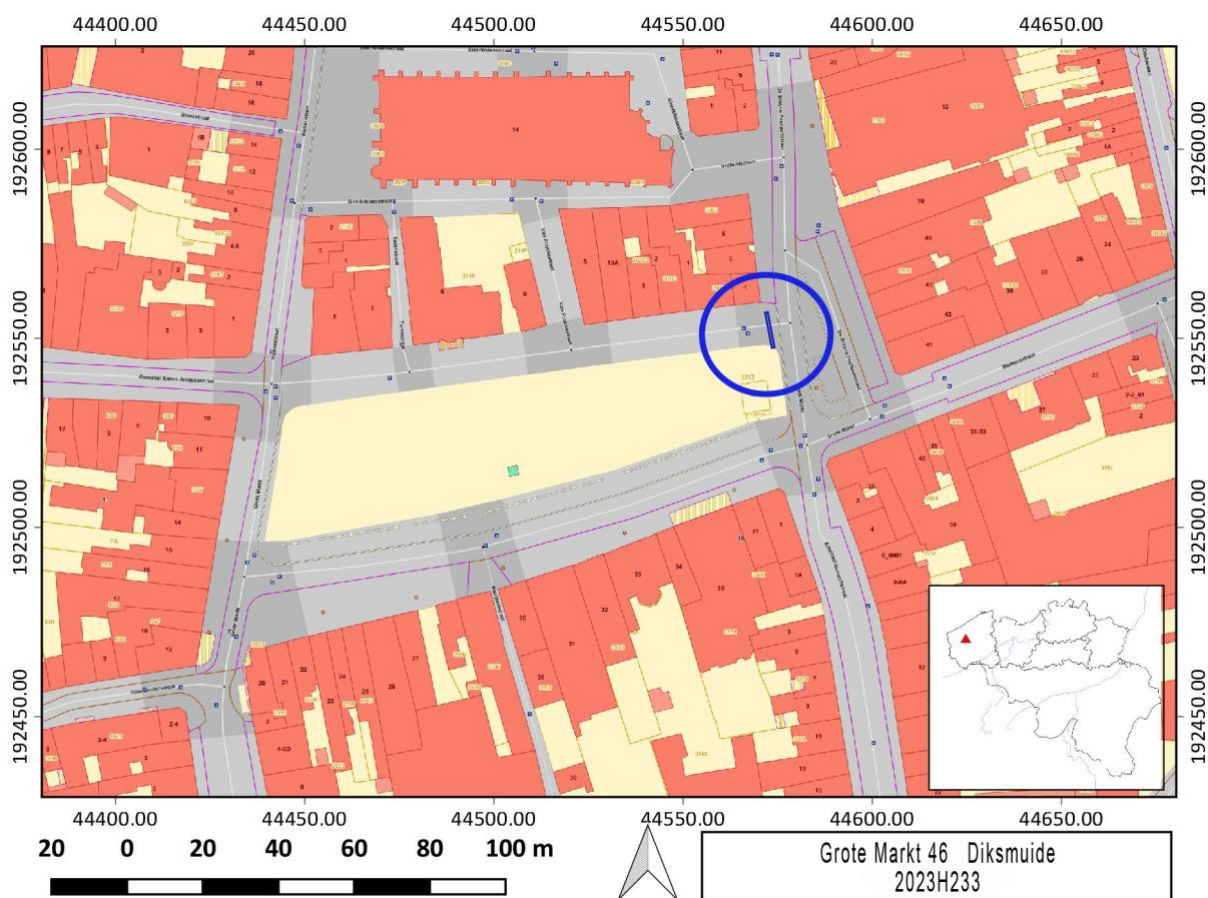
Figuur 1: Locatie op het GRB van de sleuf waarin de toevallsvondst werd gedaan.

Het voorziene veldwerk werd volledig afgerond. Omdat het om een zeer beperkte toevallsvondst gaat, wordt de uitwerking van dit onderzoek en de verdere interpretatie binnen de ruimere historische context bondig gehouden.