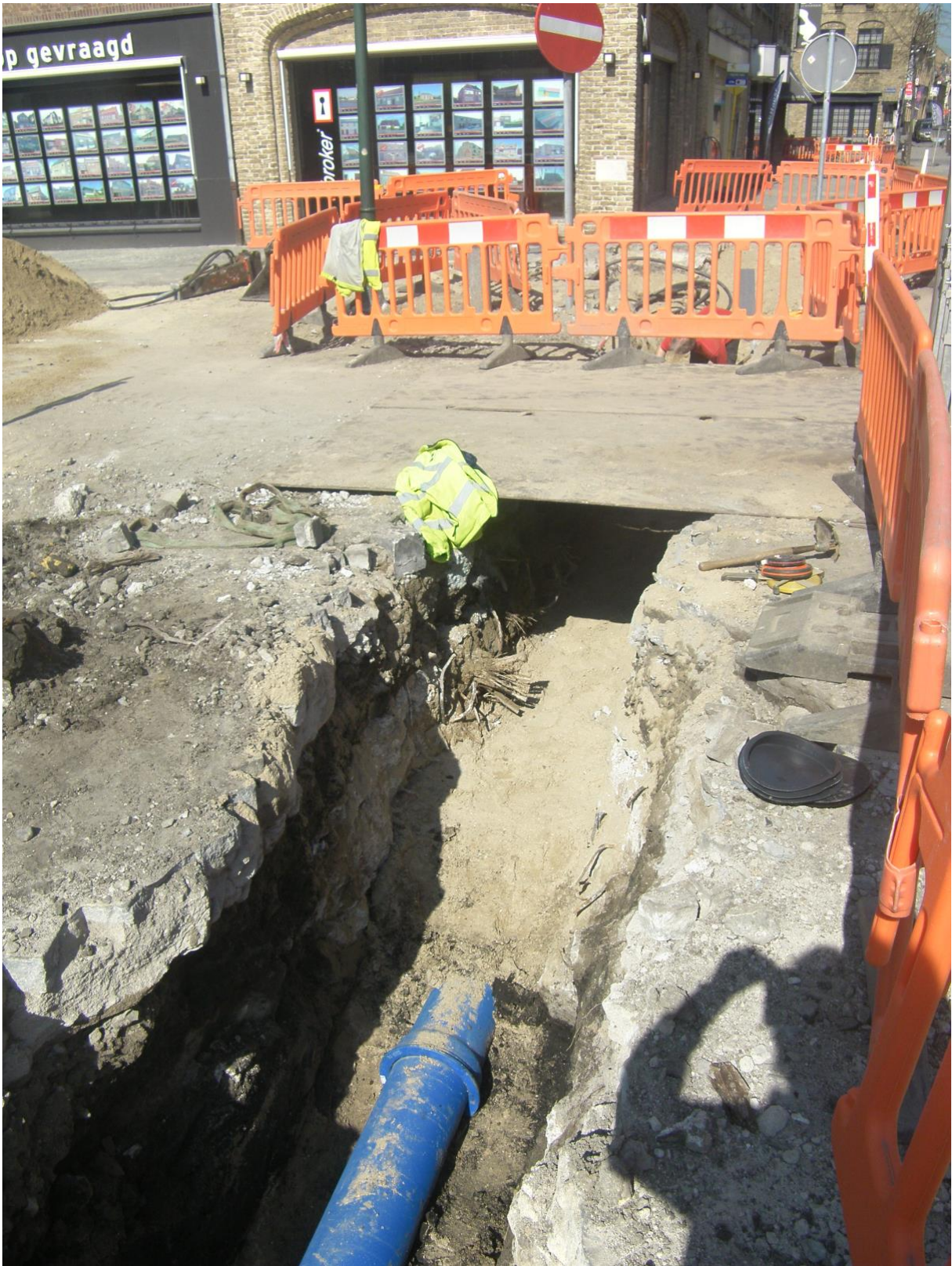
Figuur 3: Zicht naar het noorden op de betonplaat aangesneden in de sleuf aangelegd voor elektriciteitsvoorzieningen.