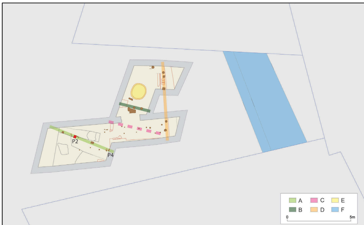
Fig. 3 Opgravingsplan

Het veldwerk werd uitgevoerd op 17/04/2013 (machtiging 2013/182 - 22 april 2013) 10 . Op het moment van de registratie waren de werken al afgerond. Uit enkele boringen bleek dat de moederbodem (grijze, zandige leem) zich 0,35 m dieper bevond (fig.3).