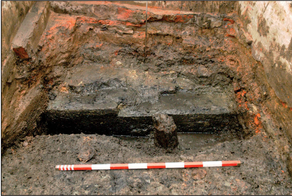
Fig. 6 Ensemble van muur en palenrij.