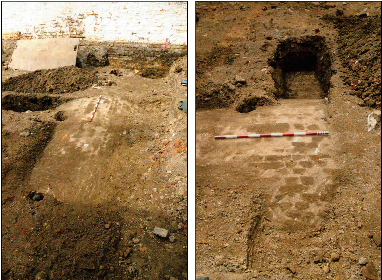
Fig. 8 De overwelfde leperlee.

Het vondstenmateriaal bevat naast bouwmateriaal (daktegelfragmenten, enkele onversierde en stempeltegels) uiteraard vooral potscherven. Het grijs aardewerk overweegt lichtjes, tegenover wat gewoon rood, veel hoogversierd en één stukje protosteengoed. Bij het grijs aardewerk komen vooral open vormen voor, naast een voorraadpot (fig. 9, 1-4). Bij het gewoon rood aardewerk is het aanbod beperkt tot kannen en braadpannen (fig. 9, 5-6). De bodem van een fijnwandig drinknapje met volledig uitgeknepen standring vormt (fig.10) de uitzondering op de regel. Het hoogversierd aardewerk is prominent aanwezig en gekenmerkt door een zeer dunne witbakkende sliblaag en een dikke, -vele tinten- groene glazuurlaag. In één geval is als versiering intense ribbeling toegepast. Een fragment van een dierlijk figuurtje (fig. 10) -een schaap?- is misschien als een kaarsenhouder te interpreteren 14 . Dit materiaal belicht een moment binnen de ophoging van het terrein.