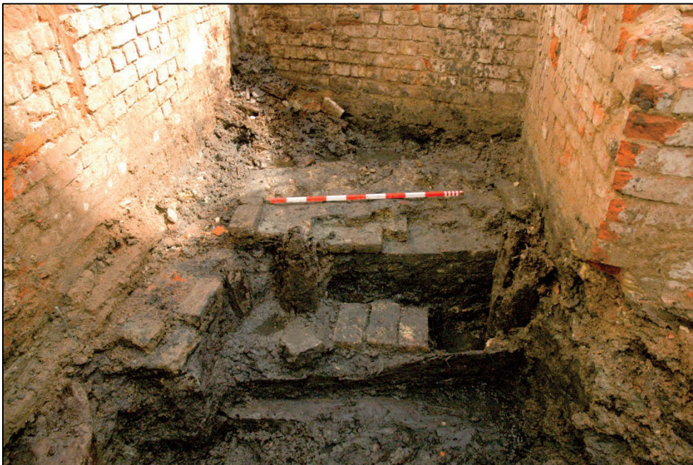
Fig. 7 Muur en palenrij, waartegen een plank gezet was.