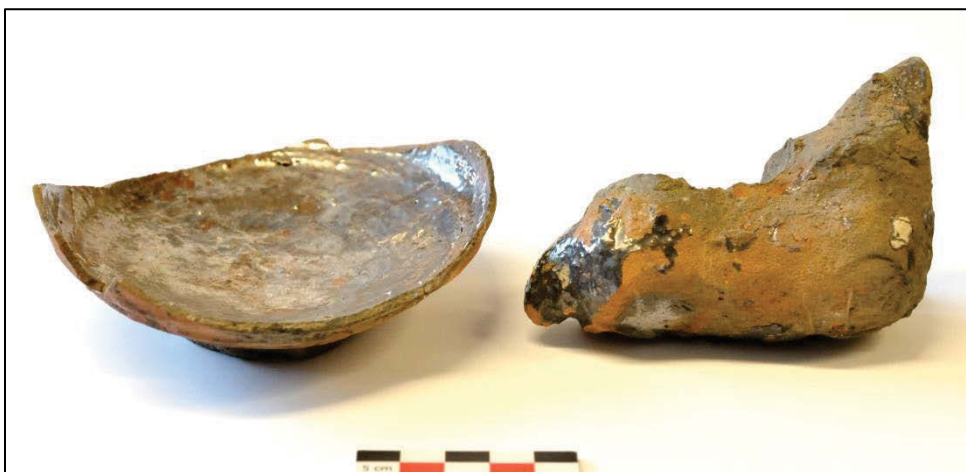
Fig. 10 Bodem van een drinknapje en een schaal (?) als kaarsenhouder (?).