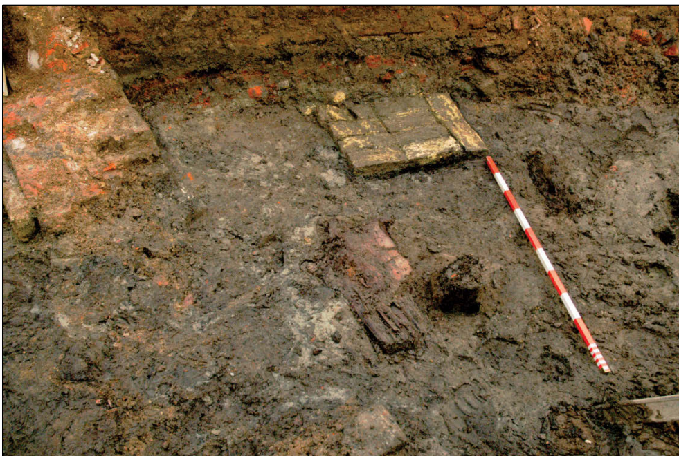
Fig. 5 Cluster van palen en een bakstenen poer.