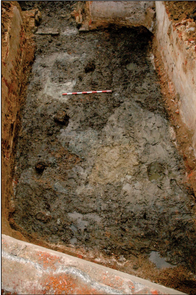
Fig. 4 Een duidelijke palenrij tekent zich af.