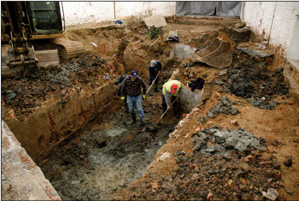
Fig. 1 De ploeg van het agentschap Onroerend Erfgoed in actie.

Bij het verwijderen van keldervloeren en andere afbraakwerken langs de Blindeliedenstraat kwamen zowel de overwelfde leperlee als allerlei gebouwsporen aan het licht (fig. 1).