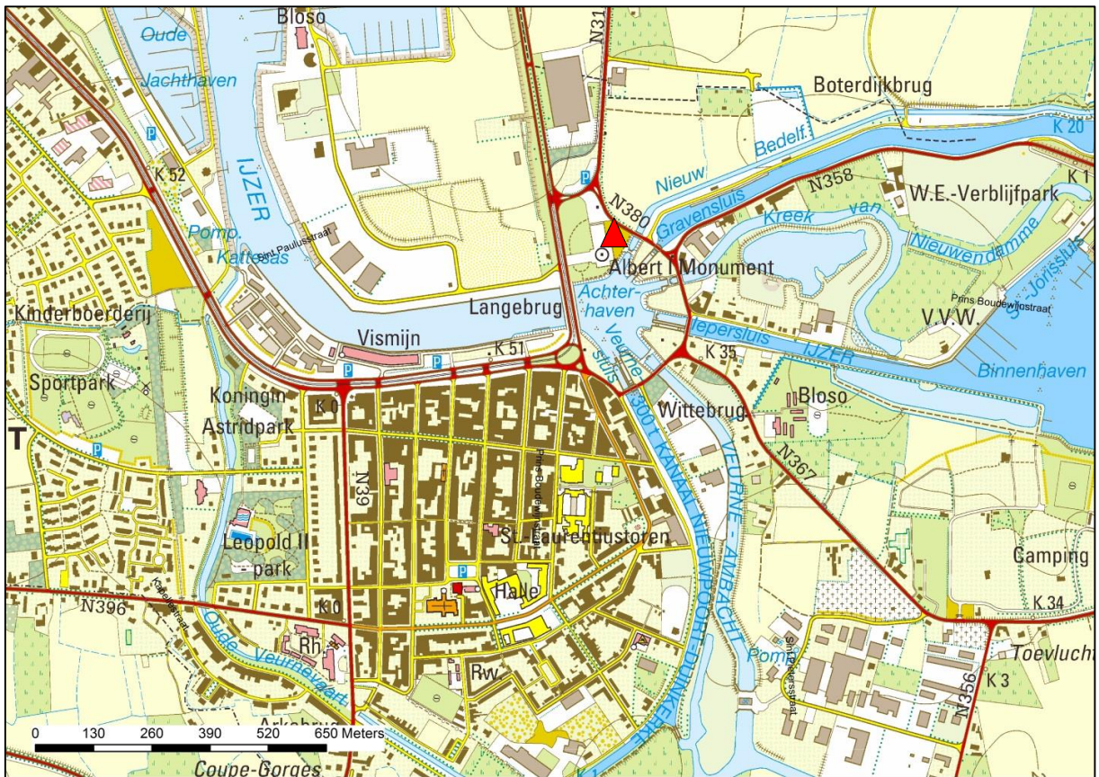
Fig. 2 Lokalisatie van de bunker in z'n bredere omgeving.