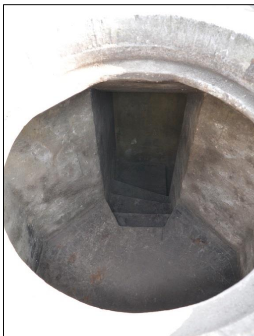
Fig. 14 Inkijk in de Offener Beobachter .

In alle onderdelen van de bunker zijn op verschillende plaatsen muurkasten uitgespaard. In beide tussenruimtes zijn telkens 2 muurgleuven aanwezig, die via verticale metalen buizen verbinding maakten met het dak. Ze lopen uit in een vierkante metalen plaat (zijde: 1 m). Hierlangs werden ook radioantennes uitgestoken 18 (fig. 8, 2-5, fig. 9 en fig. 15). De radio stond in een open muurkast van het centraal sas.