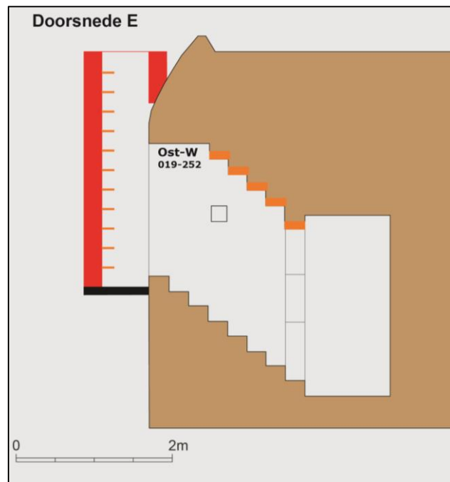
Fig. 17 Doorsnede E.