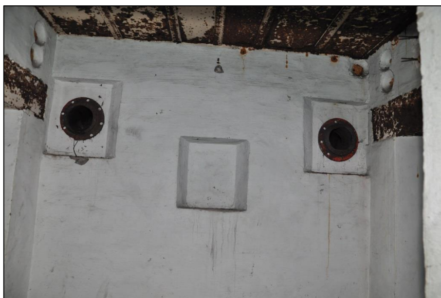
Fig. 7 Afgedekte ventilatiepijpen binnen het centraal sas.

In de zuidmuur, tussen beide ingangen, zaten 4 horizontale luchtkokers ( Lüftansaugestücke ), die afgaande op de beschildering met vierkante afdekplaten waren afgewerkt. De 2 bovenste konden, indien nodig het centraal sas verluchten (fig. 6 en 7). De 2 onderste maakten verbinding met de beide tussenruimtes ter hoogte van de deuren van het centraal sas .