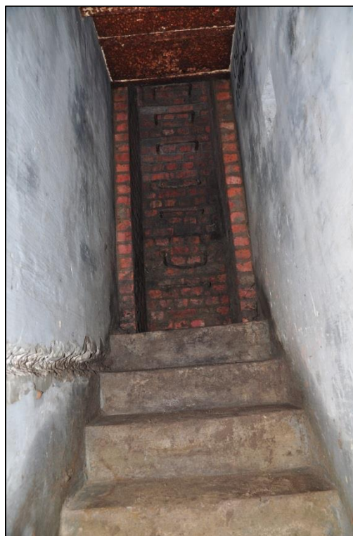
Fig. 18 Binnenzicht op de (later toegevoegde) toegangschacht.