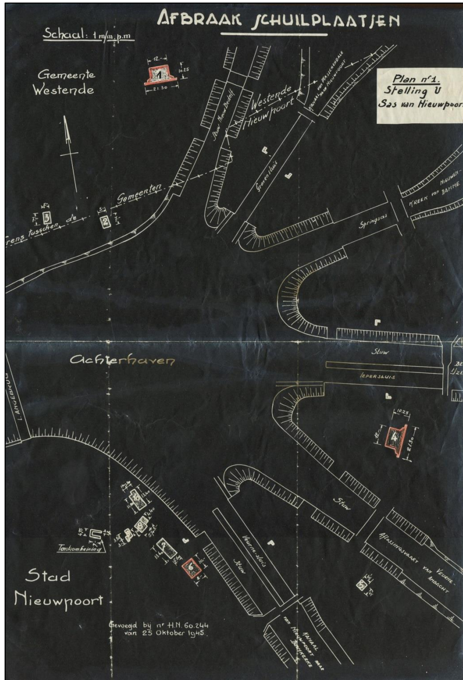
Fig. 3 Widerstandsnest Tilly 2 (1) rond de Ganzepoot.

teruggevonden exemplaar. Tussen de IJzer en de Noordvaart lag een andere, zeer vergelijkbare bunker. Tussen de Noordvaart en het kanaal Nieuwpoort-Duinkerke was een kleinere, geïsoleerde bunker ingeplant. Zuidelijk is een concentratie van 5 bunkertjes (2 machinegeweerneusten, een munitiebunker, een loods, ... 5 ) en een tankomheining gekend. (fig. 3).