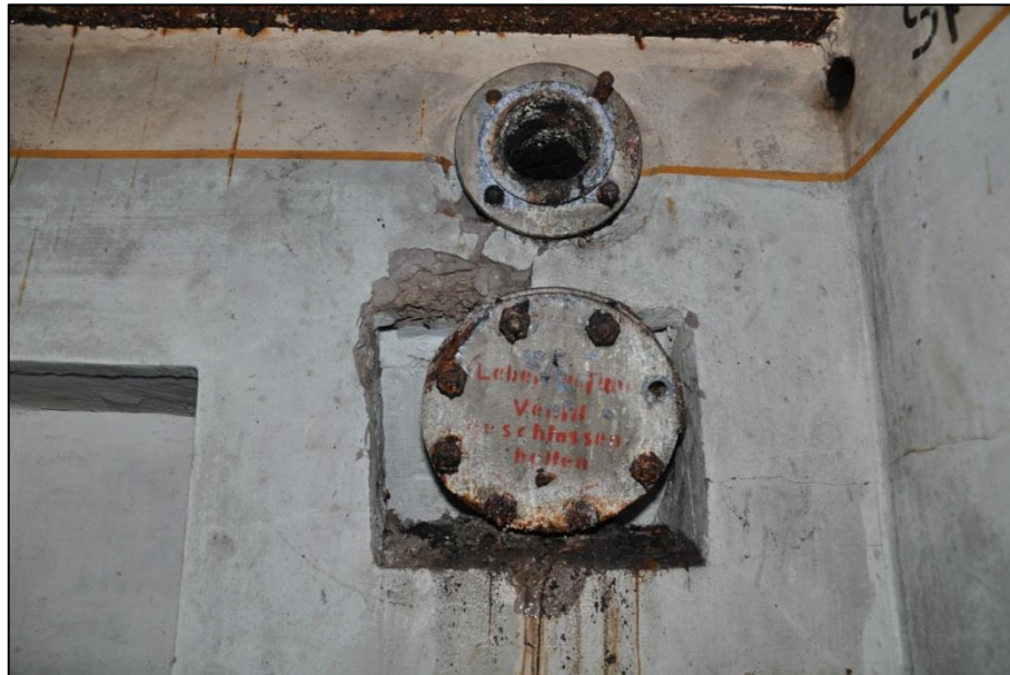
Fig. 13 Precies in de hoek zit de spreekbuis. Onderaan staat op de afsluitkap de dringende boodschap het (overdruk)ventiel niet te openen. Dat ventiel was erboven aangebracht, maar is in dit geval verdwenen.

De zuidoosthoek van de bunker is blokvormig uitgebouwd om er een vereenvoudigde 16 zgn. Tobruk, een Offener Beobachter (open observatiepost) in onder te brengen, enkel bestaande uit een toegangstrap en een schutterspost (fig. 14). Deze observatie- en mitrailleurpost is bereikbaar via een afzonderlijke, opwaartse, geknikte trap. De deuropening meet 0,6 op 1,8 m. De achzijdige constructie lijkt op een bokaal, is binnenwerks 1,4 m breed en bovenaan cirkelvormig ( Ringstand ) afgesloten. De diameter bedraagt binnenwerks 0,75 m. In de opening is een uitspringende richel voorzien, waarin de ronddraaiende stoel voor een machinegeweer kon functioneren. De beschikbare hoogte komt op 1,6 m. Qua afmetingen komt dit overeen met de Bauform Type 58c 17 . Op de oostzijde vertrok vanuit een muurkast een metalen spreekbuis naar het manschapsverblijf. Er is ook een verluchttingsbuis te zien. Het is onduidelijk waar deze uitgeeft.