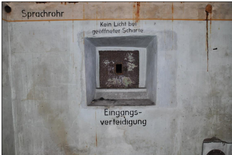
Fig. 10 Zicht op de Eingangsverteidigung , afsluitbaar met een metalen paneel.

Op de muren zijn in zwarte verf allerlei teksten aangebracht; voorschriften, die vooral de veiligheid van het personeel op het oog hebben. In de noordoosthoek lezen we: Jegliches Anschliessen von elektrischen Geräten gefährdet die Gesamtanlage und ist daher verboten (Elke aansluiting van elektrische apparaten brengt de gehele inrichting in gevaar en is daarom verboden).