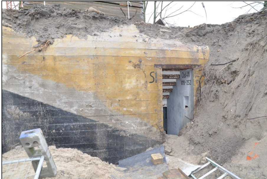
Fig. 5 Identificatie van de bunker t.h.v. de ingang.

De bunker is grotendeels ondergronds bedoeld. Enkel de bovenkant 11 en een deel van de voorzijde liggen vrij; wat de toegang en de ventilatie toeliet. De ingangen zijn bereikbaar via een 1,22 m brede, bakstenen trap -op de zuidoosthoek- en een 1,95 m breed, platform, dat door een bakstenen muurtje is afgeboord (18,5 x 11,5 x 5 cm, rood). Het vrij liggende muurgedeelte is geel geschilderd om het als zand te camoufleren.