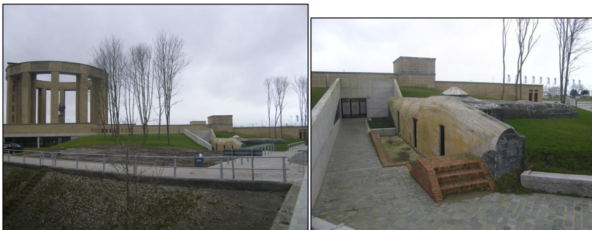
Fig. 19 Huidige toestand

Een, in de vergetelheid verdwenen, Duitse bunker uit de Tweede Wereldoorlog is opnieuw opgedoken en nu ook geïntegreerd in de omgeving van het bezoekerscentrum Westfront en het Koning Albert I monument (fig. 19). De bunker werd herkend als een Regelbau 656, een personeelsbunker voor 15 man, die na de oorlog bewaard bleef, omdat een inrichting als schuilkelder nodig werd geacht.