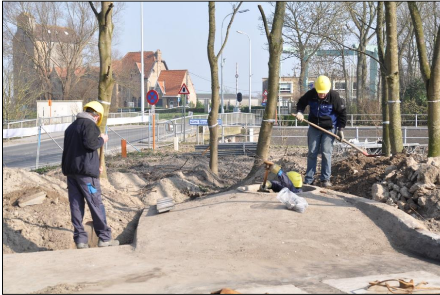
Fig. 1 Het team van het agentschap Onroerend Erfgoed in actie! 1