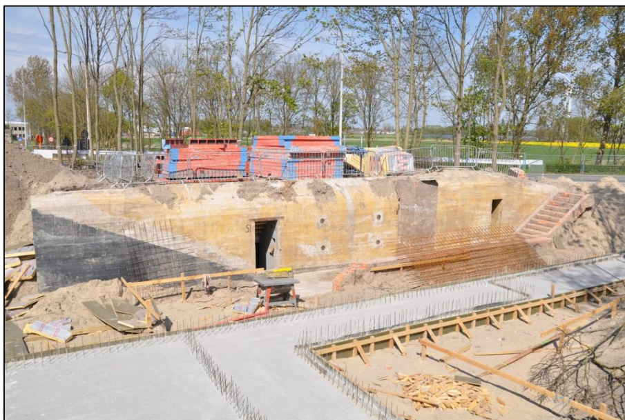
Fig. 6 Voorzijde van de bunker: zwart en geel geverfd. De ingangen zijn bereikbaar via een bakstenen trap en platform.