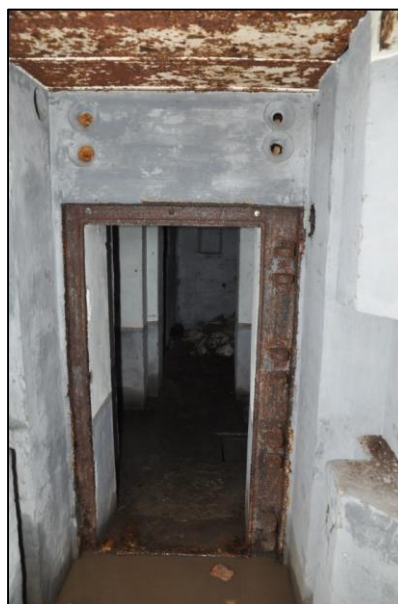
Fig. 9 Doorkijk van de ene tussenruimte naar de andere doorheen het centrale sas. Op de voorgrond rechts zijn een muurkast en muursleuf te zien (ventilatie en radio).

Vanuit het manschapsverblijf konden de tussenruimtes en de toegangstrappen via een opening in de muur (fig. 9) in de gaten en onder schot gehouden worden; de zogenaamde Eingangsverteidigung . Ook deze openingen konden afgesloten worden (fig. 10).