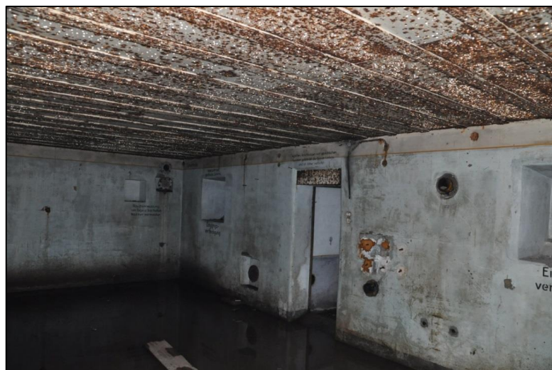
Fig. 11 Manschapsverblijf; foto genomen in de richting van de zuidoosthoek. Aan weerszijden van de centrale ingang zijn ventilatie mogelijkheden. Andere muursporen wijzen op aan de muur bevestigde voorzieningen.

Het manschapsverblijf meet 7,65 op 3,8 m en is 2,3 m hoog. Net als in de andere ruimtes bestaat het plafond ook hier uit stalen balken. De muren waren witgekalkt. Bovenaan is een gele fries geschilderd, afgeboord met een donkergele lijn (fig. 11). Hier was accommodatie mogelijk voor 15 manschappen. Tegen de noord- en de westmuur waren 5 stapelbedden geplaatst.