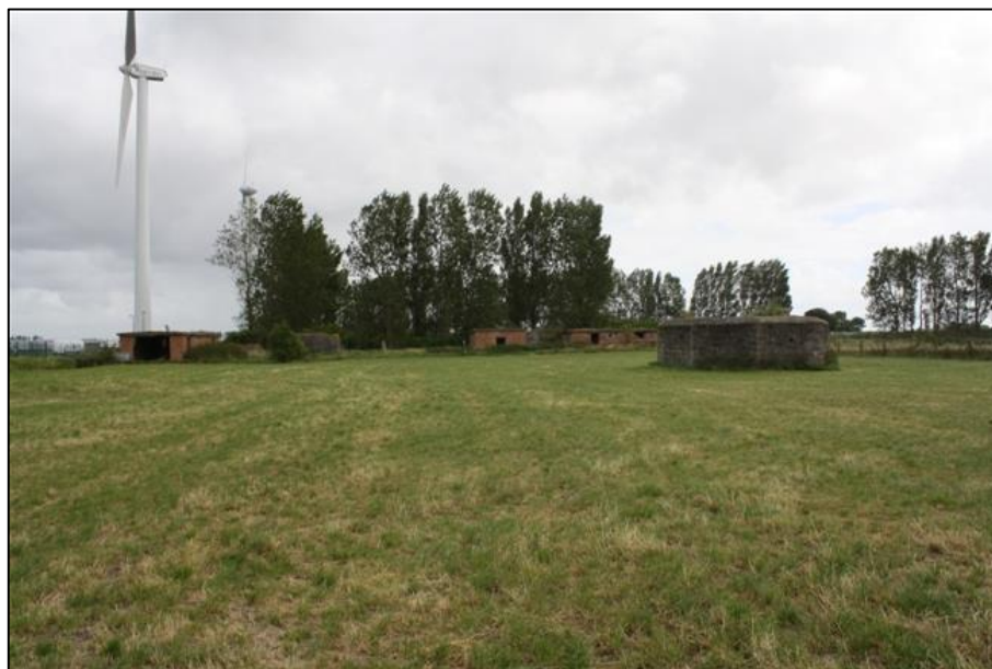
Fig. 4 Stutzpunkt Müncheberg ( http://www.bunkerfotos.nl/overigemuncheberg.htm ).

De meest noordelijke bunker vormt onderwerp van dit rapport. Kort na de oorlog zijn alle constructies afgebroken op 3 bunkers (fig. 3, 1, 4 en 6) na, die als schuilkelders zijn ingericht. Ze werden dan voorzien van toegangsschachten en volledig aangeaard 6 . Zo'n 400 m ten noorden zijn trouwens nog bakstenen constructies bewaard gebleven van het Stutzpunkt Müncheberg (fig.4). Verspreid rond 3 geschutplatformen (kanonnen van 37 mm) lagen bunkers, zowel bedoeld voor munitieopslag als voor manschappenverblijf.