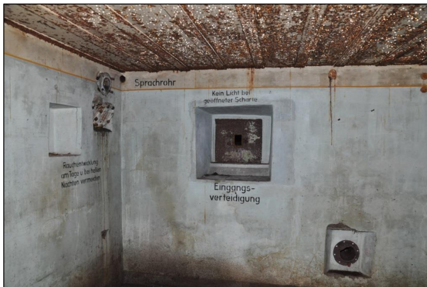
Fig. 12 Zuidoosthoek van het manschapsverblijf met een concentratie van teksten.

Bij die bunkers is ook sprake van een Zuluftventil (luchttoevoerventiel) en een Überdruckventil (overdrukventiel). De luchttoevoerventielen zijn ingewerkt in het plafond, het overdrukventiel in de tussenmuur. In dit geval lijkt het dat ze allebei, boven elkaar in de muur ingewerkt zijn (fig. 13). Een overdrukventiel bestaat uit een beweegbare klep, die op zijn plaats gehouden werd door een gewichtje. Als er een gasaanval was, werd de bunker in overdruk gebracht. De overdruk duwt op de klep en laat via het ventiel de verbruikte lucht ontsnappen. Als de druk wegvalt, sluit de klep zich door het gewichtje en kan er geen gas of door gas vervuilde lucht binnenkomen 15 .