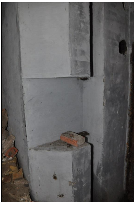
Fig. 15 Muurgleuf en muuruitsparing i.f.v. een luchtkoker, een radiotoestel en een antenne.

In alle onderdelen van de bunker zijn op verschillende plaatsen muurkasten uitgespaard. In beide tussenruimtes zijn telkens 2 muurgleuven aanwezig, die via verticale metalen buizen verbinding maakten met het dak. Ze lopen uit in een vierkante metalen plaat (zijde: 1 m). Hierlangs werden ook radioantennes uitgestoken 18 (fig. 8, 2-5, fig. 9 en fig. 15). De radio stond in een open muurkast van het centraal sas.