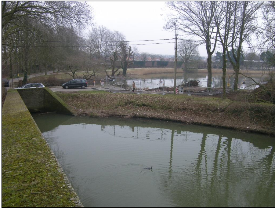
Fig. 1 Onder de weg, die de Boterplas van de Majoorsgracht scheidt en toegang geeft tot het Eiland moest een verbindingskoker aangelegd worden.

Bij het plaatsen van een koker, die de Boterplas met de Majoorsgracht moet verbinden en zo toelaten de waterstand beter te regelen, is men op resten van de Bellepoort gestoten. De werken vormen een uitloper van de herinrichting van de stationsbuurt. In dit geval waren de stad en de VMM opdrachtgever.