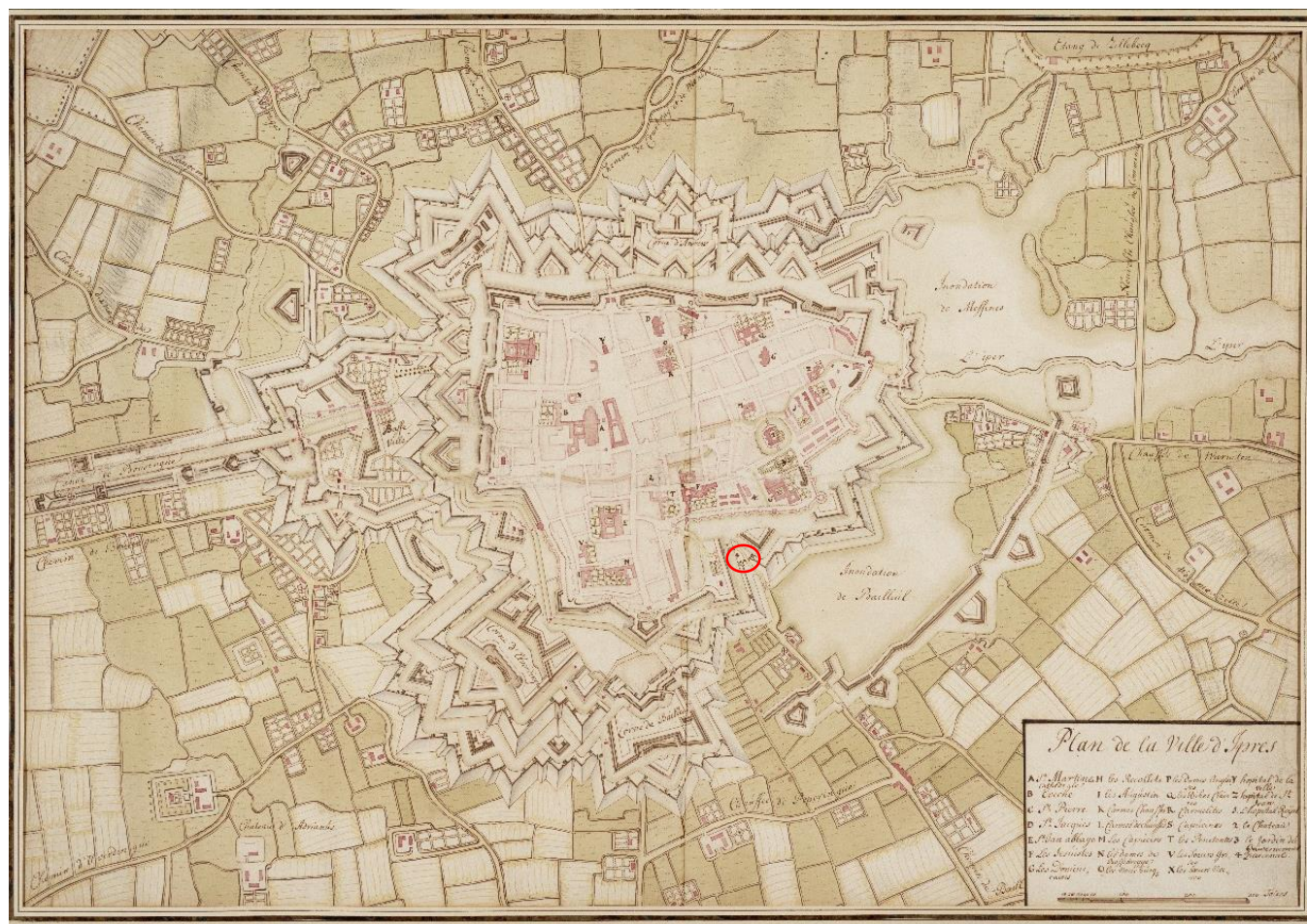
Fig. 4 Plan de la Ville d'Ipres Anoniem grondplan van de stadsversterking uit de 18 de eeuw (gekleurde prent, Stedelijk Museum). (Mus e.a. 1992, 45-46)