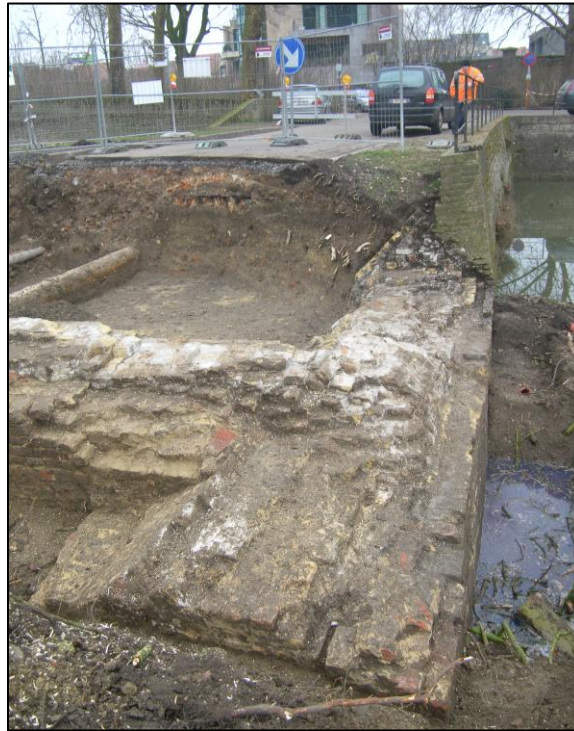
Fig. 7 Zicht op de waterkeringsmuur afgewerkt met een ezelsrug.

In een latere (Hollandse?) fase is het geheel hersteld. Dit is duidelijk te zien aan de witgrijze, harde mortel, waarmee o.a. ook de ezelsrug is herbouwd.