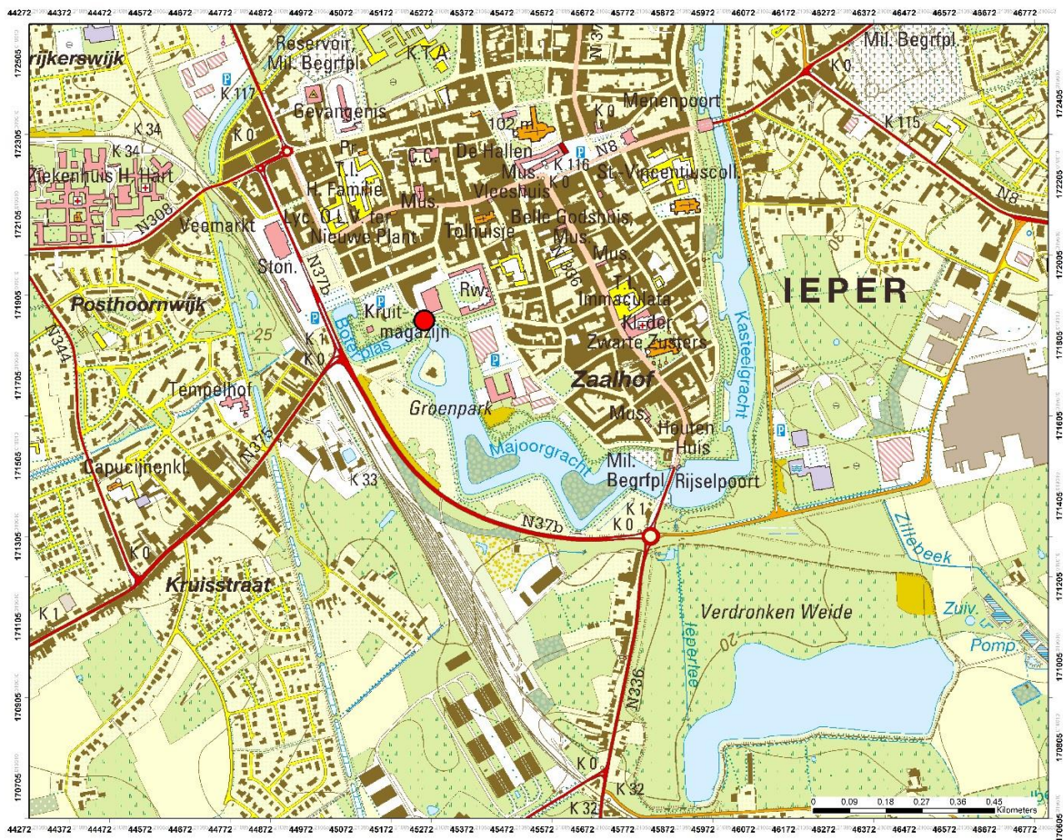
Fig. 2 Situering van de ingreep op de topografische kaart.

De vindplaats ligt op de noordwestelijke stadsrand, in de weg tussen de Boterplas en de Majoorgracht, vlakbij het Eiland. Dat is een van de ravelijnen 1 van de Vaubanversterking in de Majoorgracht.