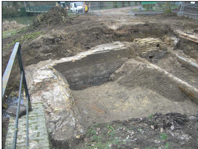
Fig. 6 Frontaal zicht op het bruggenhoofd. Bemerkt de strook zandsteen en het verschil tussen het rechter- en het linkergedeelte van de bovenbouw.

Het bovenstuk van het oostelijk gedeelte is anders uitgevoerd. Het is met gele baksteen gemetseld, is getrapt en vertoont een holte (0,32 x 0,26 en 0,84 m diep). Er is ook een ijzeren staaf in verwerkt. Door latere verstoringen kan er niet uitgemaakt worden of dit gelijktijdig is met de rest, dan wel posterieur. Een van de verstoringen was het ingraven van een communicatiekabel tijdens WO I. Diende de holte voor het inbrengen van een van de draagbalken van de brug?