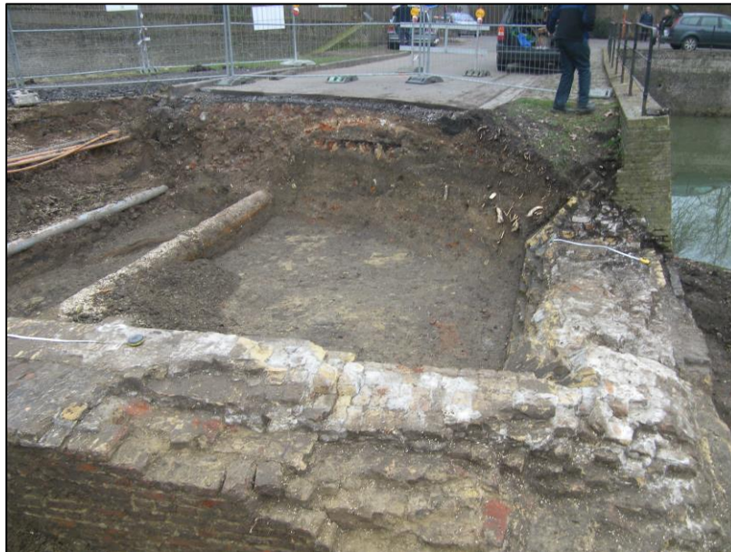
Fig. 8 Bruggenhoofd en waterkeringsmuur. Bij de herstelling, herkenbaar aan de witgrijze mortel, zijn de sporen van de oorspronkelijk bouwnaad verdwenen.

In een latere (Hollandse?) fase is het geheel hersteld. Dit is duidelijk te zien aan de witgrijze, harde mortel, waarmee o.a. ook de ezelsrug is herbouwd.