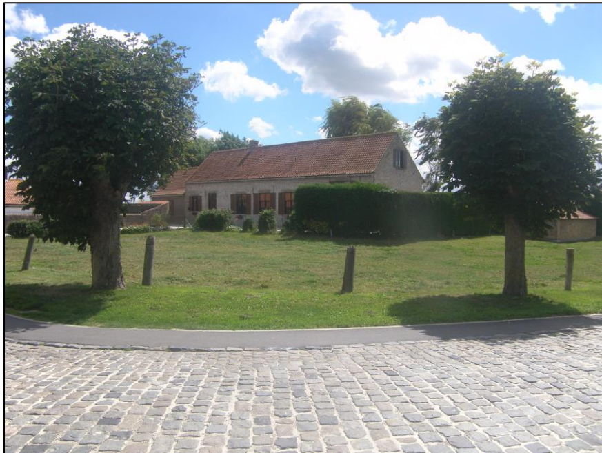
Fig. 3 Zicht op het Blauwhuis. Op de voorgrond en rechts is de gedempte omgrachting te zien.

Een tweede neerhof sluit er op aan. Hier vermeldt de 17 de eeuwse kroniekschrijver Pauwel Heinderycx de kasteelhoeve als “een schoon huys met groote grachten rontom” 2 . Benaderend kan de diameter van dit wooneiland nu aan de voet op 50 m geschat worden. Van de omgrachting is een -gemeenschappelijk- stukje bewaard gebleven.