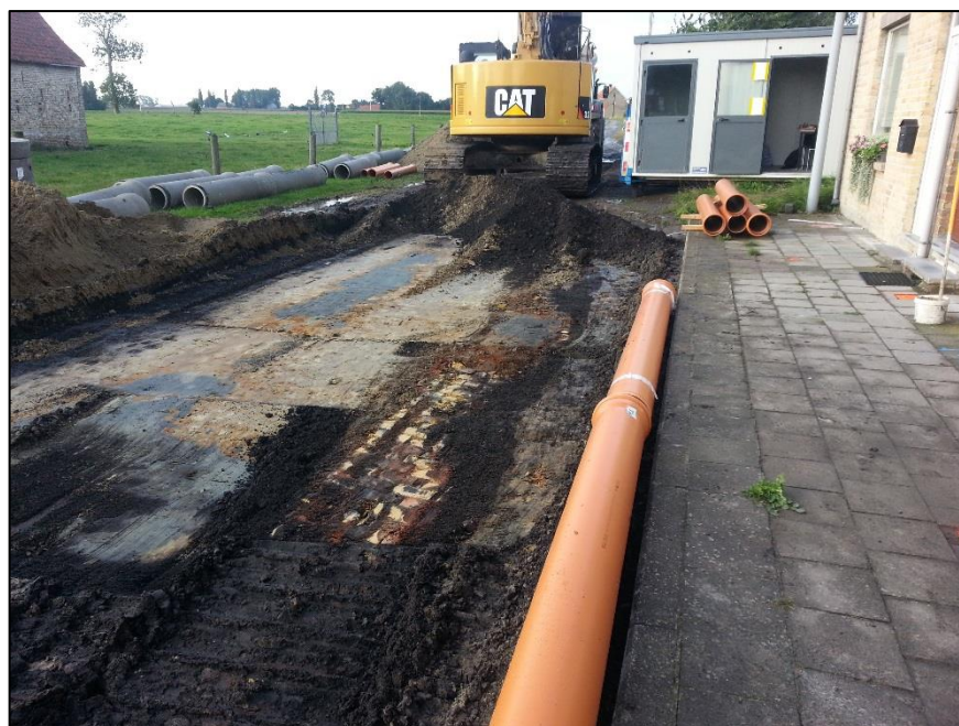
Fig. 13 Oude rooilijn in de Veurnestraat, tegenover het Blauwhuis.

Ook in de Veurnestraat is tegenover het Blauwhuis een oude rooilijn herkend. Ditmaal was zowel rode als gele baksteen aangewend (22 x 10 x 6 à 7 cm) (fig. 8, 5). De breedte bedraagt 0,75 m.