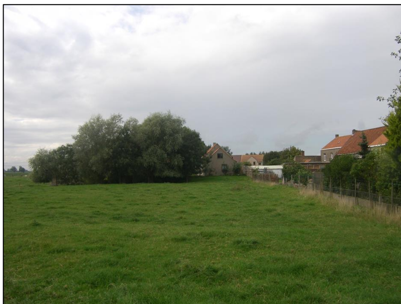
Fig. 4 Zicht vanuit het oosten op het neerhof van de Burg van Leisele. Op de achtergrond is nog een restant van de omgrachting aanwezig. Erachter ligt het Blauwhuis.