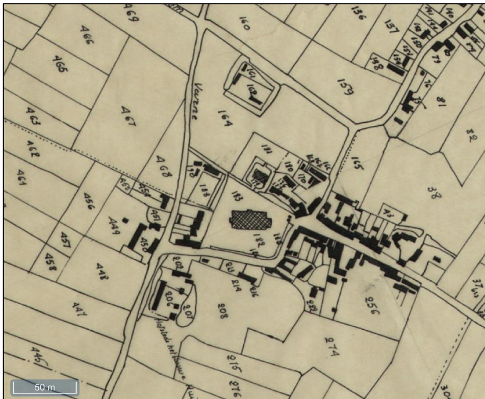
Fig.7 De dorpskern op de Poppkaart (1845).