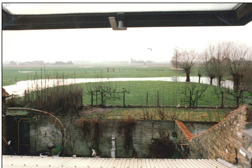
Fig. 5 Foto vanop de 1 ste verdieping van Leiseledorp 4. Na zware regenval tekent de omgrachting van het neerhof zich voor een tijdje duidelijk af. Rechts: het, nog bestaande gedeelte.