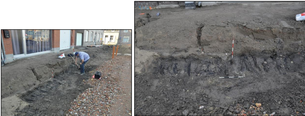
Fig. 14 Restant van het houten wegdek in Leiseledorp-oost.

afboorde (fig. 8, 1). Deze kerkgracht werd fasegewijs gedempt. Het grachtgedeelte ten westen werd midden 18 de eeuw gedicht. Kort vóór 1914 volgde de rest van de gracht. Dit blijkt uit de notulen van de gemeenteraad van 23 maart 1904, waarin vermeld wordt “dat de gracht liggende aan de oostkant van ’t kerkhof om zo te zeggen midden ter dorpsplaats, een voortdurend gevaar is voor de voetgangers en voor gespannen, overwegend dat het nog noodzakelijk is in ’t belang der openbare gezondheid ...” . De houten verharding van het wegdek is in het licht van deze oude topografie te verklaren.