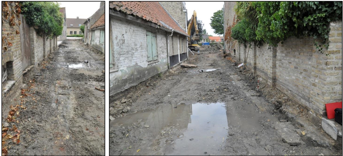
Fig. 12 Zicht op de oude rooilijn in het verbindingsstraatje op de zuidoosthoek van Leiseledorp vanuit het oosten en het westen.

Ook in de Veurnestraat is tegenover het Blauwhuis een oude rooilijn herkend. Ditmaal was zowel rode als gele baksteen aangewend (22 x 10 x 6 à 7 cm) (fig. 8, 5). De breedte bedraagt 0,75 m.