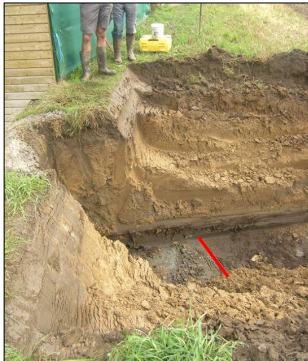
Fig. 11 Grachtvulling min of meer, haaks op het zijstraatje van Leiseledorp-zuid. In de achtergrond is de genivelleerde motte en gedempte gracht merkbaar.

In het verlengde van het straatje is bij het graven van een rioleringsleuf de noordelijke rand van een gracht aangesneden. Deze gracht stond haaks op het straatje en staat waarschijnlijk met de omgrachting van de Burg van Leisele in verband (fig. 8, 3, c). Op het DHM is er in dat verband alleszins ook wat te zien. Benaderend kan de diameter van de motte aan de voet op 75 m gebracht worden. De door J. Termote waargenomen muurresten kunnen in deze context zeker met een poortgebouw in verband gebracht worden.