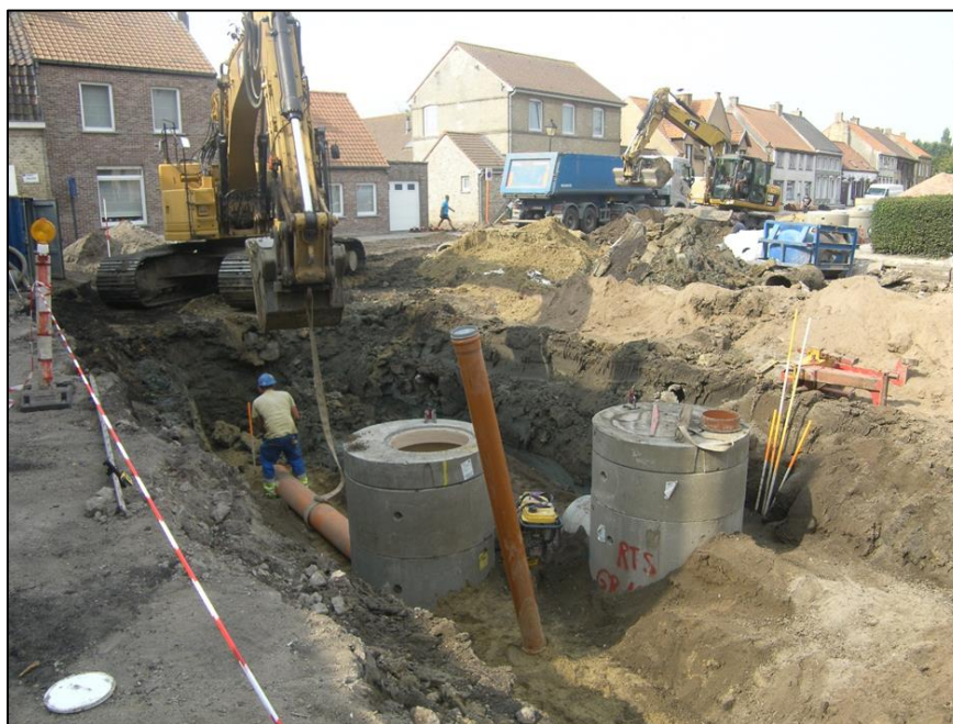
Fig. 1 Graafmachines aan het werk in de hoek van Leiseledorp. De straat loopt deels rond het kerkhof.

De rapportage is dan ook eerder fragmentair en is eigenlijk niet meer dan een aantal waarnemingen.