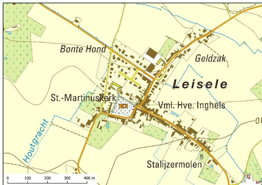
Fig. 2 Topografische kaart van het dorp.

Vlakbij wordt het plateau doorsneden door de noord-west zuid-oost verlopende Voutebeek, waarop haaks de Houtgracht aansluit.