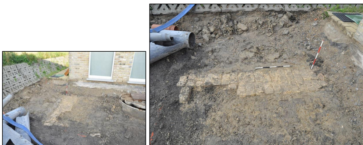
Fig. 10 De muur ligt in het verlengde van de andere achtergevel.

Op het uiteinde van het bewuste straatje is nog een muurfragment opgemerkt, dat ditmaal perfect in het verlengde van de bestaande bebouwing lag. De muur is opgebouwd met gele baksteen (21 x 10 x 5,5 cm) en precies 2 stenen breed. Het betreft dan ook een restant van een verdwenen huisje in de rij tussen het kerkhof en kasteel (fig. 8, 3, b).