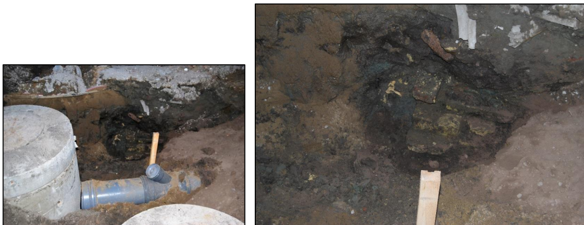
Fig. 9 Onderdeel van het vermoedelijke poortgebouw (@ J. Termote)

Ook de inplanting wijst in de richting van een poort. De plaats vormt de aanzet van de kortste afstand van het neerhof naar de begin van de Beverenstraat, de eigenlijke dorpsstraat van Leisele, en tevens naar de oostelijke toegang tot het kerkhof en de kerk.” 6