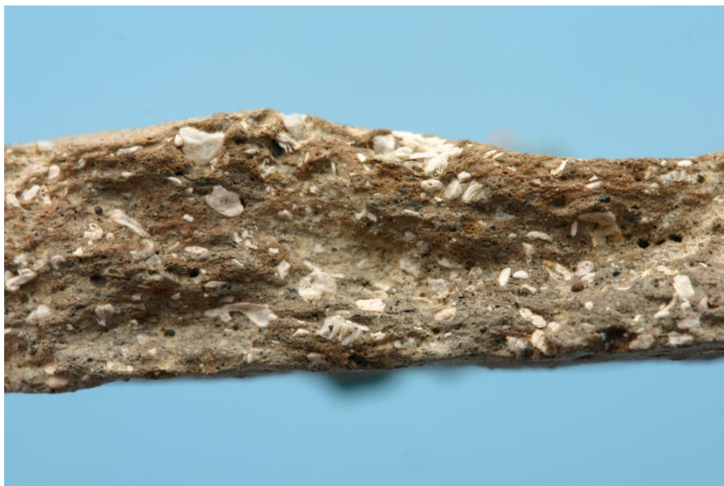
Het baksel wordt zichtbaar op een verse breuk van oxiderend gebakken, handgevormd aardewerk uit de 10de - eerste helft van de 11de eeuw, uit de regio van Douai (F) (uit De Groote 2014a, b)

slijpplaatjes voor petrografisch onderzoek). Enkele archeologische referentiecollecties laten effectief dergelijk meer gedetailleerde studies toe. Zo worden soms bakselsamples geknipt zodat een verse breuk kan bekeken worden. Het maken van slijpplaatjes is momenteel nog beperkt maar men geeft vaak aan dat de intentie bestaat om dit in de nabije toekomst te doen of door externe onderzoekers te laten doen. Soms is gezien de museale opstelling echter enkel een vormelijke studie mogelijk. De meeste archeologische werkgroepen lijken na overleg een detailstudie toe te laten (meestal mits eigen financiering van de externe onderzoekers) en willen zelf verder bouwen aan collecties van slijpplaatjes of breukstalen.