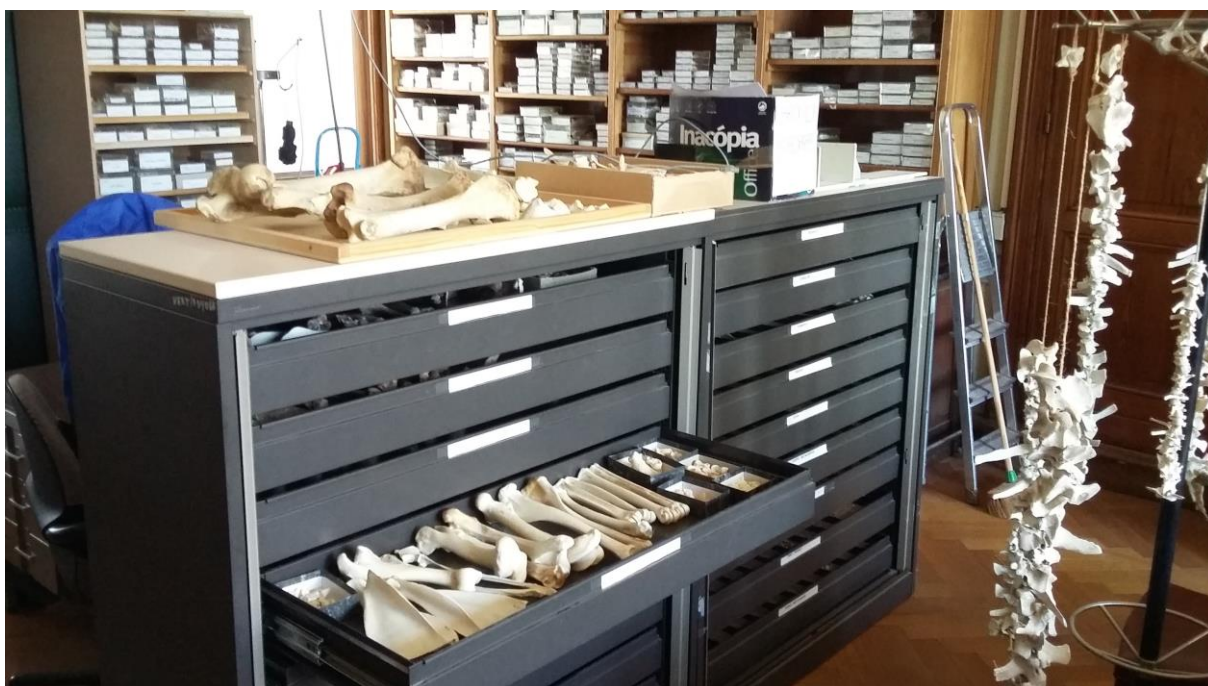
Referentiecollectie van recente zoogdieren in het Koninklijk Belgisch Instituut voor Natuurwetenschappen.

Een overzicht van de problematiek rond referentiecollecties werd in 2004 aan de hand van een reeks Europese voorbeelden gepubliceerd (Lange 2004). Dat overzicht is nog steeds waardevol, zij het dat de middelen ondertussen niet zijn toegenomen, terwijl de digitalisering zich wel verder sterk ontwikkeld heeft.