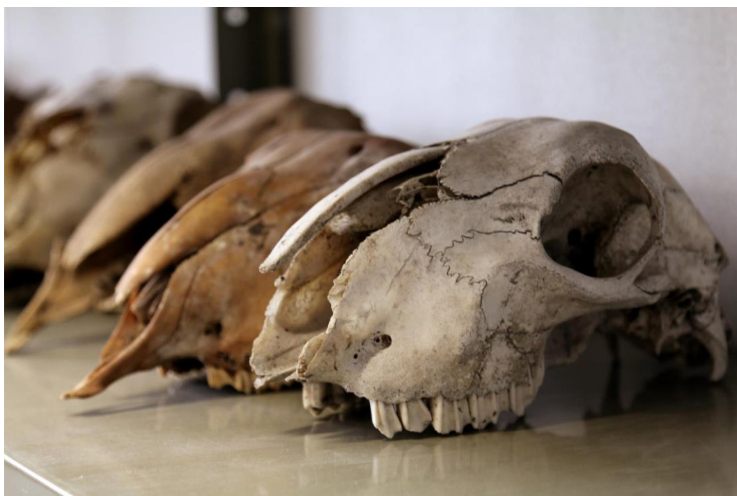
Schedels van schapen ( Ovis ammon f. aries ) uit de referentiecollectie van het agentschap Onroerend Erfgoed: recente en archeologische exemplaren

De geschetste problematiek bij het samenstellen van referentiecollecties komt echter niet neer op een zwart-wit-opdeling tussen culturele en ecologische artefacten. Zo blijkt dat recent dierlijk skeletmateriaal toch niet altijd de beste referentie biedt voor het identificeren van archeologische dierenresten. Voor vissen stelt dit bijvoorbeeld geen probleem maar vooral gedomesticeerde soorten zijn qua morfologie sterk veranderd doorheen de tijd, wat maakt dat archeologische vondsten, waarvan de identificatie in de huidige stand van het onderzoek niet ter discussie staat, vaak een betere basis voor vergelijking vormen dan recent materiaal. Hetzelfde geldt trouwens soms voor nog bestaande wilde diersoorten, die door klimaatswisselingen of bejaging sterk in morfologie (vooral in grootte) zijn gaan verschillen gedurende het Holoceen. En als het om uitgestorven diersoorten gaat, kan natuurlijk enkel archeologisch of paleontologisch materiaal (afhankelijk of het al dan niet in een door mensen aangelegd spoor is aangetroffen) als referentie dienen.