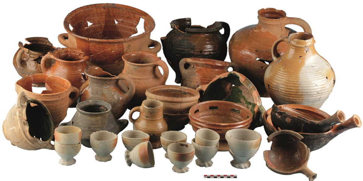
Aardewerkensemble uit een bakstenen beerput (Aalst, late 15de eeuw, foto Hans Denis, uit De Groote & Moens 2018).

Bij recent ecologisch referentiemateriaal is de herkomst meestal bekend. Bij archeologische vondsten van ecologische artefacten zijn er evenwel enkel gegevens over de vindplaats maar niet over de plaats van oorsprong van de resten. Voor culturele artefacten geldt dit eveneens. Opgravingen van de productiesites van culturele artefacten, waarbij grondstoffen, productieafval, en al dan niet afgewezen producten worden aangetroffen, zijn daarom van immens belang om referentiemateriaal te leveren.