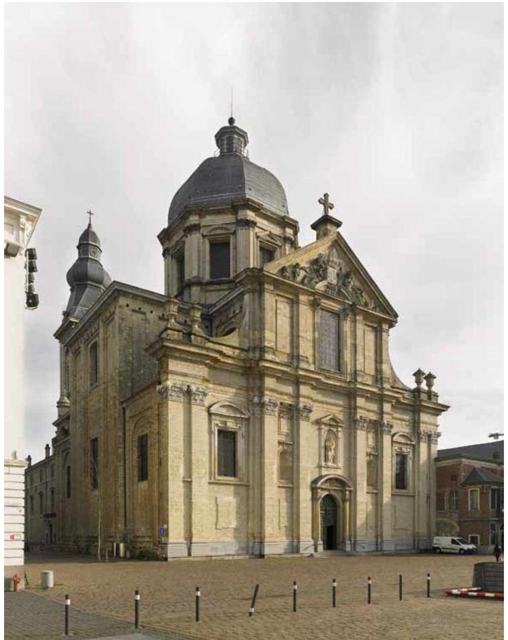
FIG. 2 Huidige kerkgevel van de Sint-Pietersabdijkerk in Gent. Present church façade of the abbey church of St Peter's in Ghent.