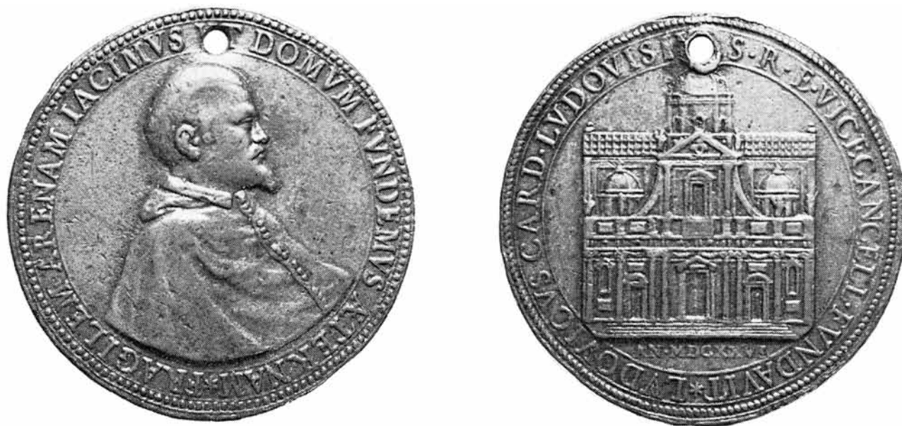
FIG. 4 Medaille geslagen ter ere van de eerstesteenlegging van de Sint-Ignatiuskerk in Rome (1626) (Privé-verzameling, Johnson 1982, 37). Medal cast in honour of the laying of the first stone of the church of St Ignatius in Rome (Private collection, Johnson 1982, 37).