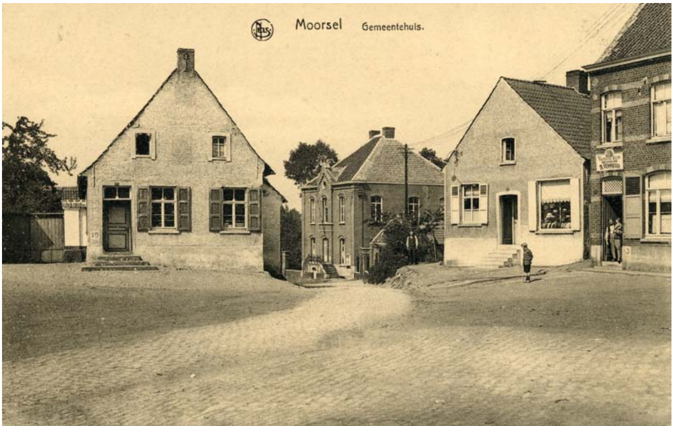
FIG. 4 Foto van de vindplaats ca. 1920, links de inmiddels afgebroken woning. Picture of the find-spot ca 1920, on the left the demolished house.

De tweede reeks, met munten uit Oostenrijk, is gelimiteerd tot een looptijd van vijf jaar, namelijk van 1788 tot 1793. Dit blok bevat munten uit de regering van Jozef II (1780-1790), Leopold II (1790-1792) en Frans II (1792-1797).