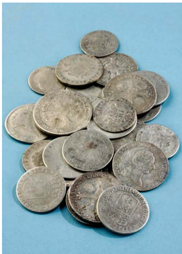
FIG. 1 Muntdepot uit Moorsel. The coin deposit from Moorsel.