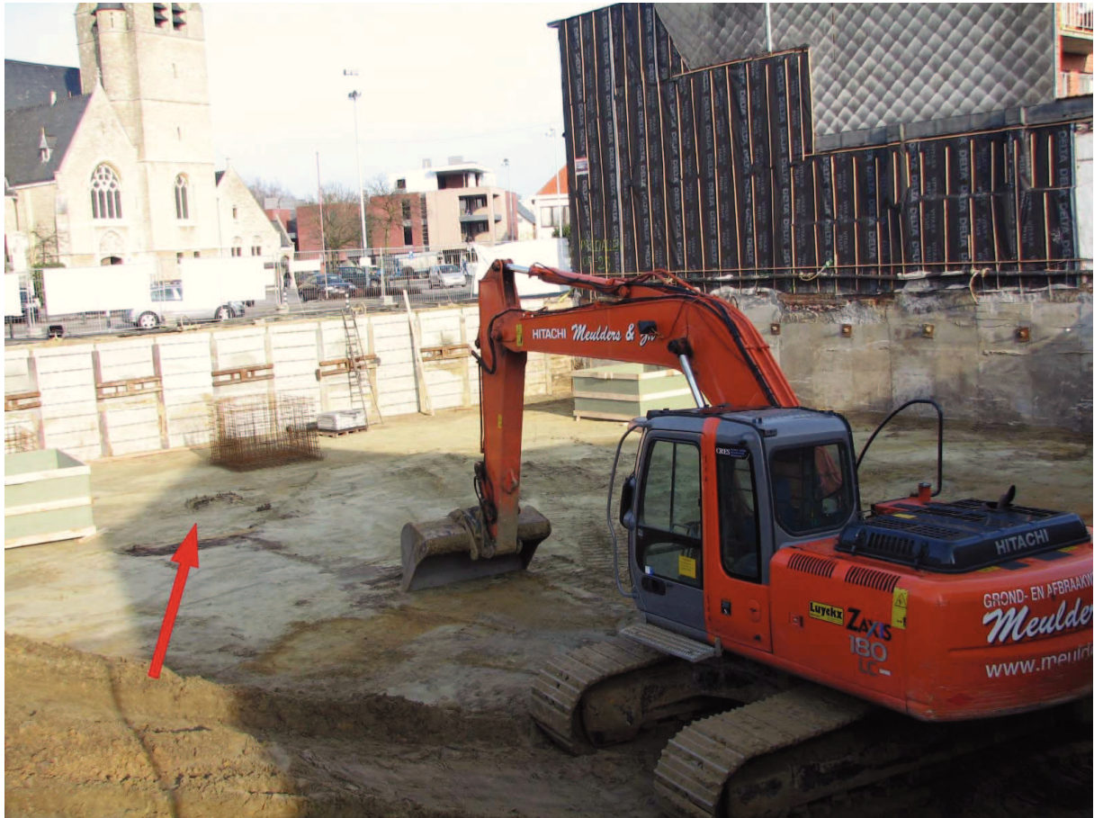
Fig. 4 De bouwput op de dag van de vondstmelding. De rode pijl geeft de ligging van de waterput aan.