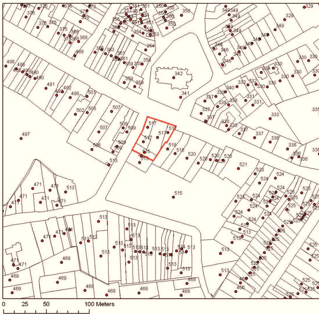
Fig. 1 Kadastrale kaart met aanduiding van de vindplaats in het rood.