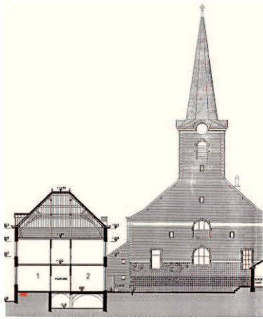
Fig.4: doorsnede van de pastorie

In de noordoostelijke hoek van de noordwestelijke kamer van de pastorie (fig. 3 en 4, kamer 1; rood vierkant), waar de skeletresten werden aangetroffen, werd na een paar cm te hebben verwijderd het oppervlak volledig zuiver gemaakt. Er werden geen archeologische sporen aangetroffen.