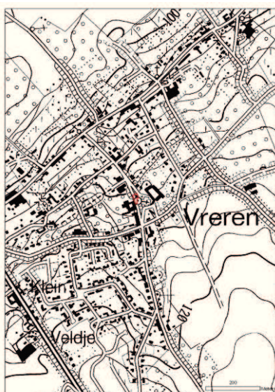
Fig.2: topografische kaart