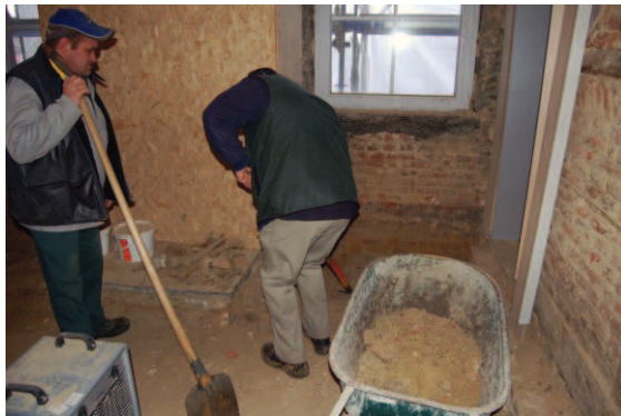
Fig.6: opkuisen van de opvullingslaag

De skeletresten werden aangetroffen in een compact, geelgrijze, zandige, lemige opvullingslaag, gevuld met puin. Dit puin bestond uit fragmenten van mergelblokken, bakstenen, mortel en leisteen. Na een boring konden we vaststellen dat deze laag minstens 60cm dik was.