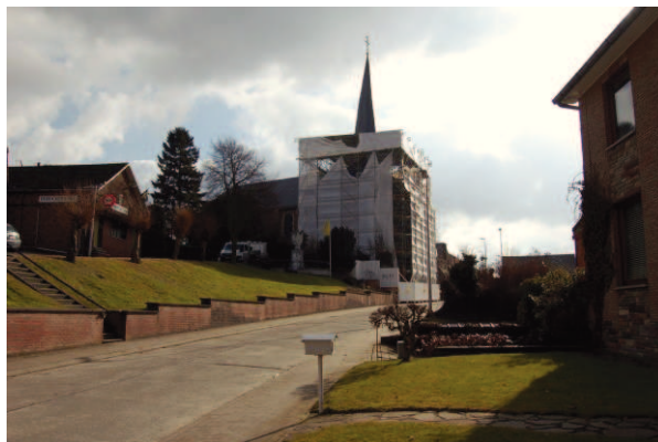
Fig.1: zicht op de pastorie en de kerk

De site ligt bovenop een heuvel in het midden van het dorp. De pastorie werd vlak tegen de kerk aangebouwd. De site ligt in een bebouwde zone maar de gronden er rond zijn droge leembodems zonder profiel (Abp).