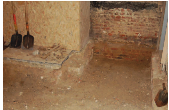
Fig.7: opgekuist vlak

In deze laag werden nog skeletresten en botfragmenten van menselijke oorsprong aangetroffen. De botresten in deze puin- en opvullingslaag zijn waarschijnlijk afkomstig van het rond de kerk gelegen kerkhof dat met de bouw van de pastorie misschien deels geruimd werd en waardoor botresten in deze laag terecht kwamen. De skeletresten werden naderhand naar het VIOE - labo te Zellik gebracht waar ze antropologisch zullen bestudeerd worden en in het depot worden opgeslagen.