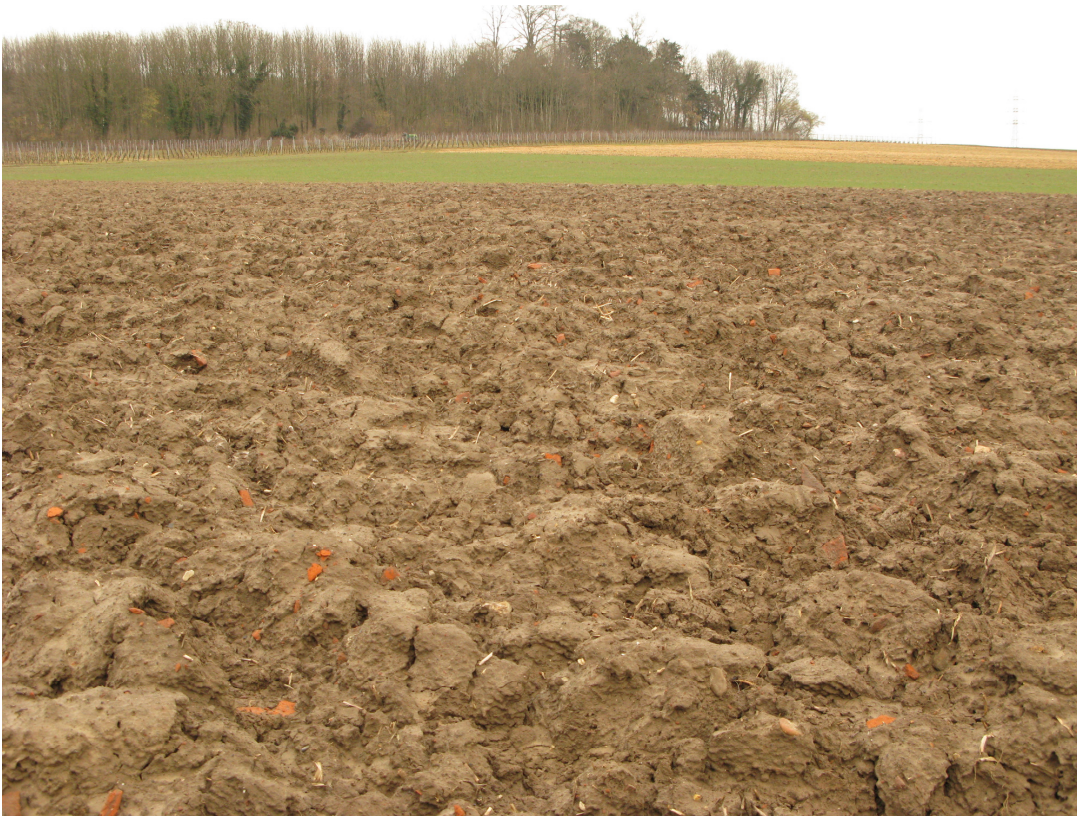
Fig 3: Zicht op de concentratie dakpannen