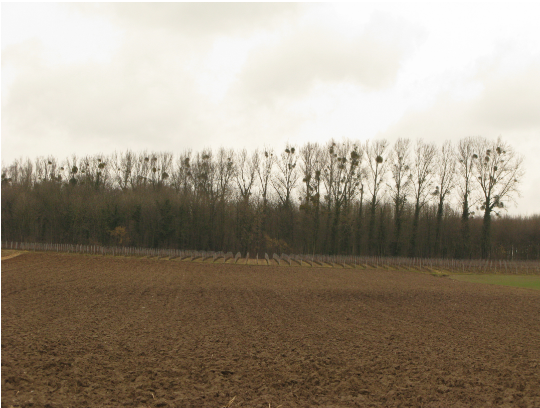
Fig 4: Zicht op de akker, met de donkere verkleuring op de plaats waar de archeologische concentratie zich bevindt.