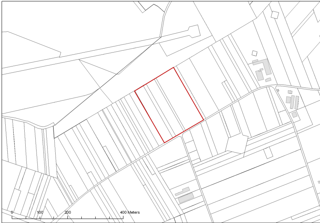
Fig. 1 Kadastrale kaart met aanduiding van de vindplaats in het rood.