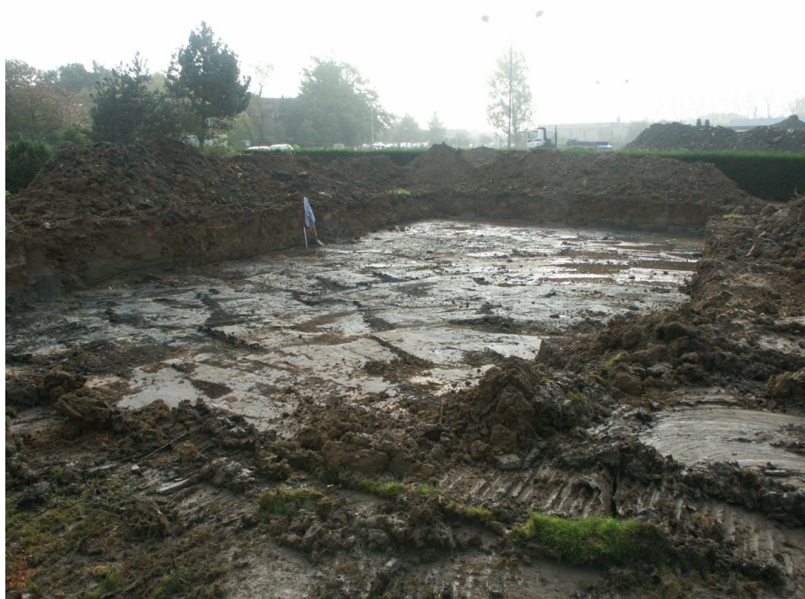
Zicht op de werkput (vanuit het noorden).