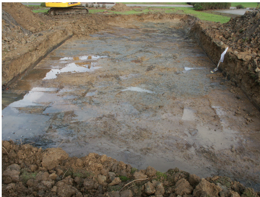
Zicht op de werkput (vanuit het zuiden).