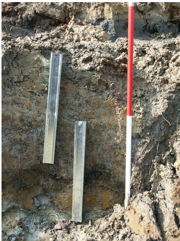
Pollenbakken in het profiel.