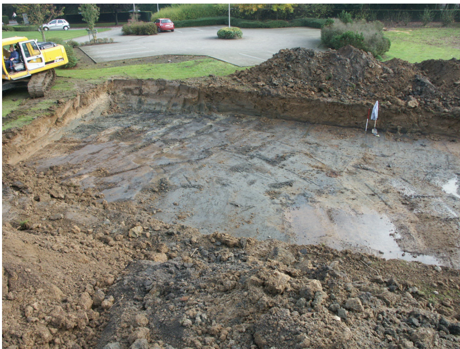
Zicht op de werkput (vanuit het westen).