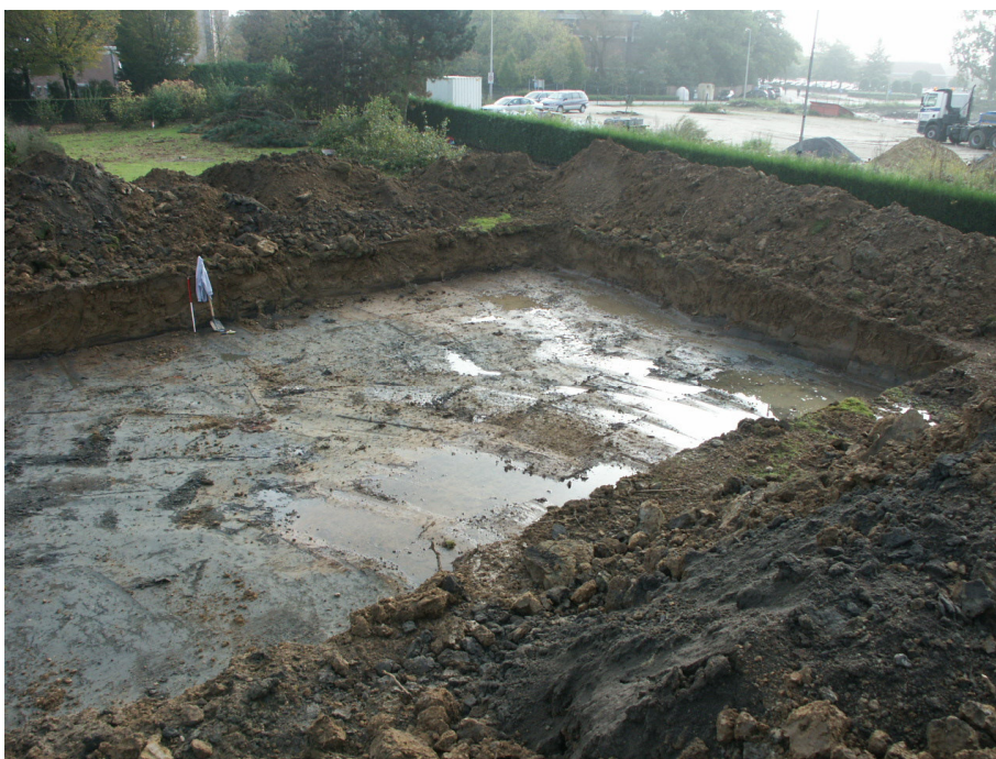
Zicht op de werkput (vanuit het westen).