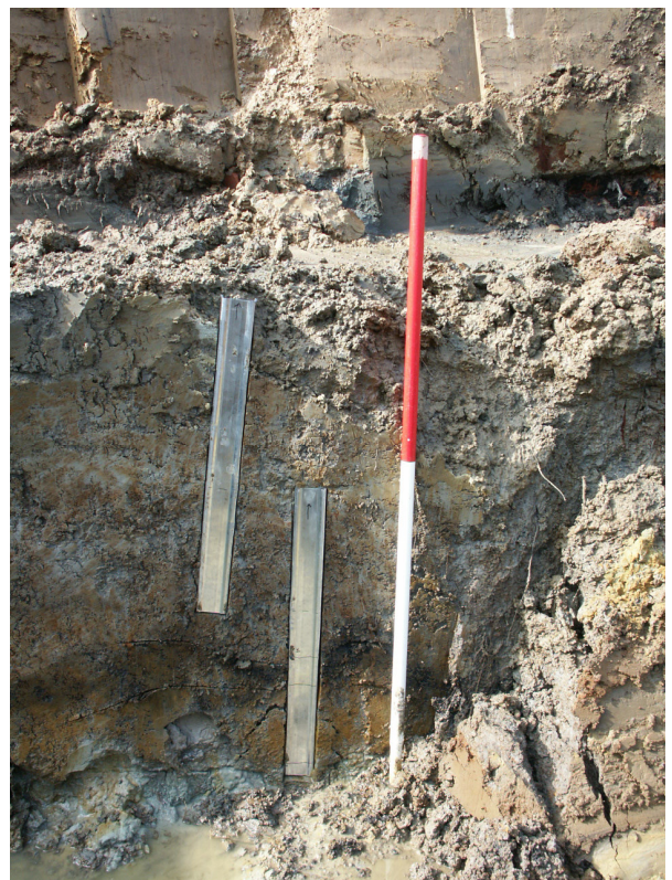
Pollenbakken in het profiel.