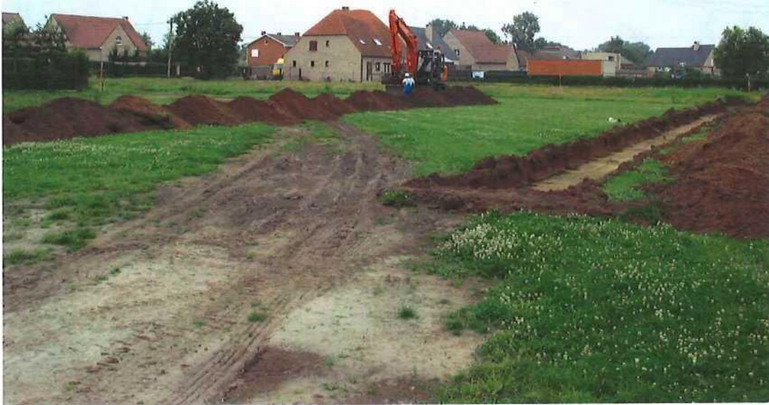
Afbeelding 1: Eindhout (Laakdal) - Gemeenteheidestraat: overzicht projectzone (foto vanuit NO)