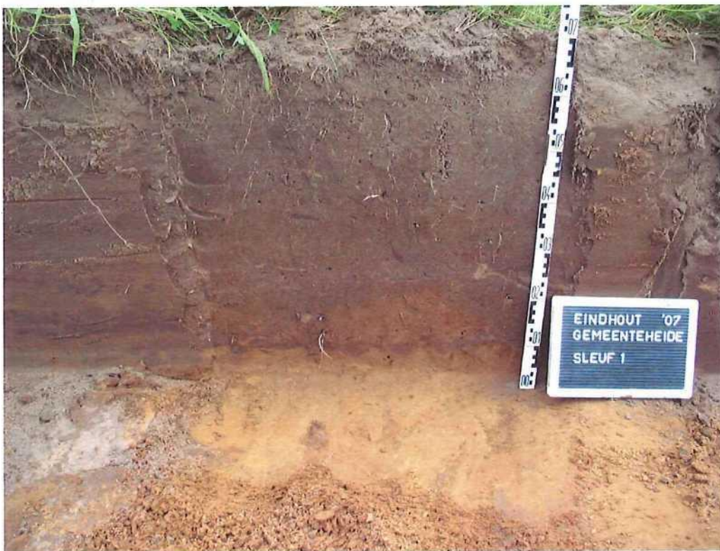
Afbeelding 4: Eindhoven (Laakdal) - Gemeenteheidestraat: sleuf 1, profiel 2