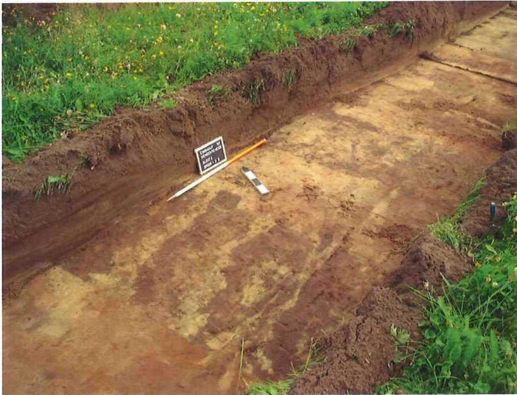
Afbeelding 3: Eindhoven (Laakdal) - Gemeenteheidestraat: sleuf 2 sporen 1, 2 en 3