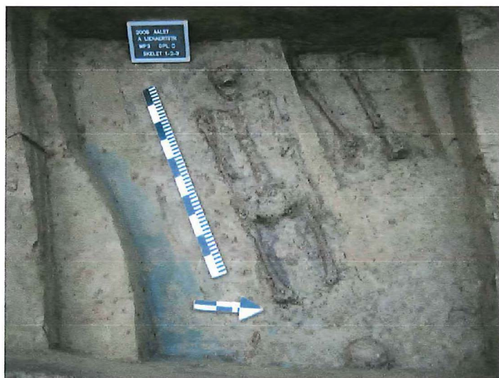
Fig.2 Een aantal inhumaties die verband houden met het pestkerkhof

In een aantal stadsrekeningen wordt de zone buiten de Kapellepoort het Kapelleveld , Sint Ursmaarsmeersch of Guillelmietenmeersch geheten. In alle sleuven werd een vrij homogene grijsbruine licht lemige zandlaag aangesneden die bodemkundig als landbouw of weilandgrond kon geïnterpreteerd worden. In sleuf I dekte deze cultuurlaag een grafkuil met kistbegrafing af die op basis van deze relatieve chronologie wellicht in verband moet gebracht worden met de laatmiddeleeuwse fase van het klooster op deze plaats. Van die inhumaties in genagelde kisten, die opvallend in een smalle strook gegroepeerd zaten, was het stratigrafisch verband niet bewaard. De overige kistbegraveningen zitten door deze weilandlaag gegraven en behoren vermoedelijk tot de begravingen van het pestkerkhof. C14-onderzoek op het menselijk botmateriaal zal een nauwkeuriger datering moeten toelaten (fig.2).