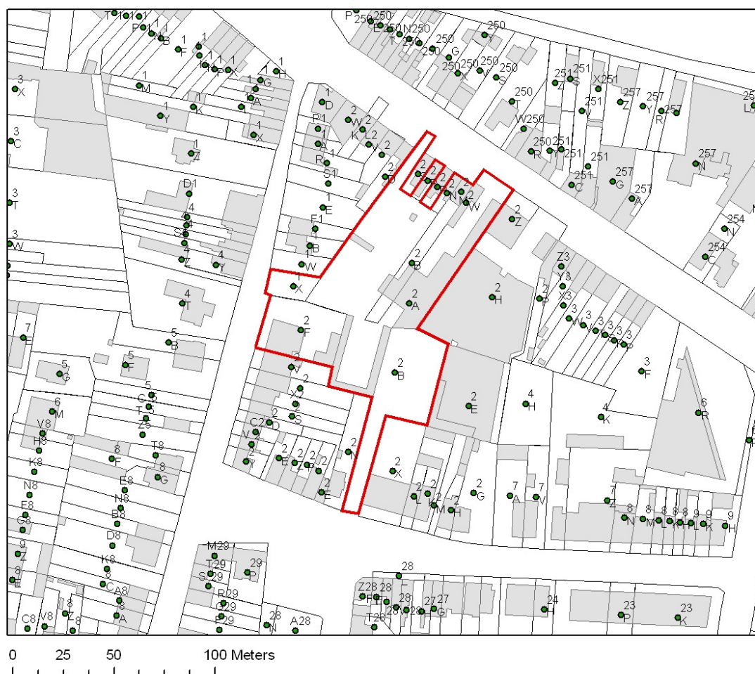
Fig. 1 Kadastrale kaart met aanduiding van het projectgebied in het rood.

Op de bodemkaart is het gebied niet gekarteerd. De aangrenzende zones staan beschreven als (matig) droge licht-zandleemgronden met diepe antropogene humus A horizont (Pbm en Pcm).