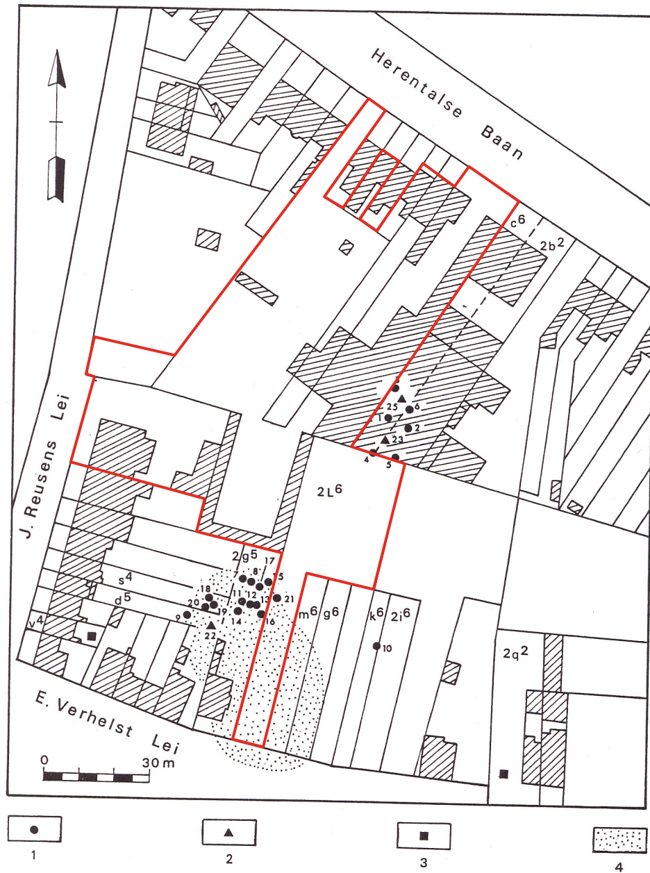
Afb. 2 — Ligging der graven en kuilen - Situation des tombes et des fosses 1 : préhistorische graven - tombes préhistoriques. 2 : afvalkuilen - fosses à débris. 3 : losse préhistorische vondsten - trouvailles préhistoriques isolées. 4 : Merovingisch grafveld - cimetière mérovingien.