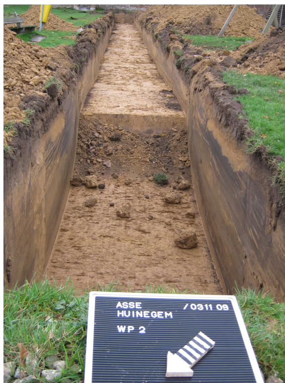
Proefsleuf 2: Ophogingslaag van meer dan 1m