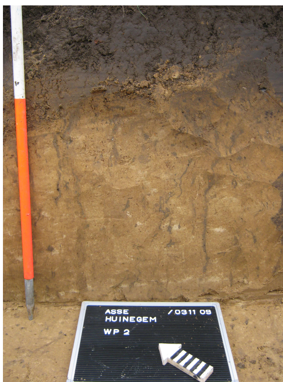
Proefsleuf 2: Ophogingslaag