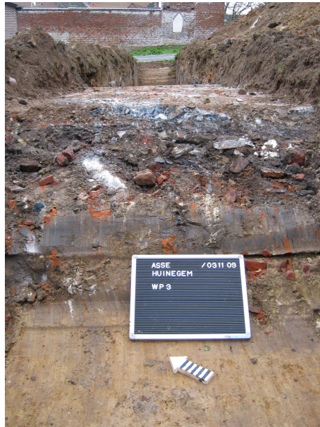
3. Proefsleuf 3: Zware verstoring door puin en beton