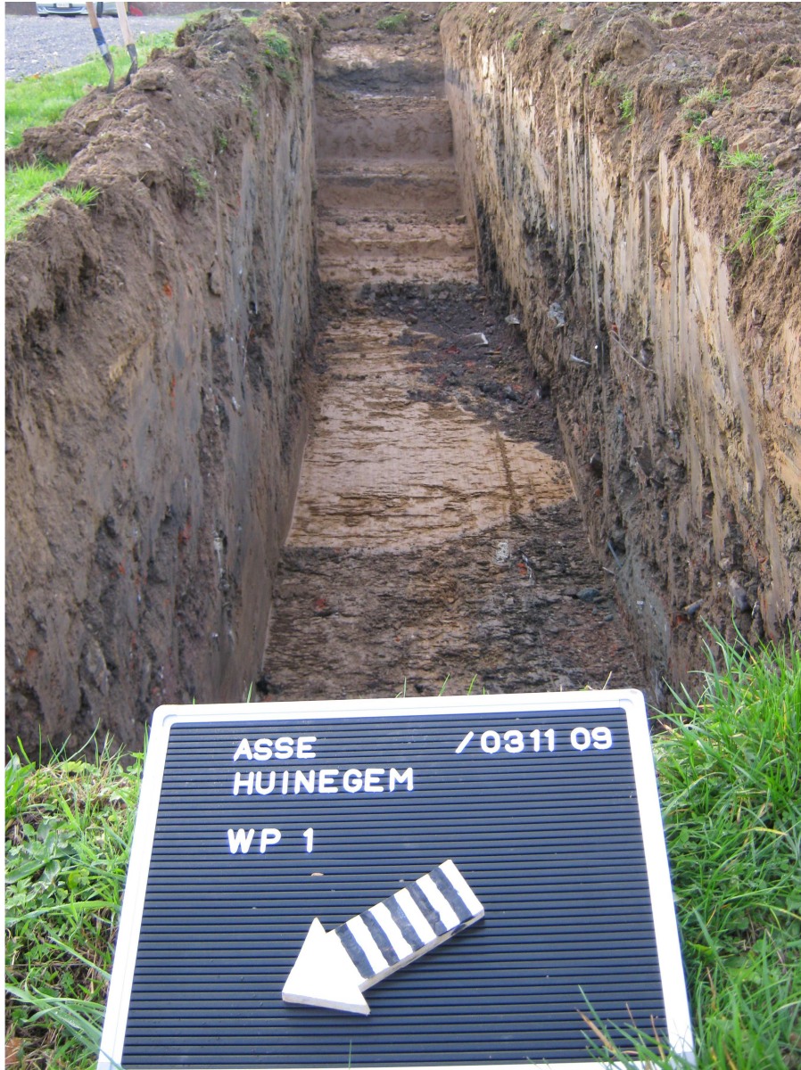
Proefsleuf 1: Ophogingslaag en zware puinverstoreningen tot op een diepte van meer dan 2m