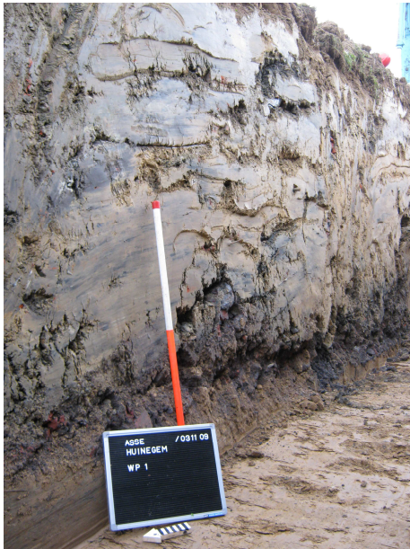
1. Proefsleuf 1: Ophogingslaag

Op het terrein lag een ophogingslaag die op sommige plaatsen tot ca. 2m diep ging (Afbeelding 1, 2 en 3). Het noordelijk deel van het terrein was zwaar verstoord door puin en beton (proefsleuf 1 en 3). Onder de ophogingslaag bevond zich het archeologisch relevante niveau.