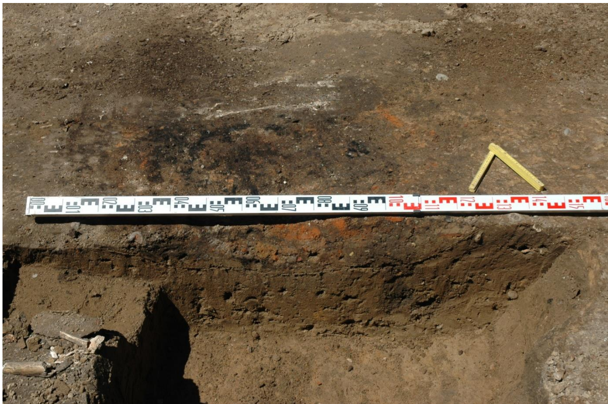
Fig. 4: Coupe van spoor 37.

Nadat de kuil voor de boom gegraven was, werd het profiel van het oventje gefotografeerd en opgetekend (Fig. 4). In profiel is het oventje maar 14 cm diep bewaard.