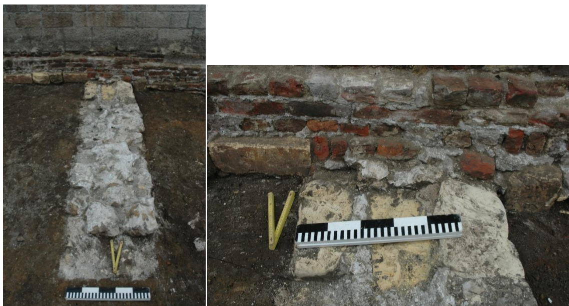
Fig. 7 en 8: Detail van spoor 24.

Een tweede fundering is van heel andere aard. Het gaat om een oudere fundering opgebouwd uit grote onregelmatig gekapte silexblokken die samengehouden worden door een witte kalkzandmortel. Waarvoor deze fundering gediend heeft, is niet duidelijk. De aanzet tegen en onder de kerk door is ook met dezelfde witte mortel gemetst, maar hier werden drie grote mergelblokken geplaatst. (Fig. 7 en 8). Tijdens de opgraving in 2001-2002 in de kerk werden geen sporen teruggevonden die op deze fundering aansluiten. Wel kan vermeld worden dat in de oudste fase ook een witte kalkzandmortel werd gebruikt 9 .