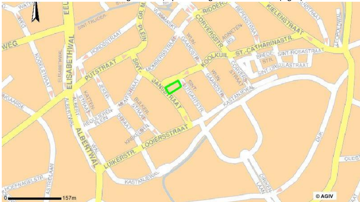
Fig. 1: Situering Sint-Jan-De-Doperkerk.

De Sint-Jan-De-Doperkerk is in het centrum van Tongeren gelegen tussen de Sint-Jansstraat, de Minderbroederstraat en de Sint-Lutgardstraat, op de helling van de Jekervallei (Fig. 1).