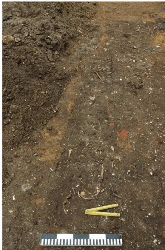
Fig. 3: Spoor 15.

Het volledige opschrift op de voorzijde zou 'URBS ROMA' moeten zijn. Op basis van de iconografie (de gehelmde Constantijn en Romulus en Remus met wolvin met twee sterren) wordt deze munt rond 330 n. Chr. gedateerd.