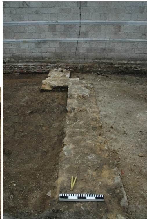
Fig. 9 en 10: Sporen 25 en 27.