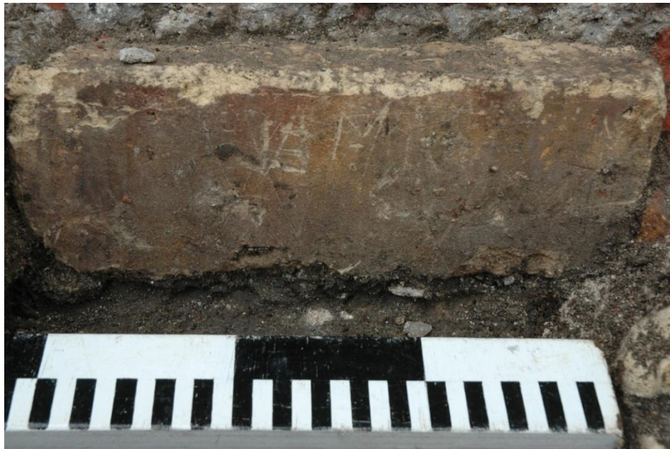
Fig. 6: Graffiti en beschildering op recuperatiemateriaal.

Een tweede fundering is van heel andere aard. Het gaat om een oudere fundering opgebouwd uit grote onregelmatig gekapte silexblokken die samengehouden worden door een witte kalkzandmortel. Waarvoor deze fundering gediend heeft, is niet duidelijk. De aanzet tegen en onder de kerk door is ook met dezelfde witte mortel gemetst, maar hier werden drie grote mergelblokken geplaatst. (Fig. 7 en 8). Tijdens de opgraving in 2001-2002 in de kerk werden geen sporen teruggevonden die op deze fundering aansluiten. Wel kan vermeld worden dat in de oudste fase ook een witte kalkzandmortel werd gebruikt 9 .