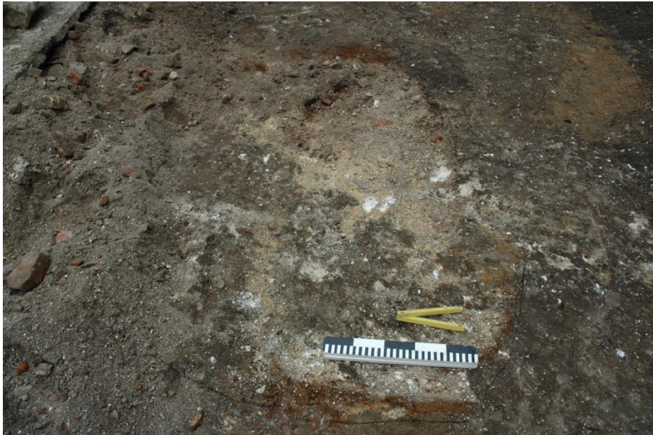
Fig. 11: Detail van spoor 18.