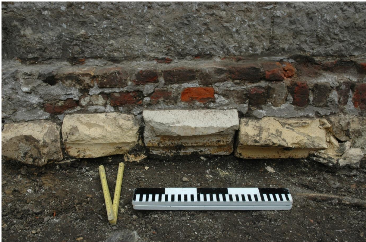
Fig. 5: Fundering uit recuperatiemateriaal.

Een eerste fundering die besproken dient te worden is die van de kerk zelf. Deze was over de volledige lengte van de kerk zichtbaar geworden. Ze is voornamelijk opgebouwd uit baksteen, maar voor een groot deel werd ook recuperatiemateriaal gebruik dat afkomstig lijkt te zijn van onder andere een oudere geprofileerde kroonlijst. Het gaat om mooi gekapte mergelblokken van verschillende formaten (Fig. 5).