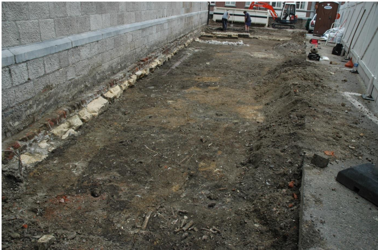
Fig. 2: zicht op de werkzone.

Langs de noordzijde van de kerk werd ook het plein heraangelegd. Hierdoor is op deze plaats de volledige bestrating weggehaald met een deel van de verstoorde bovenste laag. Dit was een pakket van ongeveer 30cm dik. Hieronder is het volledige vlak opgekrabd met een truweel. Daarna zijn de sporen ingekrast en zijn zowel het vlak als de afzonderlijke sporen gefotografeerd en ingetekend op schaal 1/20 (Fig. 2). Vermits de riolering enkel langs de fundering van de kerk zou komen en hier reeds een oudere rioolbuis aanwezig was, is op deze plaats de oude verstoring tot op diepte uitgegraven om zo geen verdere verstoringen in de archeologische sporen te veroorzaken. Voor de aanleg van het plein zou op drie plaatsen een boom geplaatst worden. Deze zijn uitgegraven tot op diepte en ook hier werden de profielen schoongemaakt, ingekrast, gefotografeerd en ingetekend op schaal 1/20.