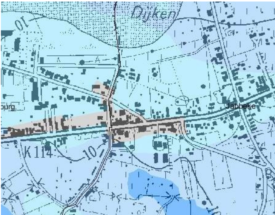
4 Uittreksel uit de bodemkaart, droog zand

Het te onderzoeken terrein bevindt zich midden in de zandstreek wordt gekenmerkt door een drige zandgrond.