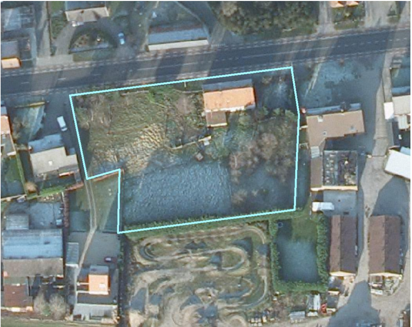
2 Lokalisatie van het te onderzoeken terrein op de orthofoto.