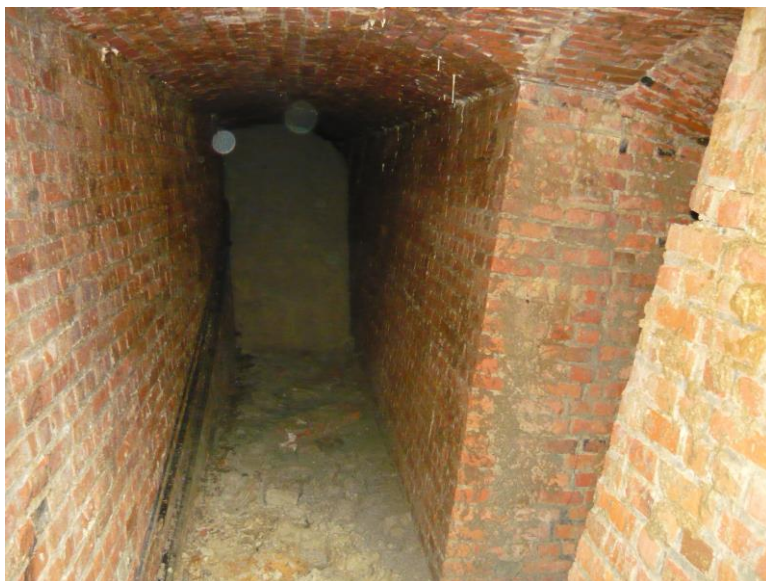
Fig. 1 Zuidwestgang met puin onderin en afsplitsing richting noordwesten.