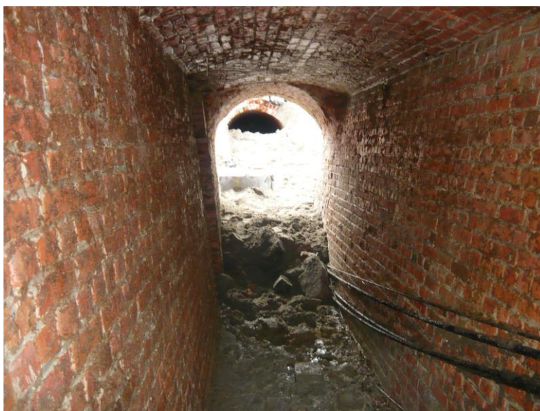
Fig. 2 Zicht vanuit de zuidwestelijke gang met het door de rioleringsput vernielde stuk en de niet toegankelijke gang richting noordoosten.

De structuur heeft een minimum hoogte van 120cm. Binnenwerks heeft deze een breedte van 120cm en buitenwerks 191cm. De muren in opstand hebben een dikte van 37-38cm en het gewelf heeft een dikte van 20cm (fig.3). Het hoogste punt van de gewelf bevindt zich op 8,96mTAW. (fig.4)