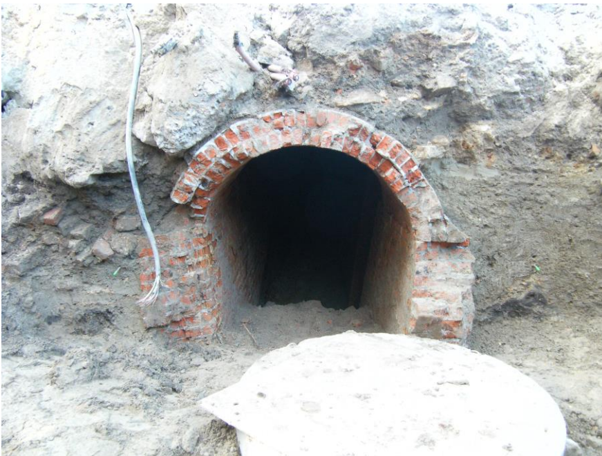
Fig. 4 Detail van de gang richting zuidwesten.