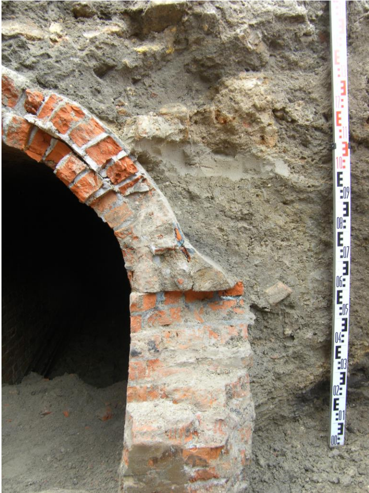
Fig. 3 Detail van de aanzet van het gewelf.