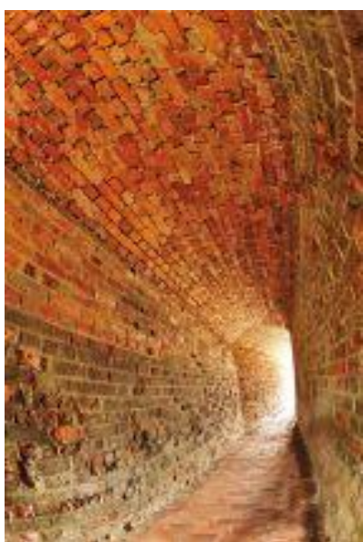
Fig. 5 Overdekte bakstenen gang zoals aangetroffen op het domein te Raversijde.

In tegenstelling tot wat de naam doet vermoeden bestond de Atlantikwall niet uit een aaneengesloten geheel van verdedigingswerken maar uit verschillende kustbatterijen, versperringen en ondersteuningsbunkers die op strategische plaatsen werden aangelegd. In Raversijde, net ten westen van Oostende is een gedeelte van deze Atlantikwall (fig.5), bestaande uit ondergrondse en open loopgraven en diverse types bunkers (geschuts-, observatie-, artillerie, personeels-, en communicatiebunkers) en personeelsverblijven, geschutsstellingen over een afstand van 800m bewaard en gerestaureerd. Op die locatie bleef ook een gedeelte van batterij Saltzwedel Neu bewaard, gebouwd door de Kriegsmarine vanaf 1941, die oorspronkelijk de Oostendse haven moest verdedigen en vanaf 1942 werd ingeschakeld in de Atlantikwall. Een aantal van de bunkers uit deze batterij werden verbonden door lange overwelfde bakstenen gangen.